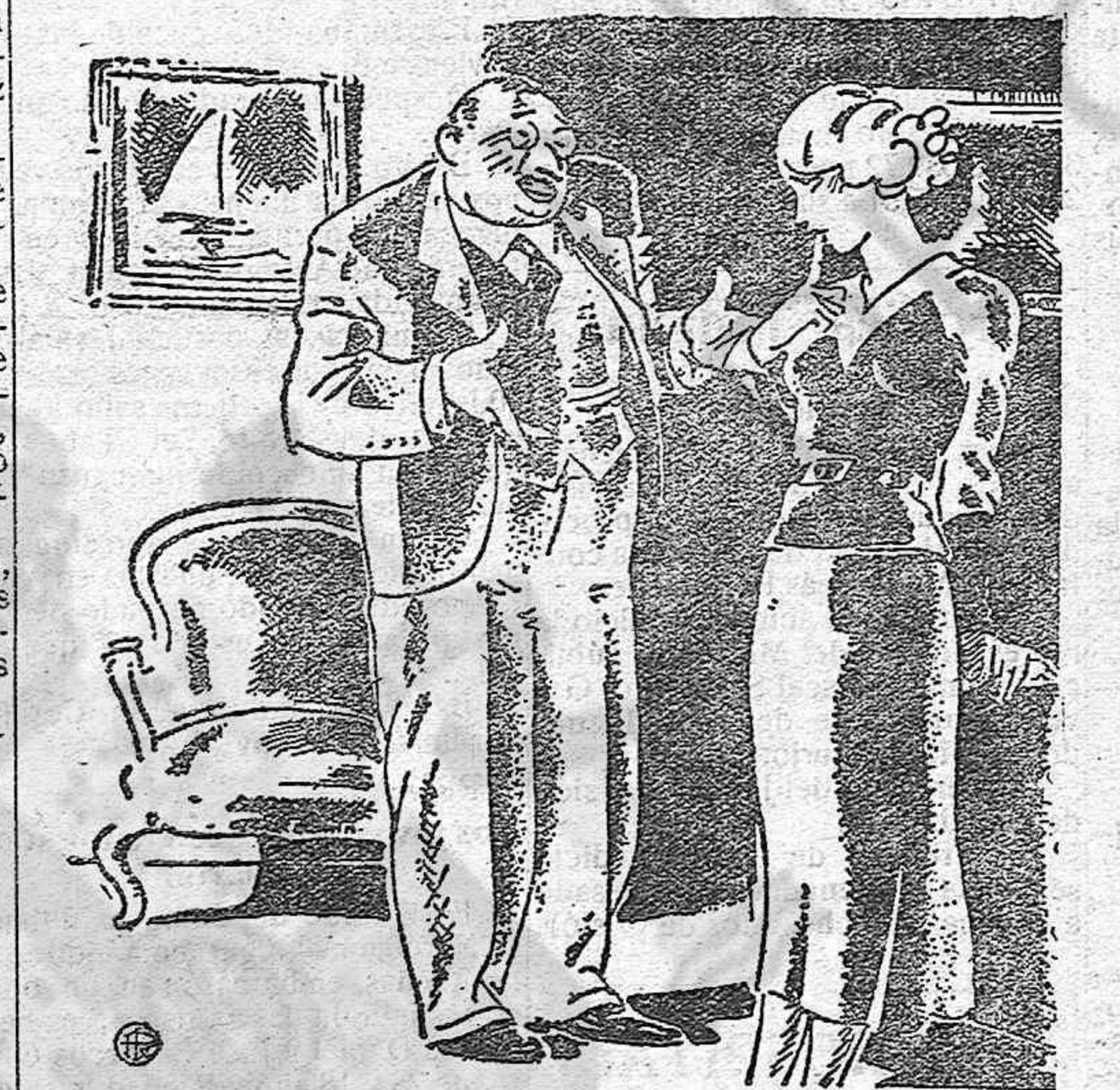
Pablo ha venido a pedirme tu mano, hijita. ¿Pero no sabes que no quiero separarme de mamá? —No te separarás de ella. Yo le daré permiso para que se vaya a vivir con vosotros.

SALON DE LIMPIABOTAS Plaza de la República, 14 (Loterías)