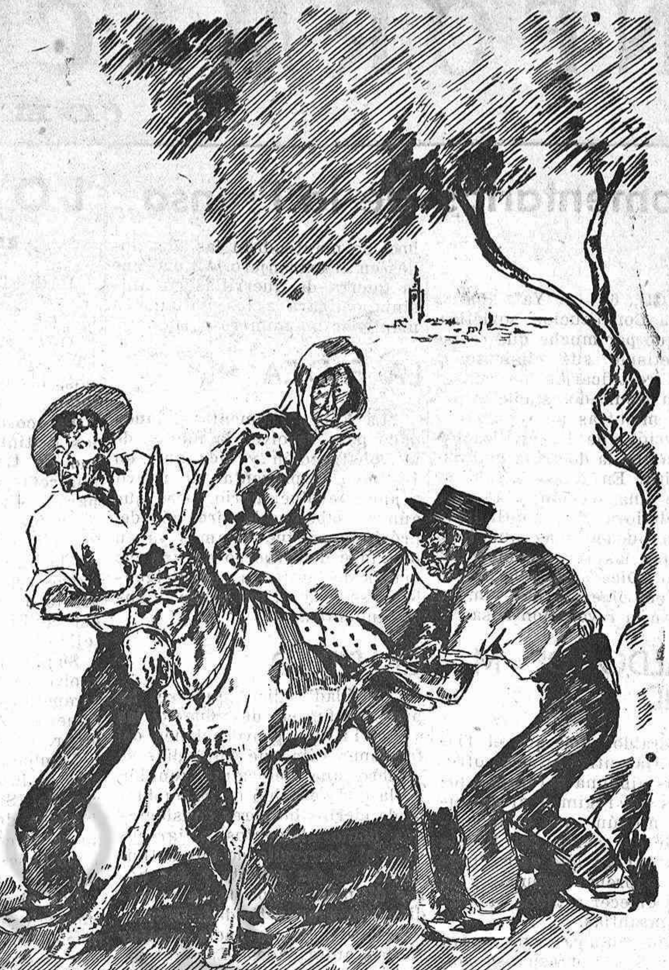
LOS TIEMPOS ADELANTAN... por Martínez de León La voz de socorro de la Radio.—"Se ha perdido un burro de pelo claro, mediana alzada y con un gran lucero negro en la frente. Lo busca la Guardia Civil"

Escuche Vd. los famosos Philips "todas las ondas", "Receptod" y "Nautilus", que reciben con extraordinaria musicalidad todas las emisoras del mundo.