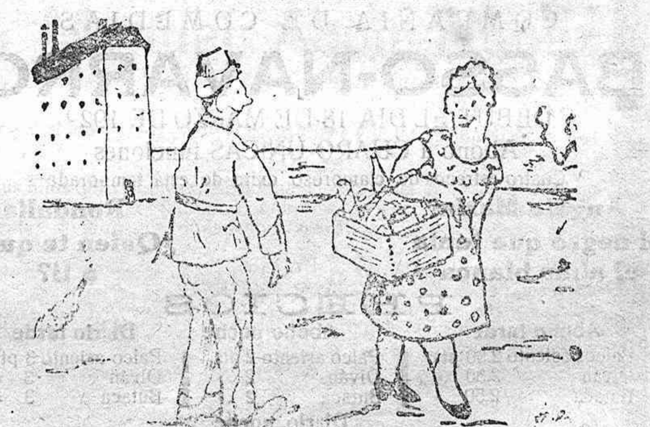
- Con mucho gusto, le llevaría a usted la cesta señorita Frida; pero temo encontrarme al capitán. - ¿Tan celoso es?