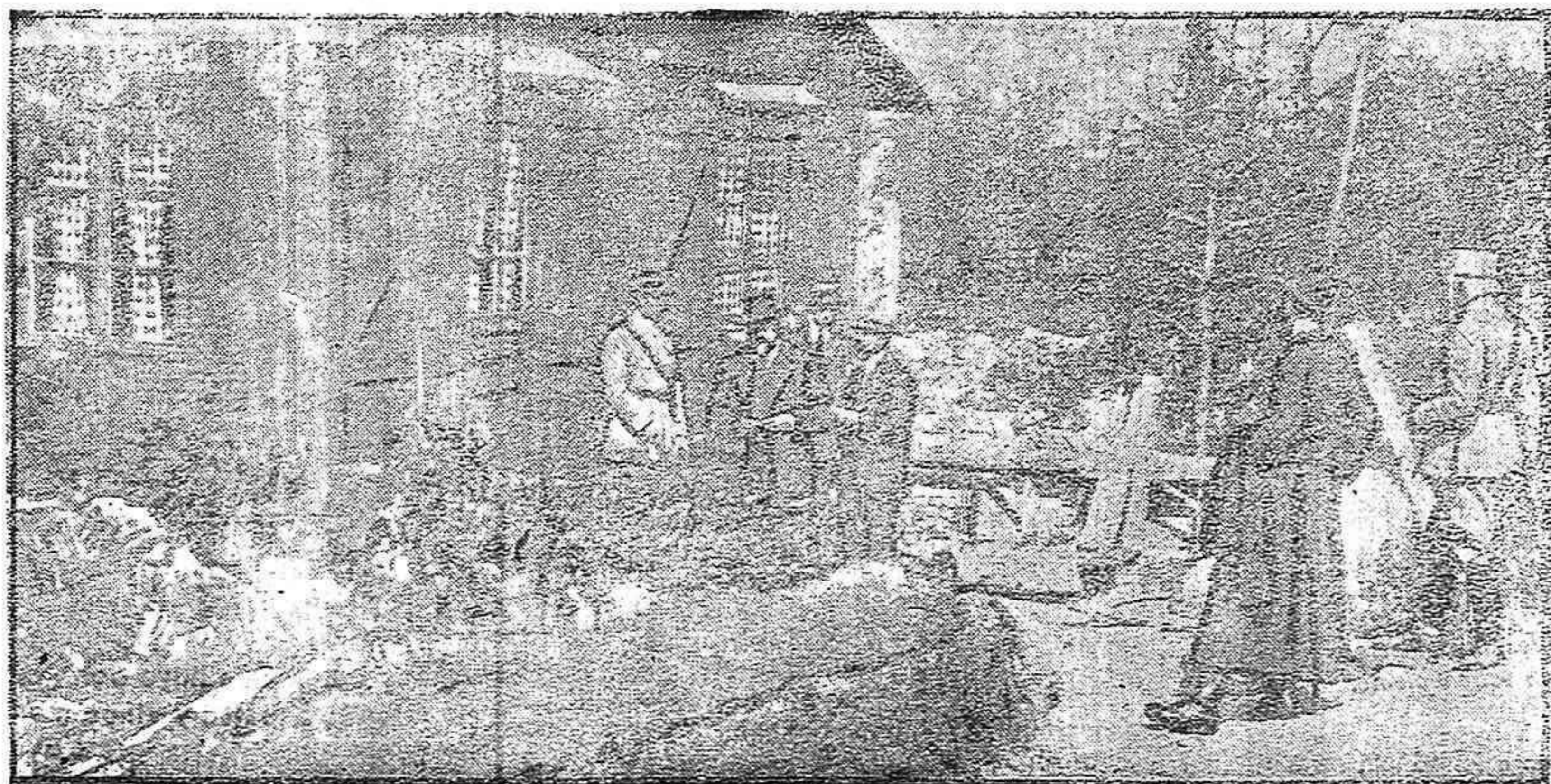
De la guerra.—Casa desmontable

¿Otro obispo polaco?— Dos abogados. Pruebas con el bote salvavidas. Otras noticias. En los primeros días de la pasada semana llegó a Ribades un extranjero con ropas tales, algo parecidas a los hábitos de los monjes benedictinos. Hospedóse en uno de los principales oteles.