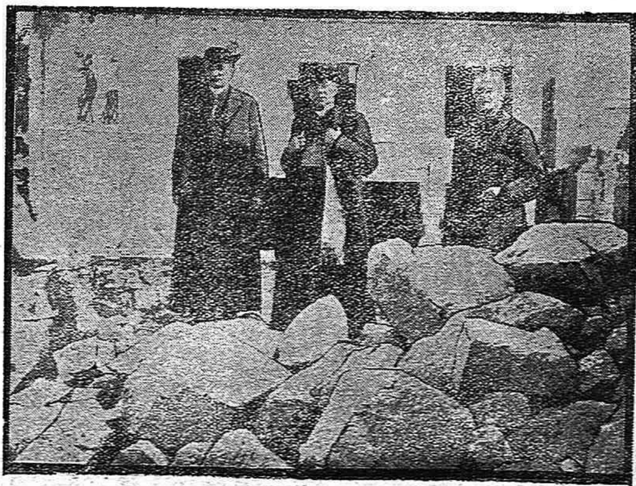
El obispo de Beauvais visitando las ruinas de una iglesia