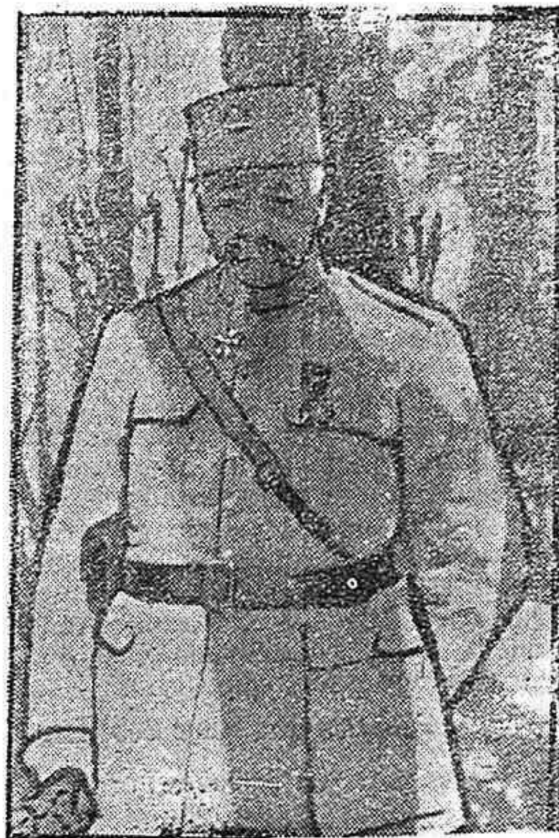
El general francés Antoine.

El amor del buque lo presenciaron muchísimas personas.