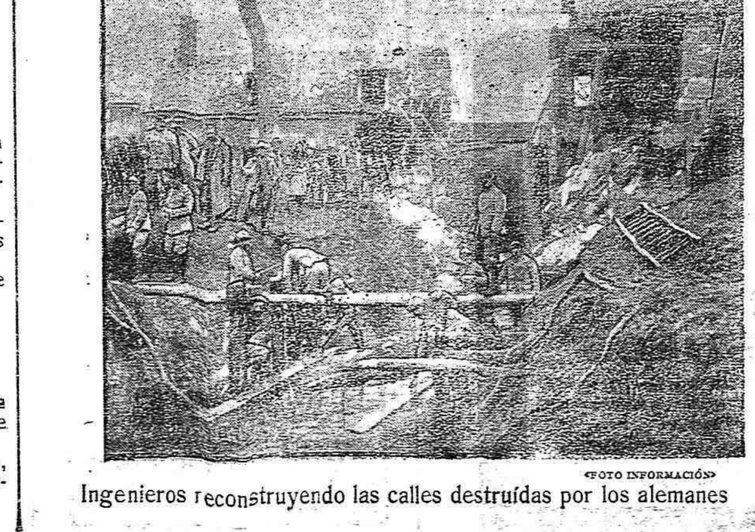
Ingenieros reconstruyendo las calles destruidas por los alemanes

Su muerte, súbita y por lo tanto inesperada, ha producido dolorosísima sorpresa entre las muchas relaciones y amistades que el ilustre finado contaba en Ribadeo, de donde era oriundo.