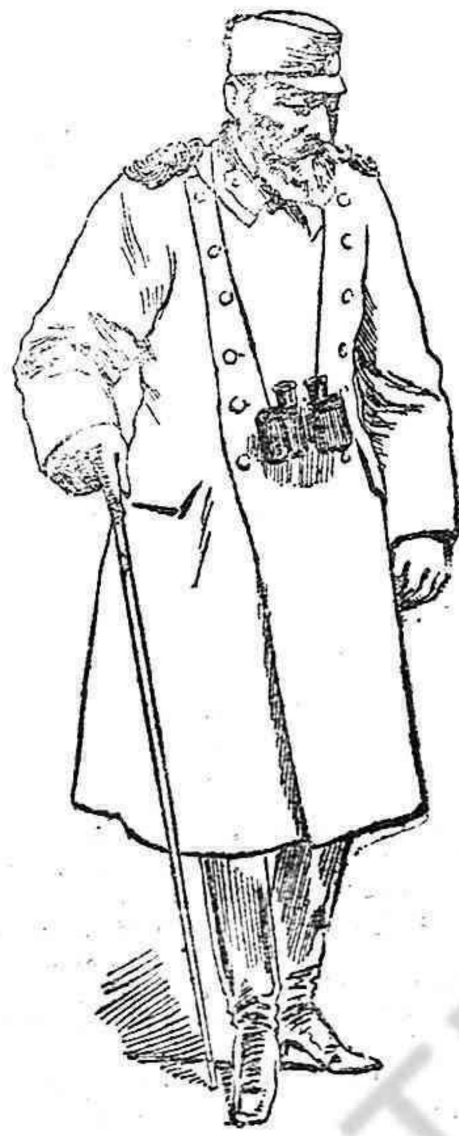
Ultimo retrato del Rey I de Serbia