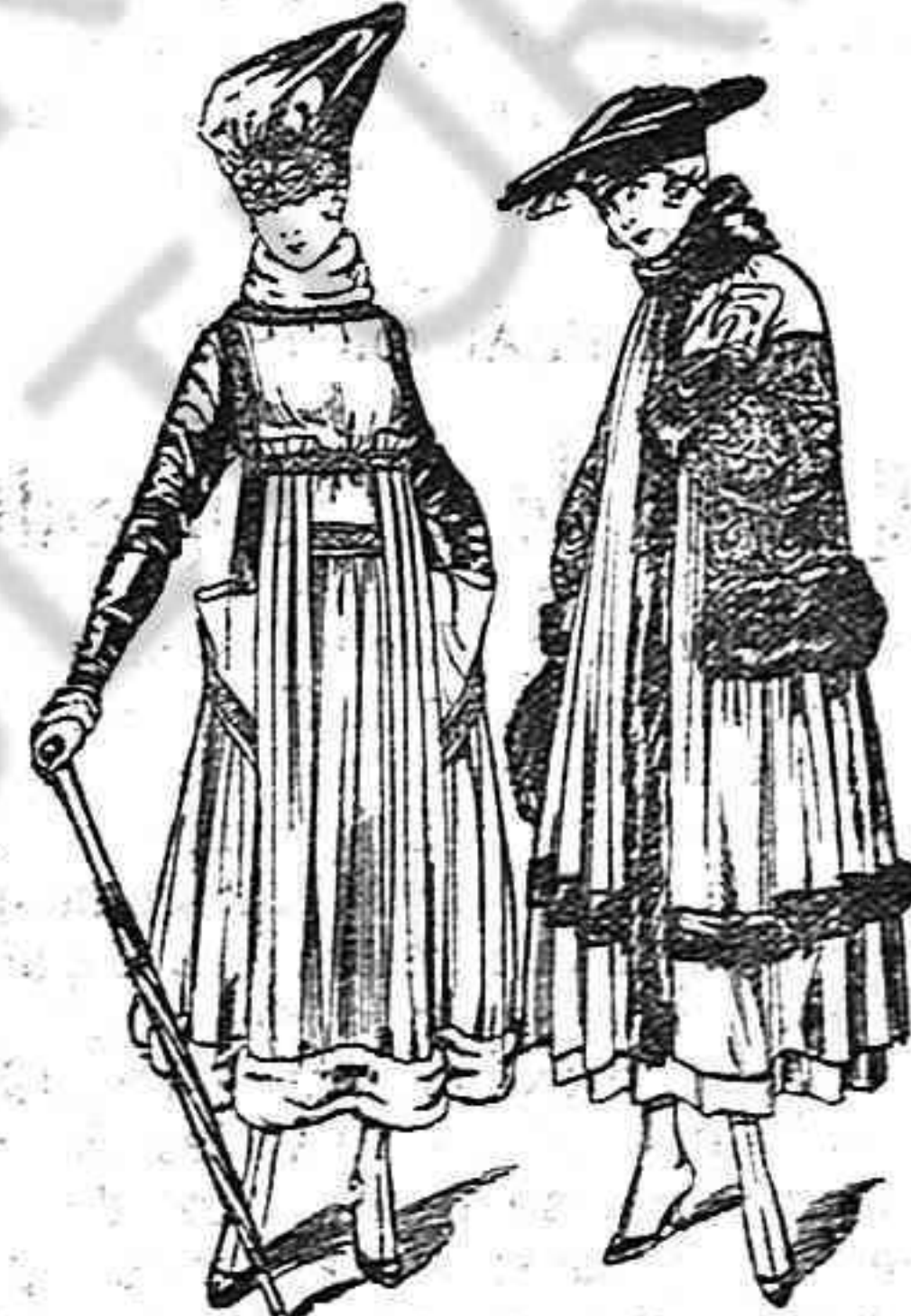
La falda es sencilla de tejido del mismo to-

Digamos algo sobre los trajes sastré, los chalecos y los bordados. El gusto actual se inclina a los paletos sacos rectos, del ancho justo de las caderas. Se hacen de paño, de jerga, de tibetina, en los clásicos y conocidos, azul habana, rojo viejo, nutria, verde botella, etc. Estos paletos, muy abiertos por delante, dejan ver un rico chaleco bordado, que forma una prenda independiente copia del verdadero chaleco de hombre; es de seda por detrás y por delante de tejido o satén cerrado con tres botones. Lleva bolsillos falsos, y bordados complicados que dan carácter femenino a este elegante adorno. Los bordados color ladrillo hacen bien sobre satén negro para acompañar a un traje sastré de azul marino mientras que la jerga azul se bordará el chaleco de gris o de fiski; para el verde, el rojo hace maravillas; la jerga blanca deberá bordarse con satén bordado de malva tierna. Estos bordados se hacen sobre el mismo tejido.