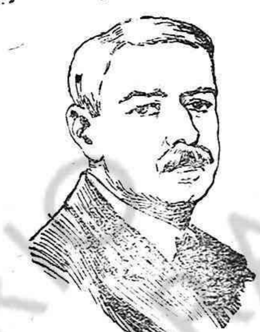
Mr. Lansing, ministro de Relaciones Exteriores de los Estados Unidos

«El Gobierno alemán no duda que el Gobierno de los Estados Unidos demandará, sin dilación y con toda la insistencia posible, del Gobierno británico, la observación inmediata de las reglas del derecho de gentes. Si las gestiones del Gobierno norteamericano no logran el resultado deseado, el Gobierno alemán se hallará en una situación nueva ante la cual se reserva plena y entera libertad de acción.»