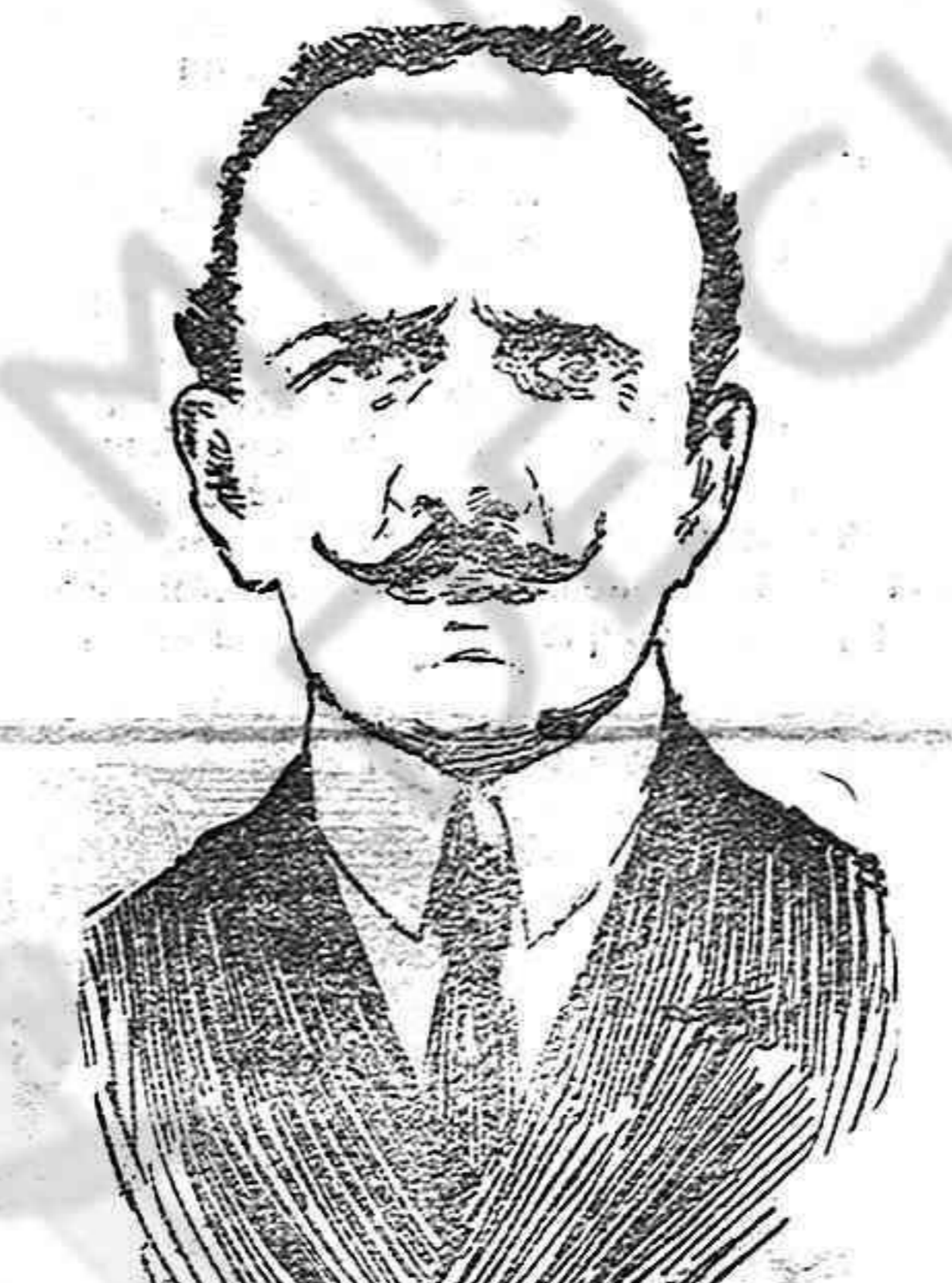
El conde Bernstorff, embajador de Alemania en Washington.

Ante la nota alemana anunciando el torpedeamiento sin previo aviso de los buques de cualquier orden que encuentren los submarinos en determinadas zonas, el presidente norteamericano, sin mayores consultas ni reclamaciones, ha roto las relaciones diplomáticas con el Gobierno alemán. A estas horas no se sabe todavía nada concreto sobre las consecuencias que tendrá esta ruptura. ¿Van los Estados Unidos a la guerra? ¿Se prestará Alemania a hacer concesiones para evitar la entrada en la lucha de este nuevo poderoso enemigo? No se tardará mucho en salir de dudas. El momento es grave para todos los países neutrales pero lo es particularmente para los Estados Unidos, por los antecedentes que tiene allí la cuestión de los submarinos. Ya cuando Mr. Wilson lanzó su nota invitando a los beligerantes a puntualizar sus aspiraciones, se dijo, para explicar la intervención algo extraña del presidente, que los norteamericanos estaban directamente interesados en que se entrase en vías de paz, pues, de lo contrario, serían inevitablemente arrastrados a la guerra. Se decía esto pensando en las amenazas de agravación de la guerra submarina que los alemanes habían hecho circular al ofrecer la paz. Los norteamericanos estaban ciertos de que Alemania no amenazaba en vano y veían claro que, en caso de realizar sus anuncios, les sería imposible sustraerse a adoptar decisiones violentas contra el Imperio. Era imposible, en efect-