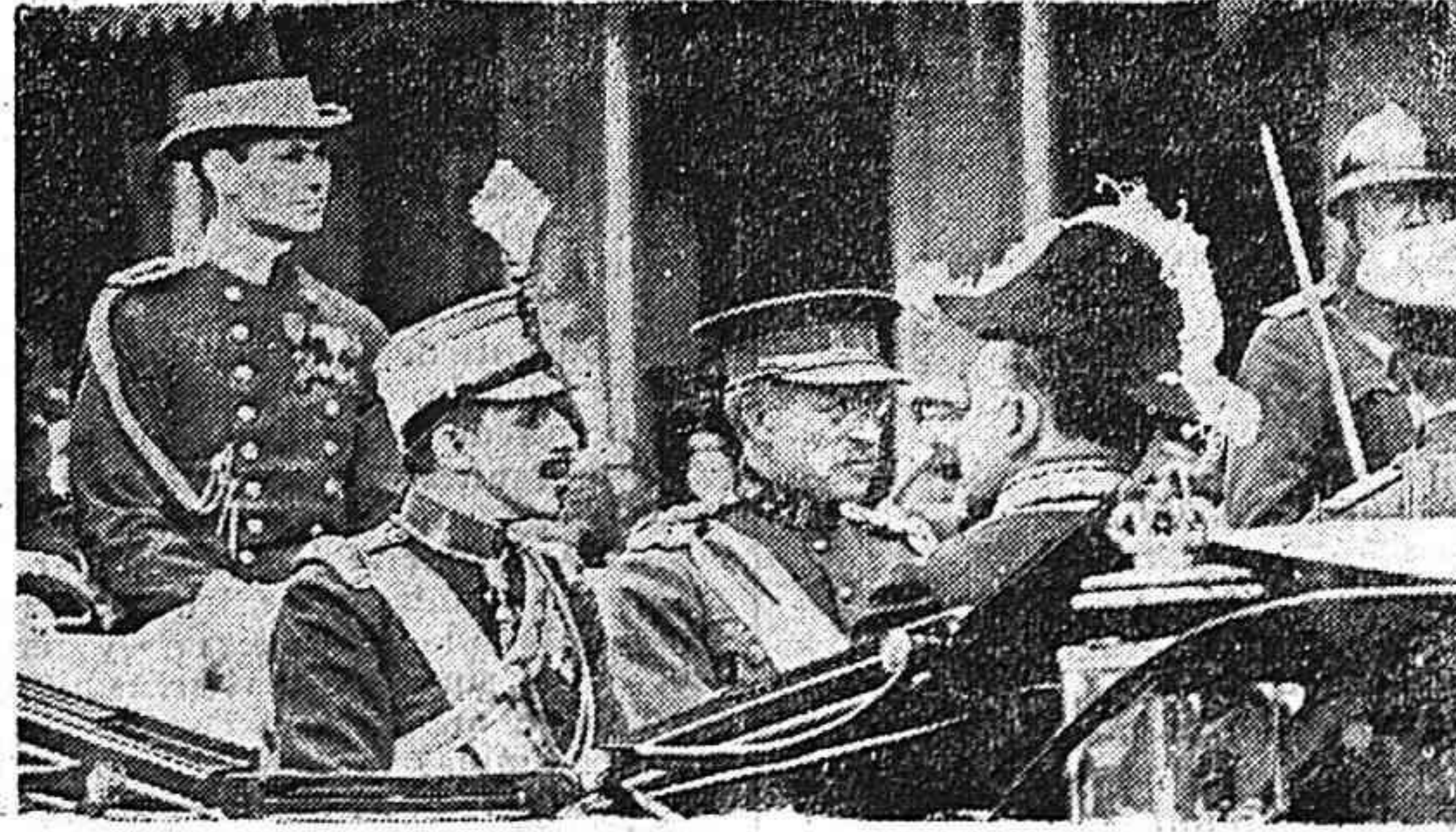
D. ALFONSO Y EL REY ALBERTO A SU LLEGADA A AMBERES