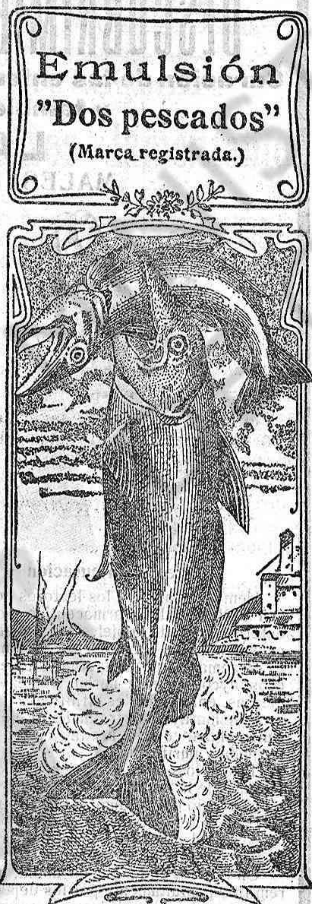
Emulsión "Dos pescados" (Marca registrada.)