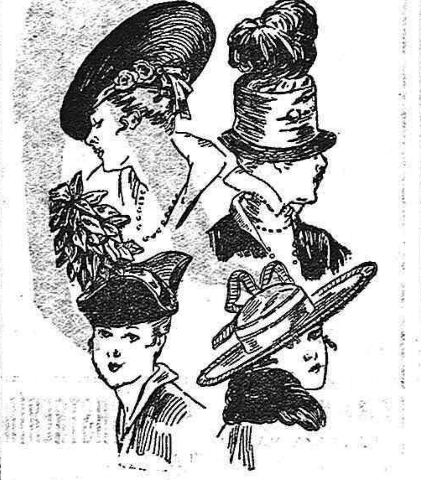
Los sombreros de moda. Varios modelos