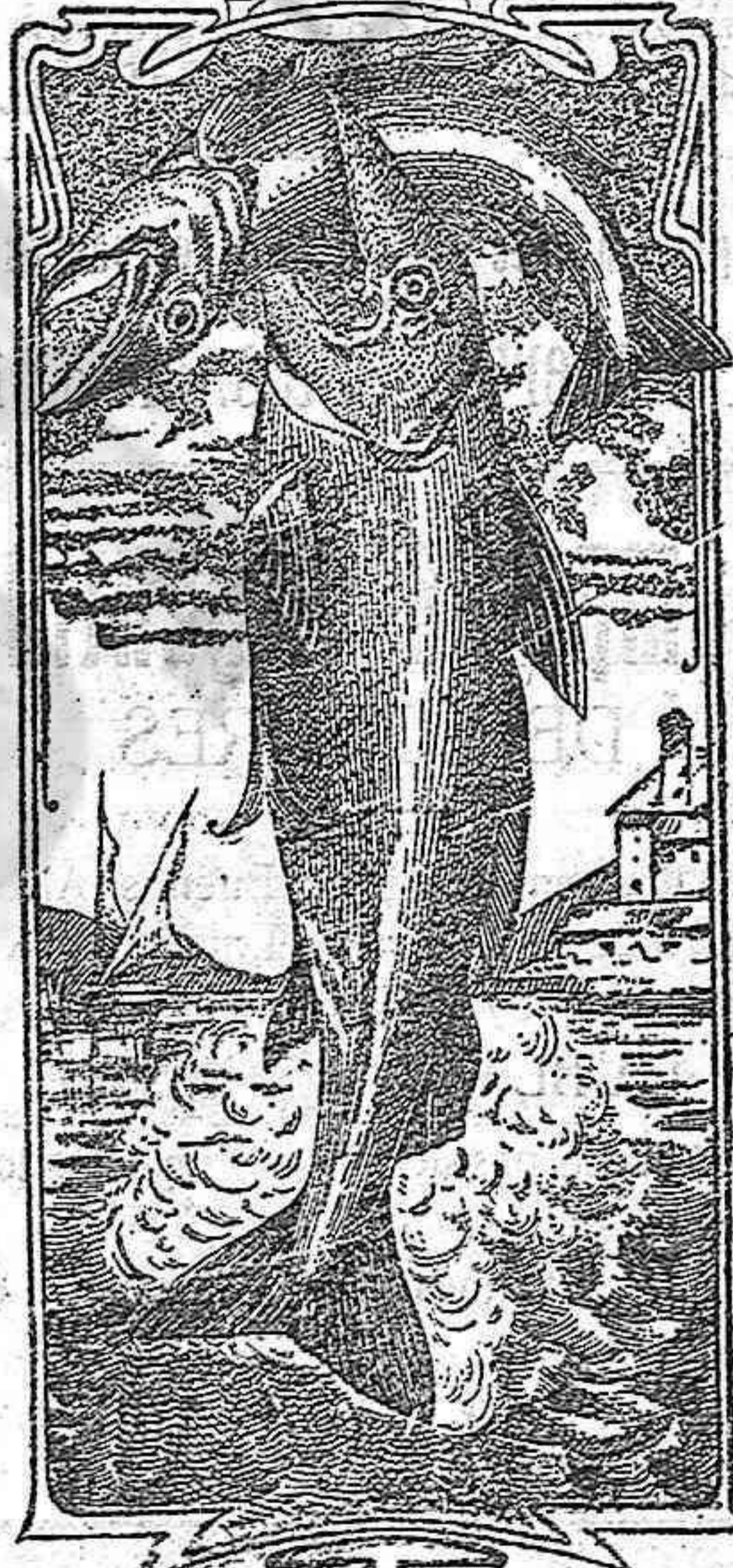
La última palabra

Nos referimos a una nueva y excelente preparación de Emulsión «DOS PESCADOS» (marca registrada) la que compete con todas, las extranjeras y españolas, tanto en calidad como en precio.