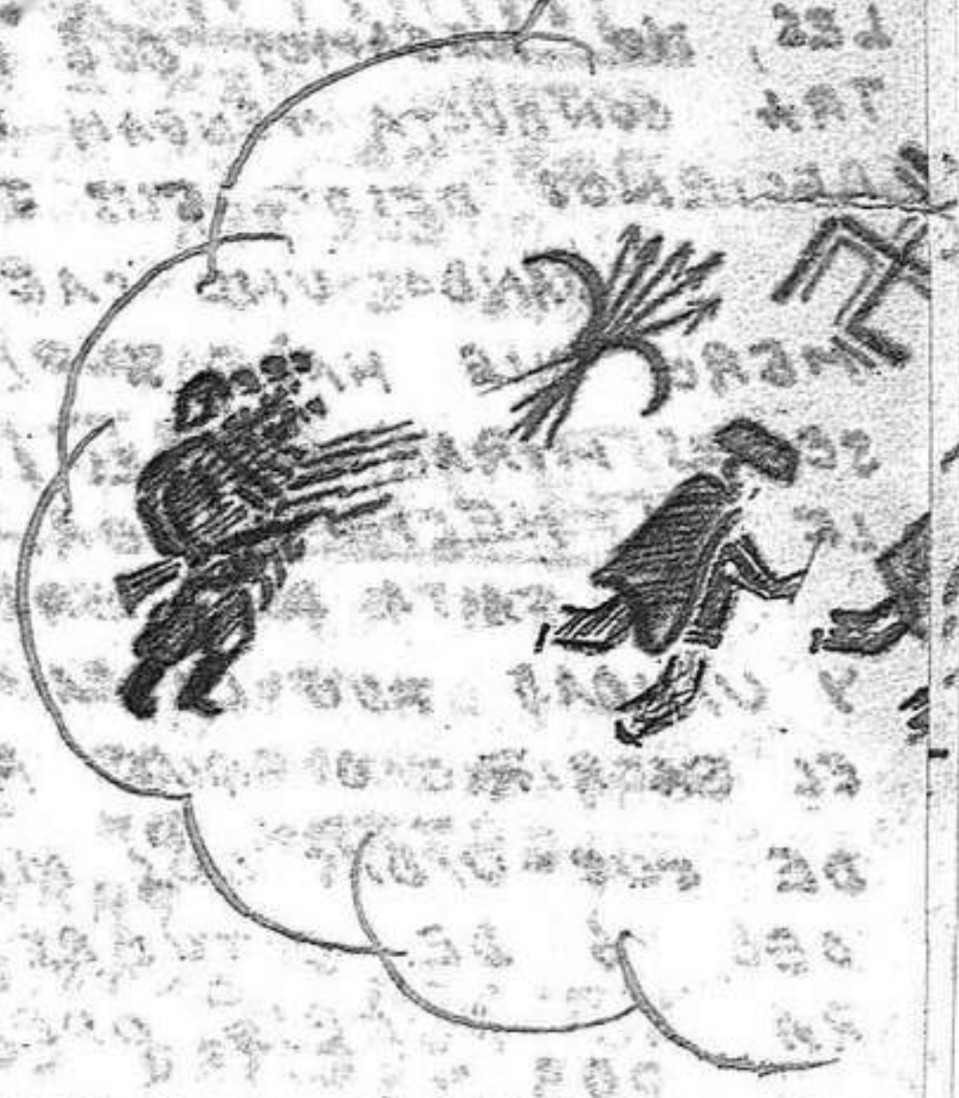
COMO SERA EL MISMO.