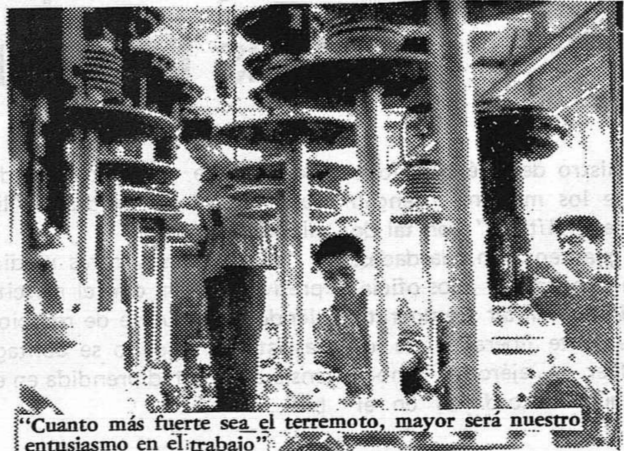
"Cuanto más fuerte sea el terremoto, mayor será nuestro entusiasmo en el trabajo"

El pueblo chino, basándose únicamente en sus propias fuerzas, está salvando todas las dificultades. La producción continuó, a las pocas horas del terremoto, su ritmo normal. Al pueblo chino no le ha faltado nada de lo necesario. Ha demostrado que con las fuerzas propias se pueden vencer todas las calamidades naturales, ha demostrado la superioridad del sistema socialista para salvar cualquier dificultad por muy grande que sea.