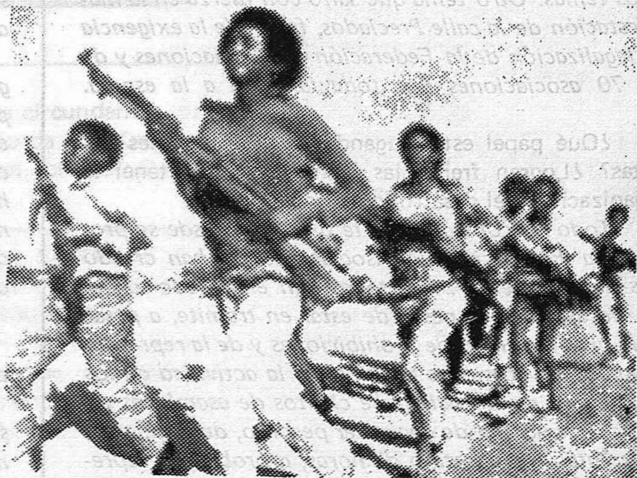
La minoría racista tiene sus días contados

Ni las masivas detenciones y asesinatos, ni las ridículas reformas y concesiones, van a detenerlo. Su lucha es invencible y acabará aplastando a la minoría racista, encabezada por Vorster, y convirtiendo a la población negra en la legítima dueña y administradora de su país.