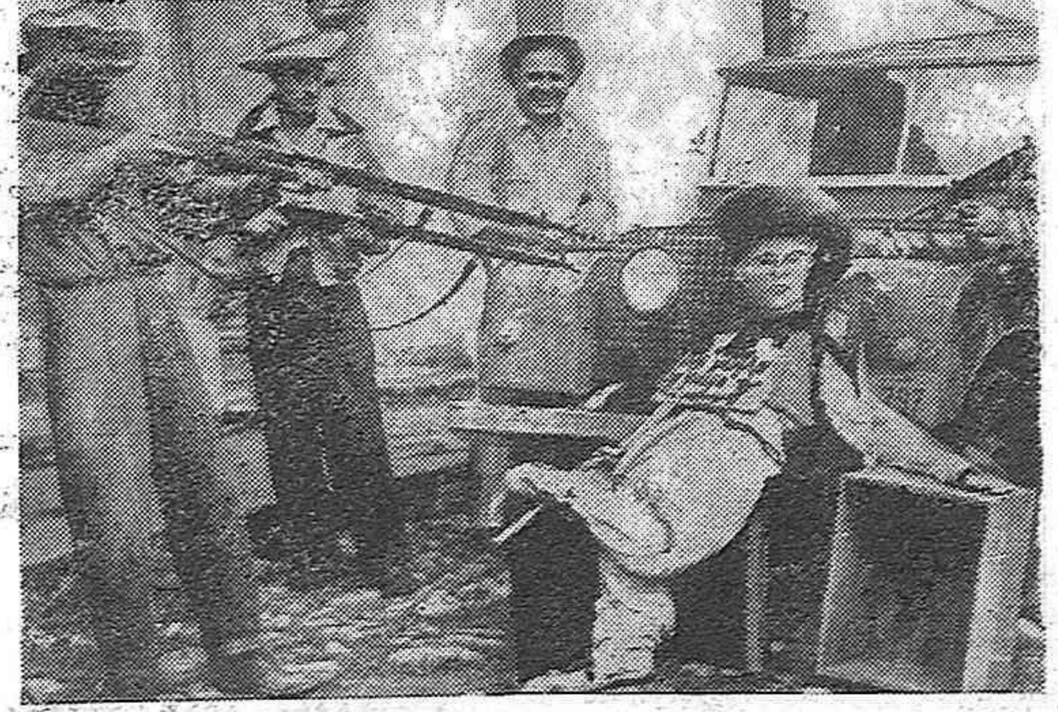
Triunfantes los facciosos en Guatemala, su primer acto de gobierno — al servicio de la « United Fruit » — anula la expropiación de tierras. En las calles, los adictos de la Junta hacen constantes provocaciones, algunas tan ridiculas como la que presenta la foto, que simula ejecución del presidente Arbenz, a quien presentándolo como « comunista » le colocaron un cartel que decía: « Me vuelvo a Rusia con Arévalo », es decir, el anterior presidente, también censurado de « comunista ».