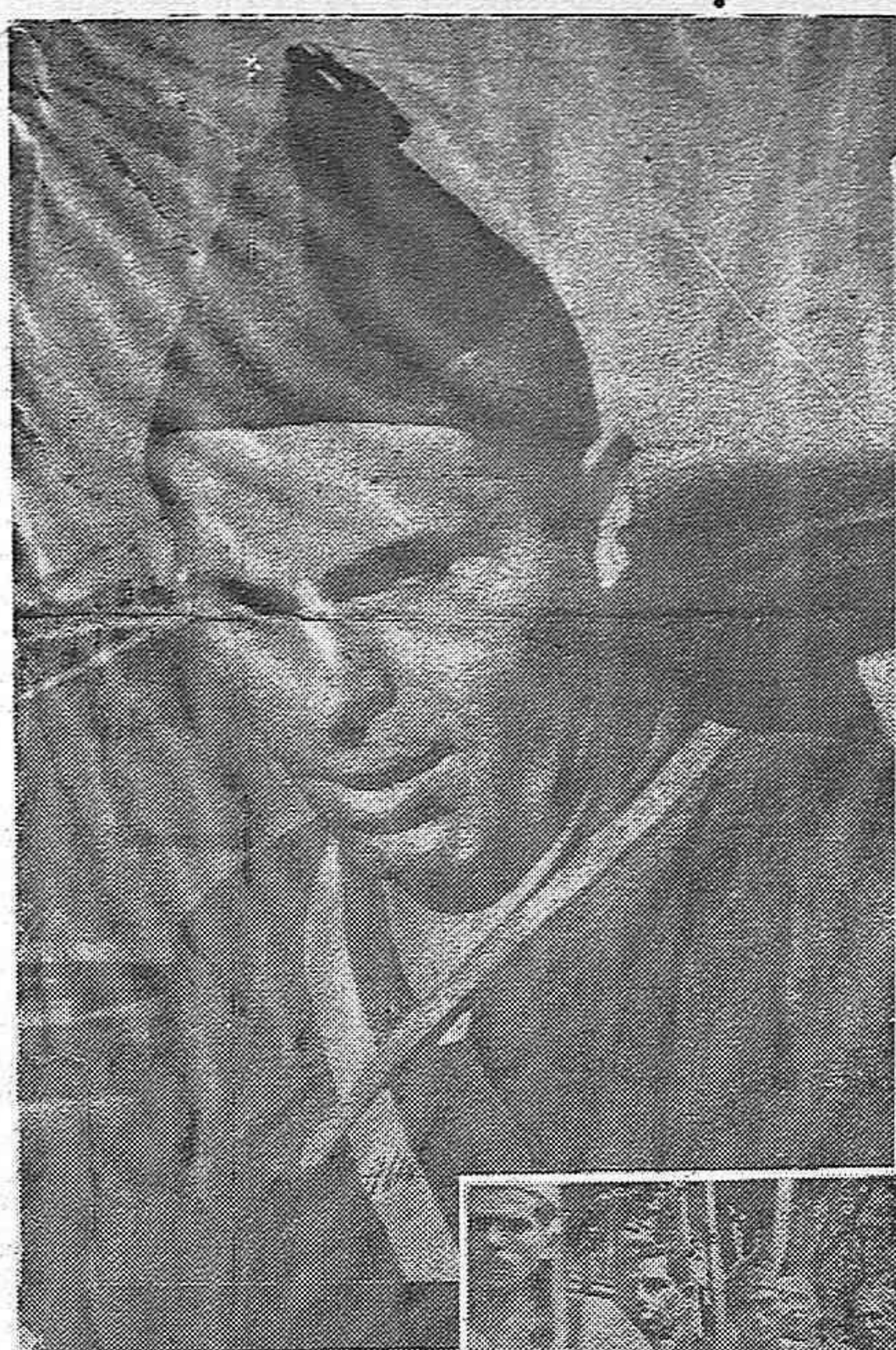
Les militants de la C.N.T. ont donné l'exemple et ont élevé le moral des miliciens.