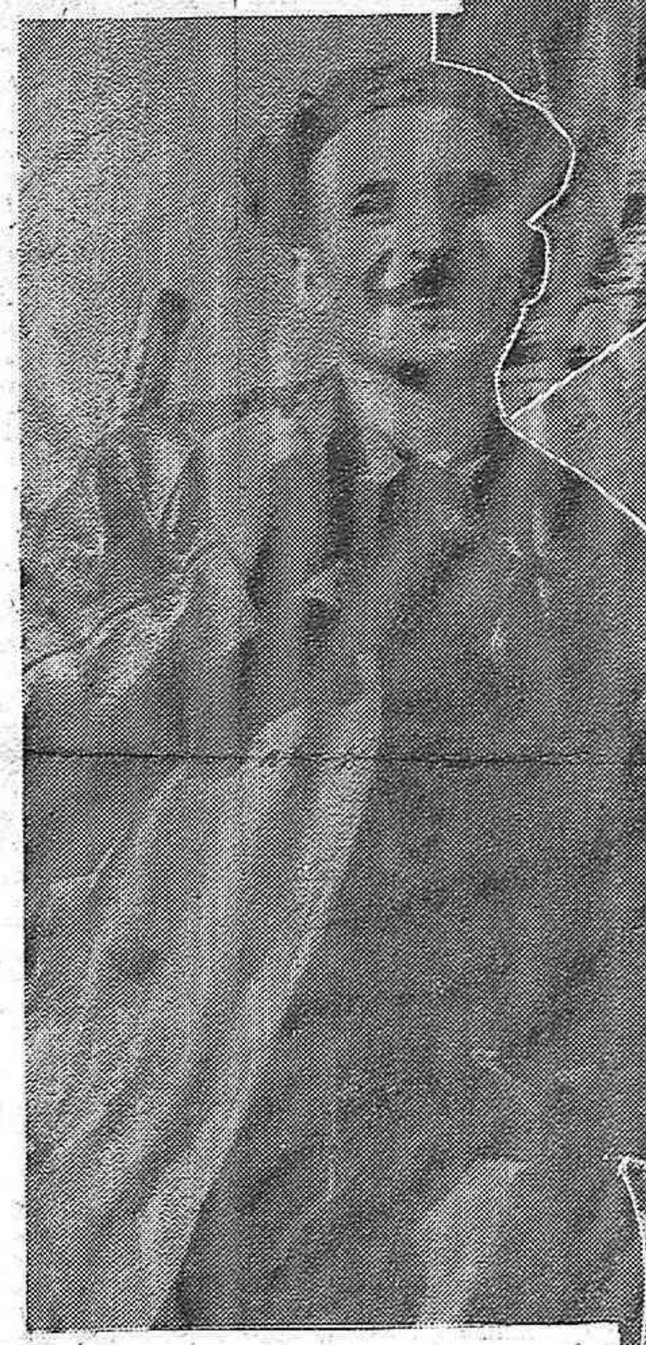
Nos valeureuses femmes ont exalté l'atmosphère de la rue et insufflé le courage dans le cœur des hommes.

U N 19 Juillet de plus ! Et le peuple espagnol continue toujours le combat contre le fascisme. La Confédération Nationale du Travail, le Mouvement Libertaire, avec leur héroïsme, avec leur abnégation de toujours, avec leur œuvre constante, avec leur exemple stimulant, sont à l'avant-garde de ce peuple. Il y a quinze ans que les prétoriens ont réussi à prendre le pouvoir en Espagne. Ils ont tout dévasté. Ils n'ont réussi en rien, sauf à semer misère, ruines et désolations. Ils se sont imposés par la force, contre la volonté populaire. Ils se maintiennent par la force également, en méprisant tout principe moral ou de droit. Quoique saignant par ses blessures, le peuple espagnol redresse la tête. Face à tous ceux qui font des concessions à la tyrannie, le peuple espagnol donne toujours au monde un exemple de dignité et de décence éternelles.