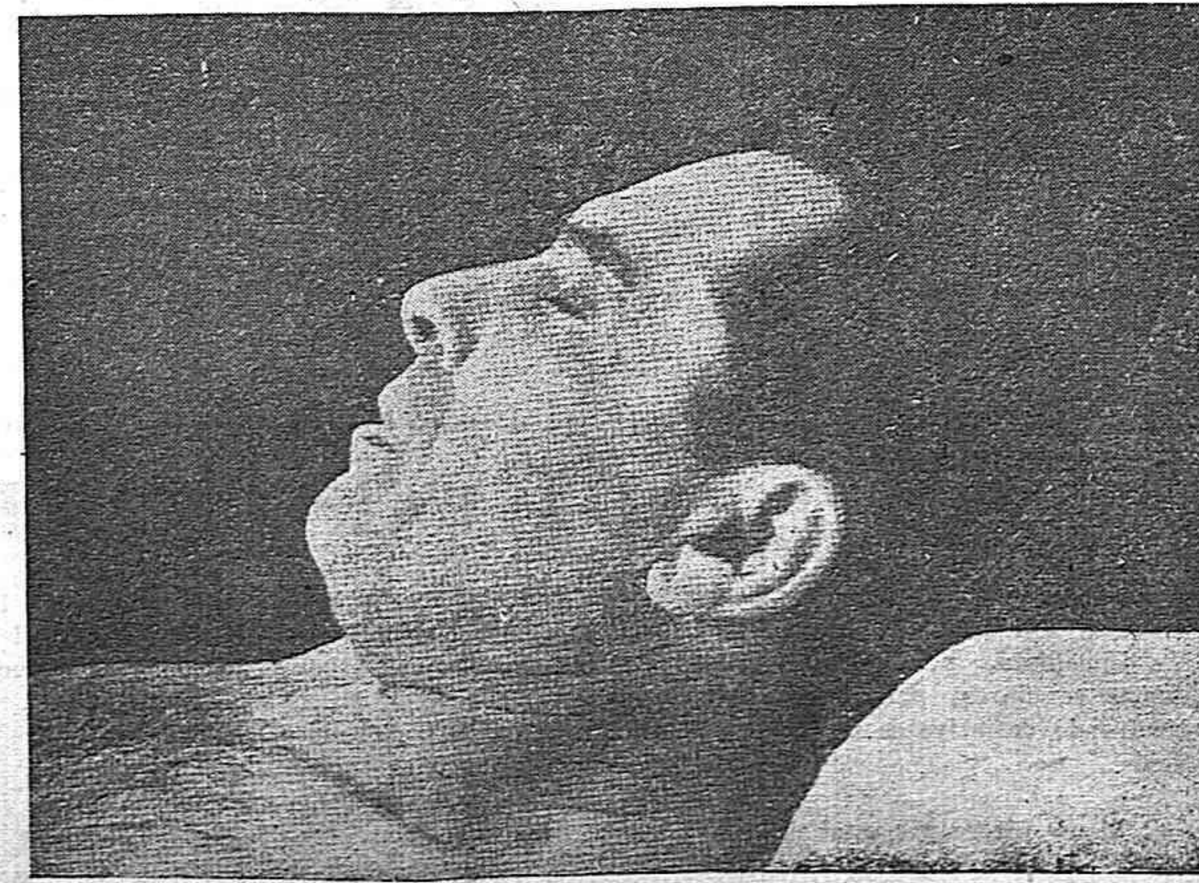
"Porque con él yacente, yacente está España..."

Como Buenaventura, hémos presentes en la hora difícil; más difícil que las primeras horas de la defensa de Madrid. Más, queda heroísmo en nuestras filas, y firmeza de ideal. Quince años de miseria de todas clases no han podido vencerlos. A miles hemos enterrado a los compañeros, pero ninguno de nosotros ha enterrado su ilusión. Somos ricos en seguridad, y por esa riqueza venceremos.