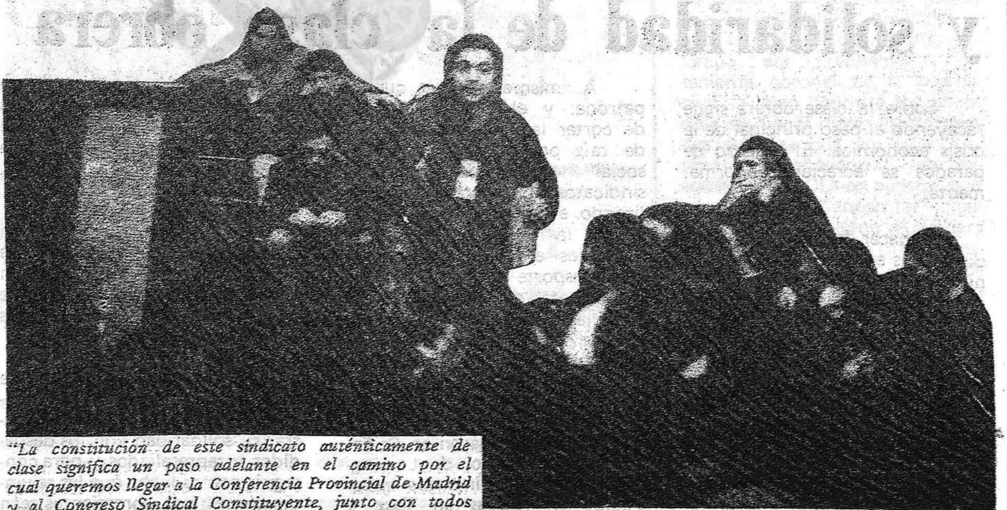
"La constitución de este sindicato auténticamente de clase significa un paso adelante en el camino por el cual queremos llegar a la Conferencia Provincial de Madrid y al Congreso Sindical Constituyente, junto con todos los sindicatos unitarios y de clase de España"

En medio de un gran ambiente de entusiasmo por el triunfo alcanzado, la conferencia terminó a los gritos de ¡Viva la clase obrera! ¡Viva la unidad sindical! ¡Viva el Sindicato de Clase! ■