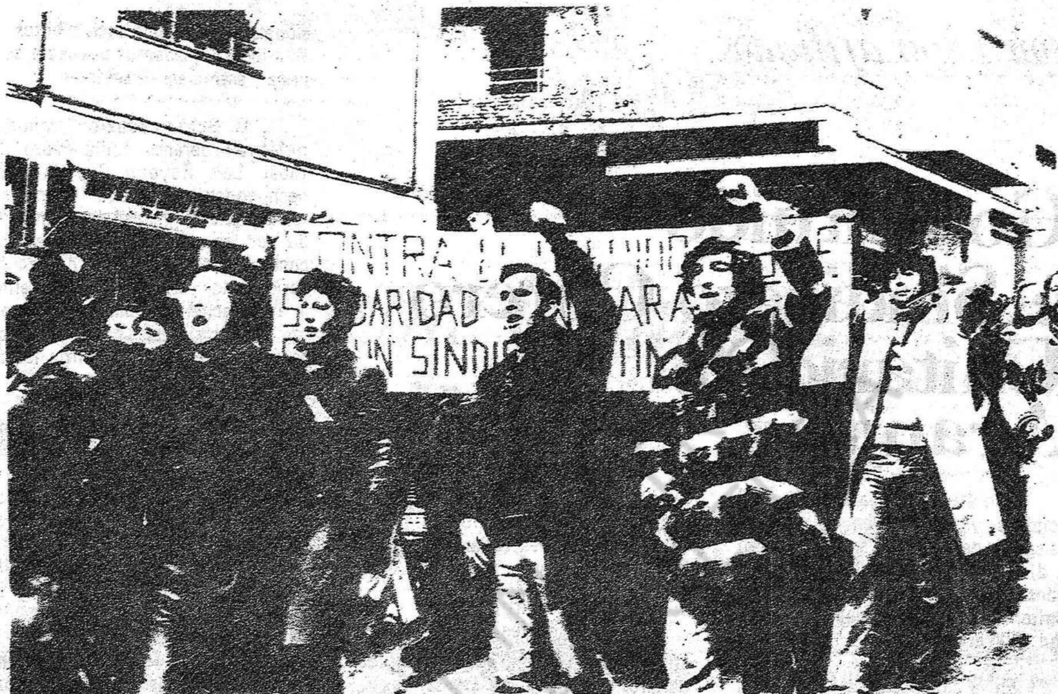
Manifestación en solidaridad con Tarabusi