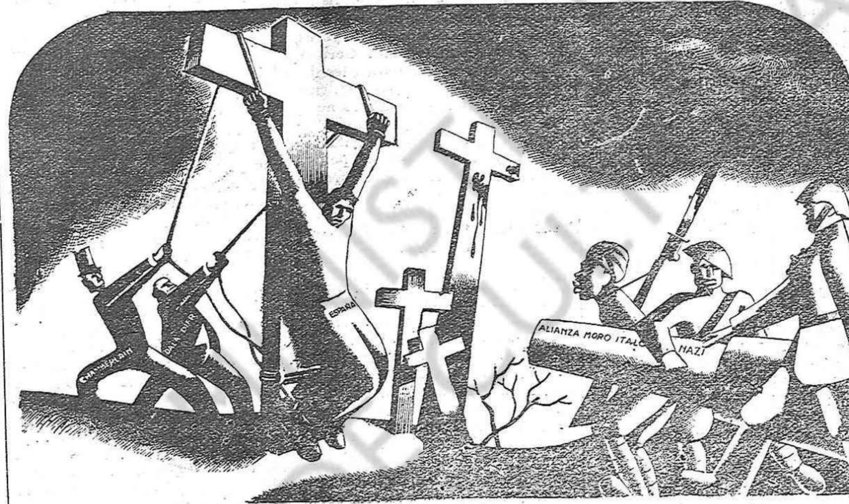
Este es el resultado de la Política de Apaciguamiento de Mister N. Chamberlain