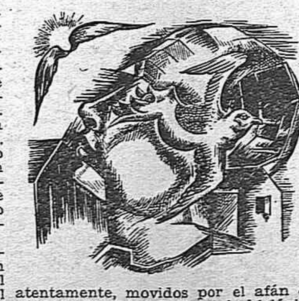
por Juan Puig Elias