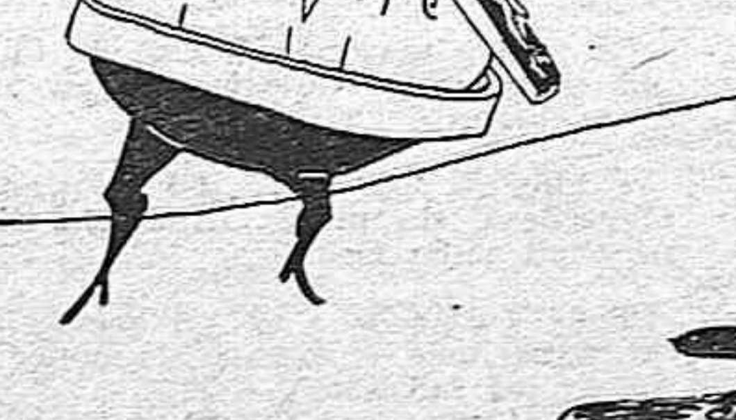
— Estos platillos parece que se alejan...