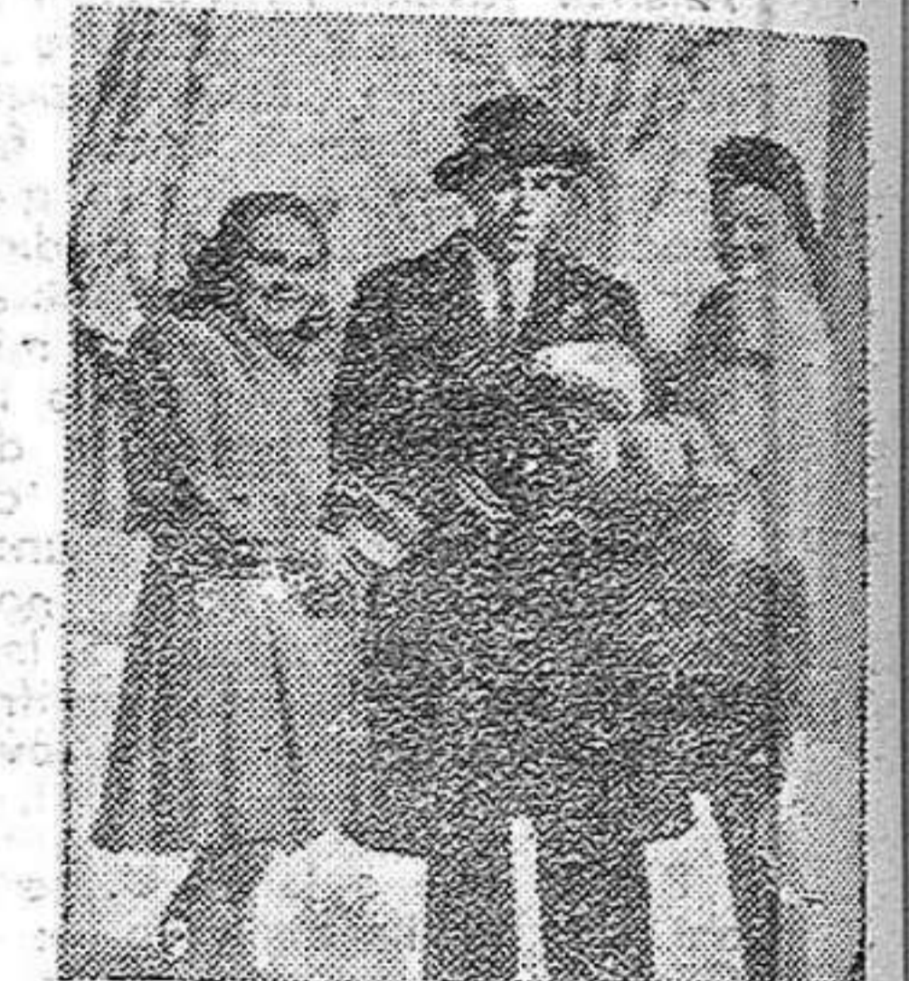
Muchachas de la J.S.U. recolectando para la juventud de España.