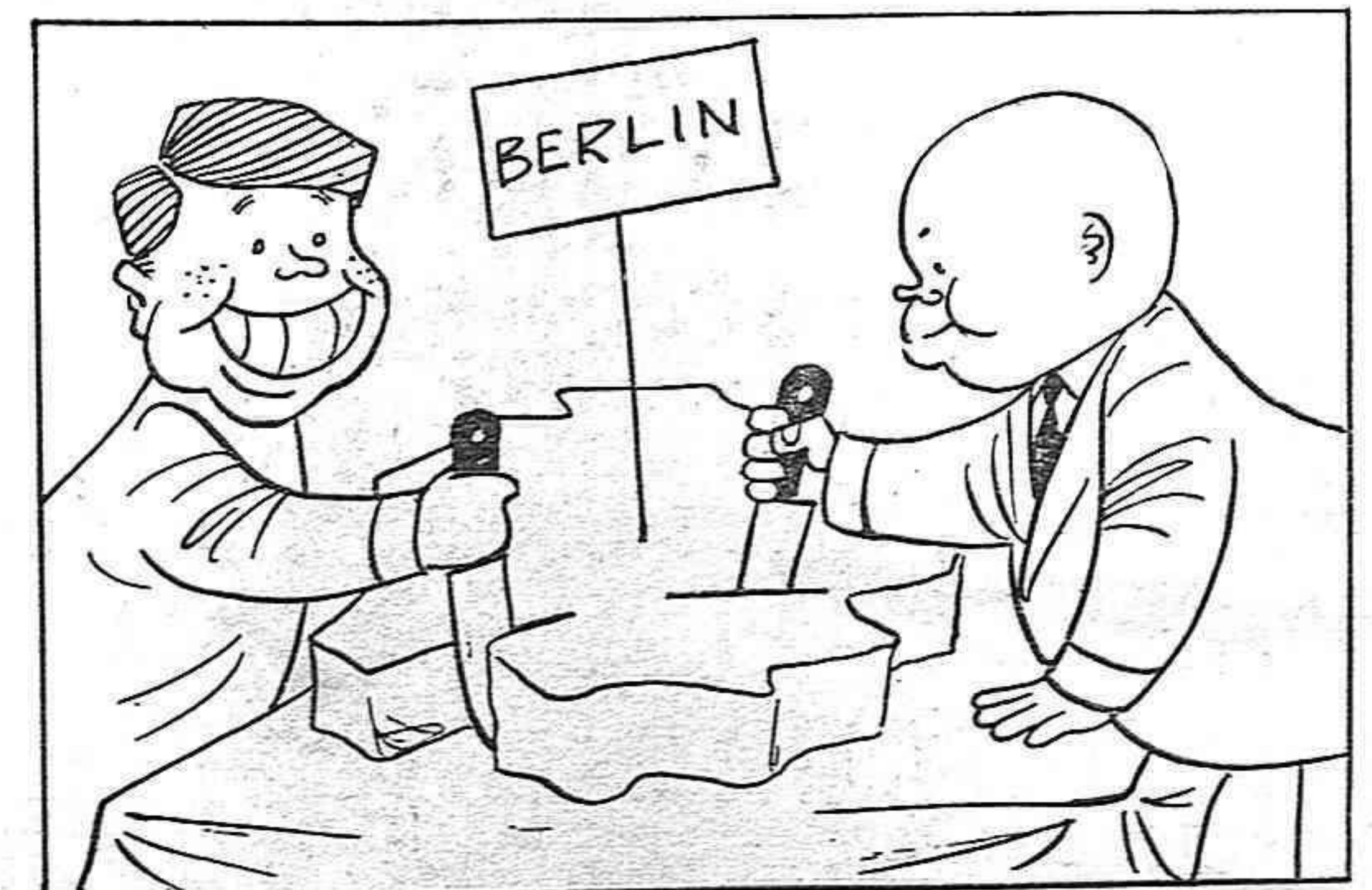
— Quien parte y reparte... —