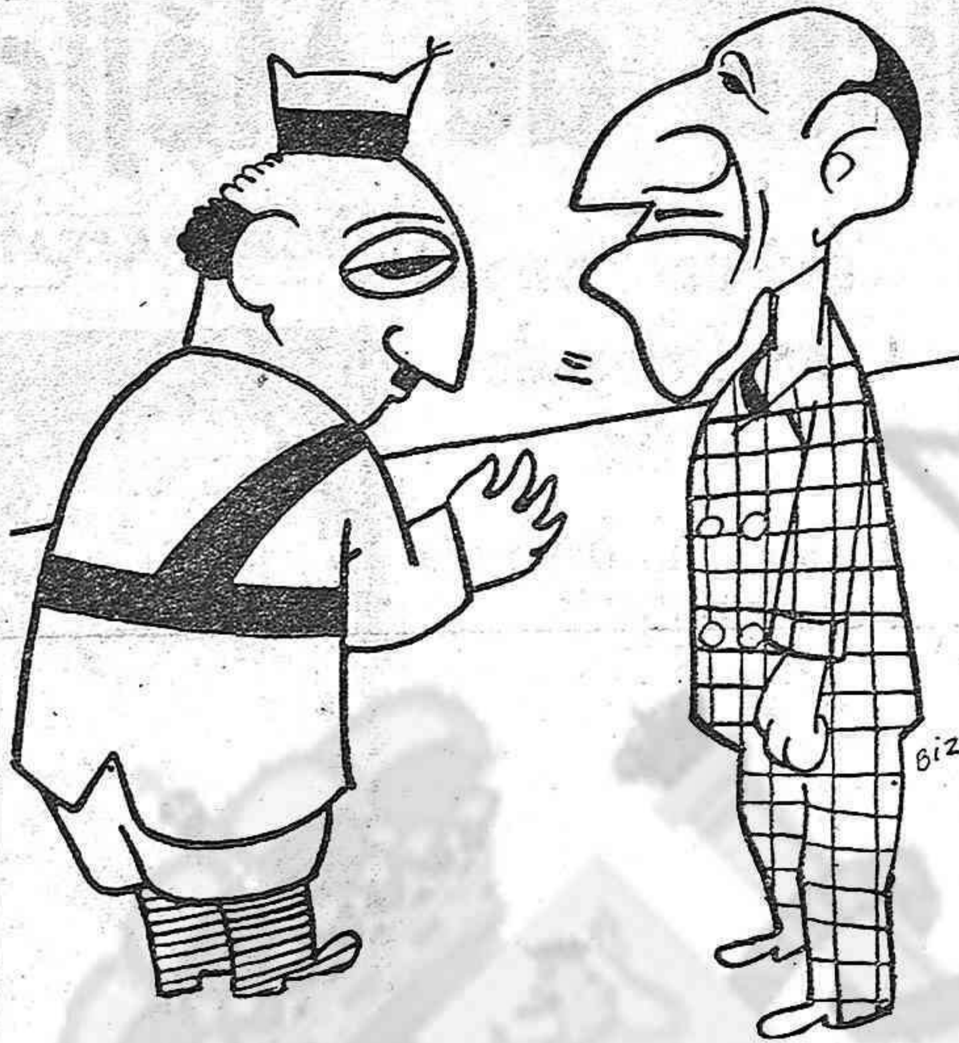
FRANCO. — Los alemanes, los italianos, los ingleses y los portugueses me dan su consentimiento para que vuelvas a ocupar el trono...