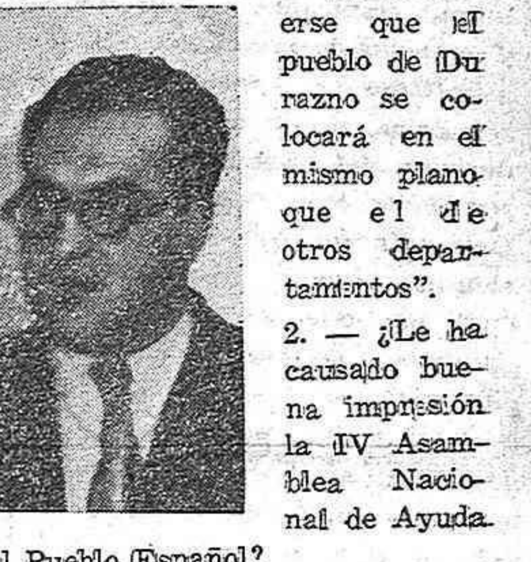
al Pueblo Español? —'Por su composición, que reúne todos los sectores geográficos, gremiales y democráticos de la República...