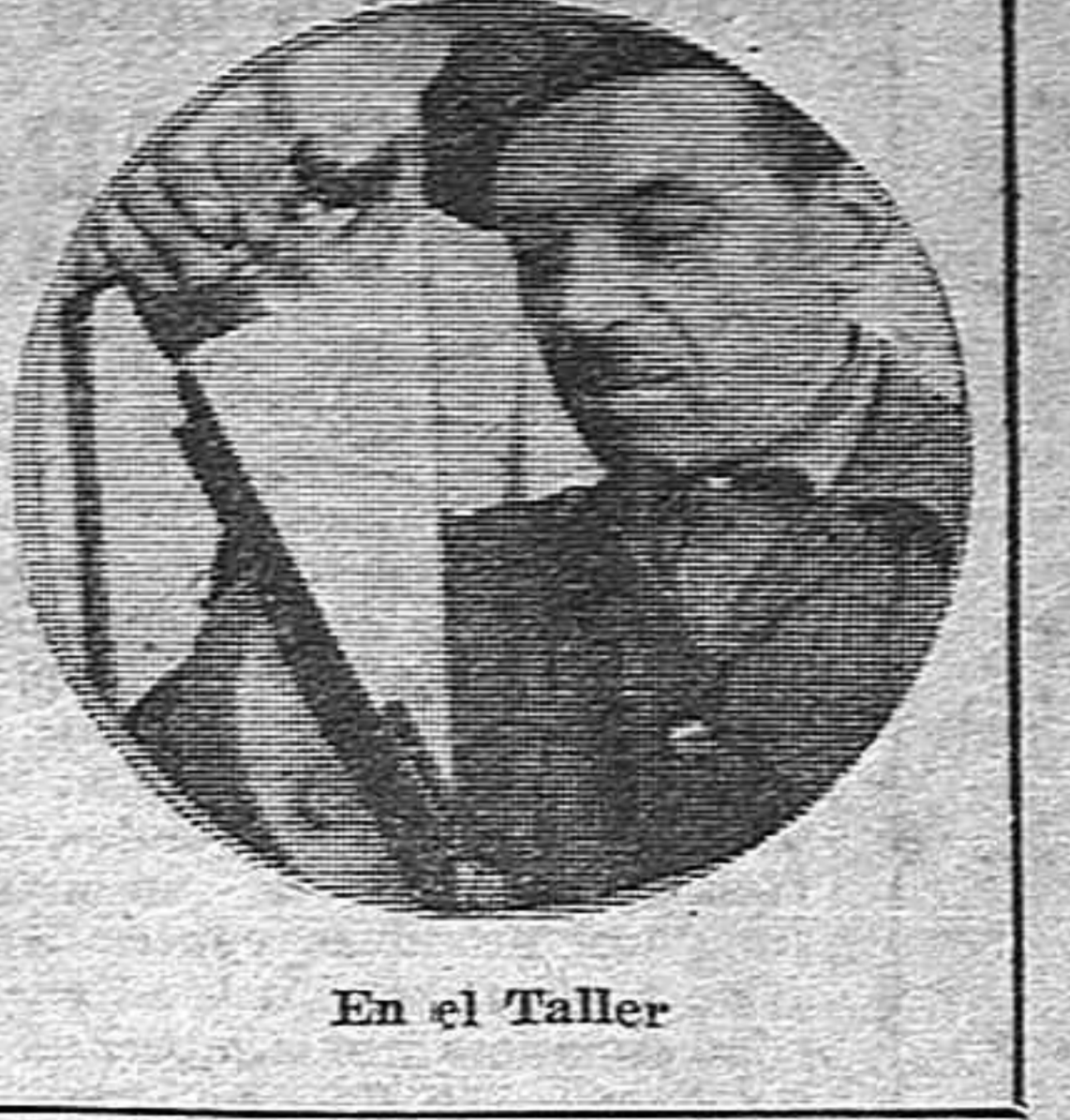
En el Taller

campaña sería la mano milagrosa que comenzara a transformarla, dándole vida e impulso a nuestra economía agropecuaria. No sólo progreso en la incipiente agricultura uruguayana encontraríamos sino abaratamiento de los productos alimenticios que da el campo y alza en el guión de materias primas industriales, originarias de la campaña. Es por esto que al aplaudir a las entidades españolas y al gobierno nos permitimos insinuar que de inmediato se estudie la conveniencia de ampliar hasta el máximo la admisión de refugiados.