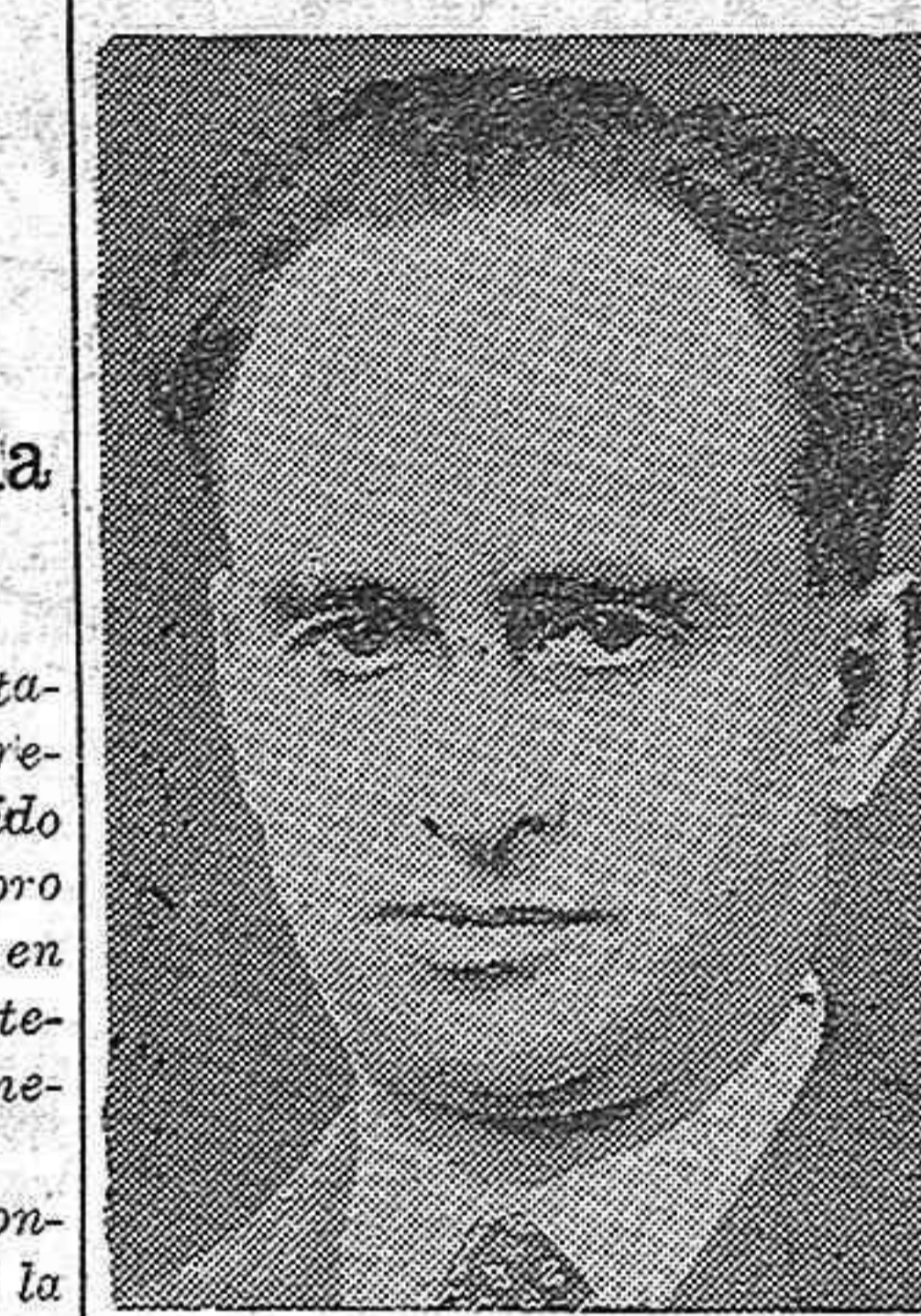
El Presidente de Honor del Comité Nacional que será pronto objeto de un gran homenaje por todo el movimiento ayudista

España debían y deben apoyarla. Si ella fracasase, la suerte de los hermanos refugiados, está echada. Sólo lo peor les espera. Por eso, debemos protestar contra quienes, en vez de sumarse a tal obra, se ponen a sabotearla claramente.