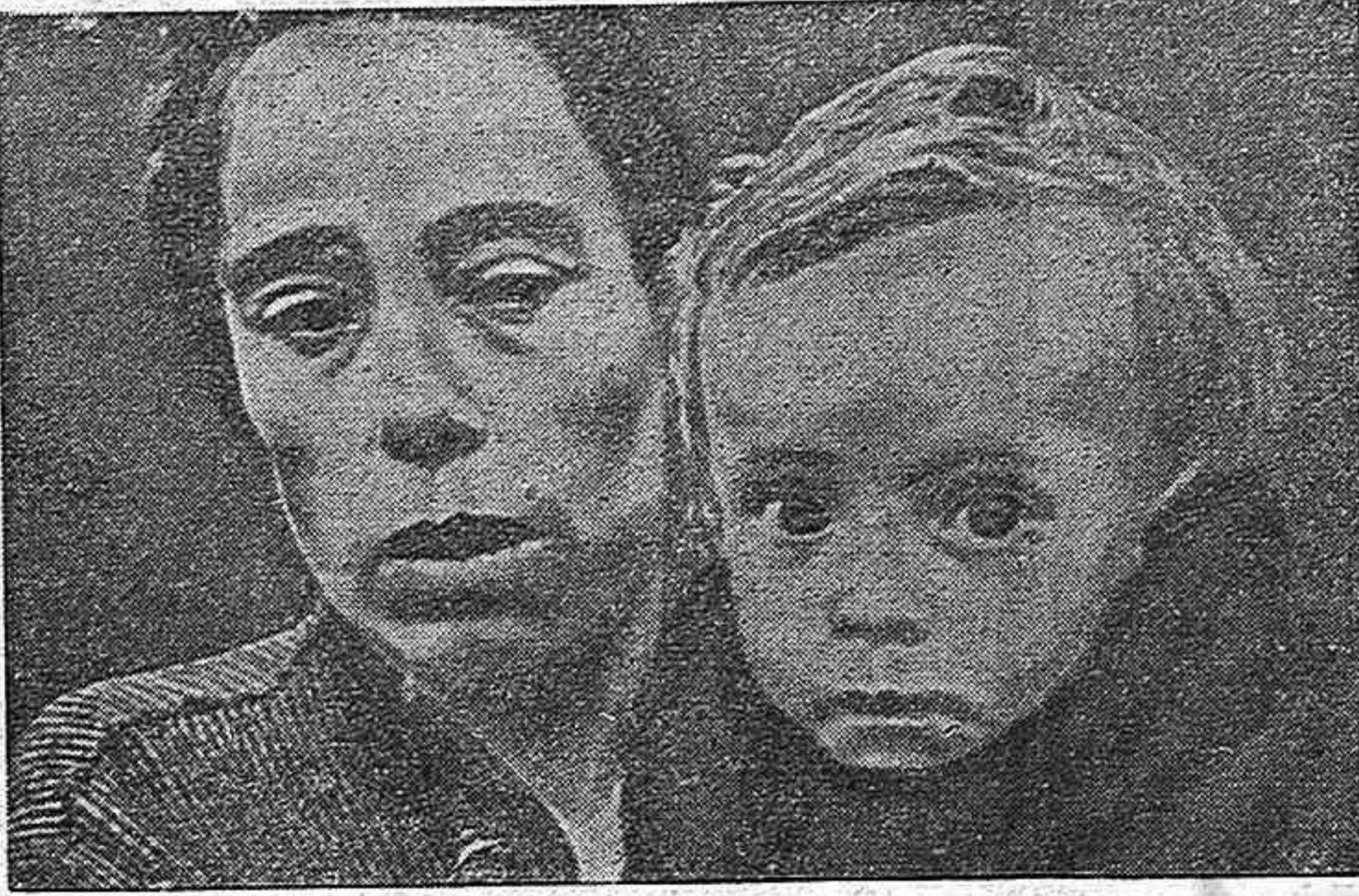
Uno de los niños que están en los campos de refugiados de Francia junto a su madre. Es a estos pequeños que ayuda nuestra C. de Damas