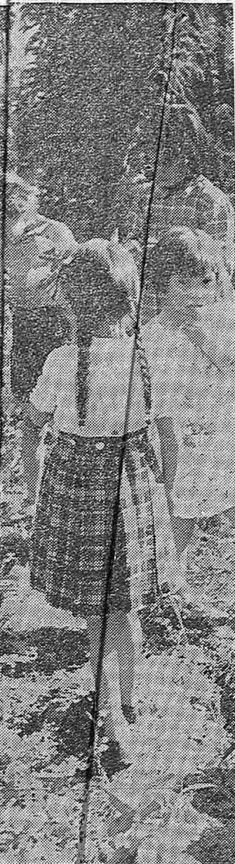
Niños españoles en la Colonia infantil de Chile, sostenida por los organismos de ayuda femeninos de Argentina, Uruguay y ese país