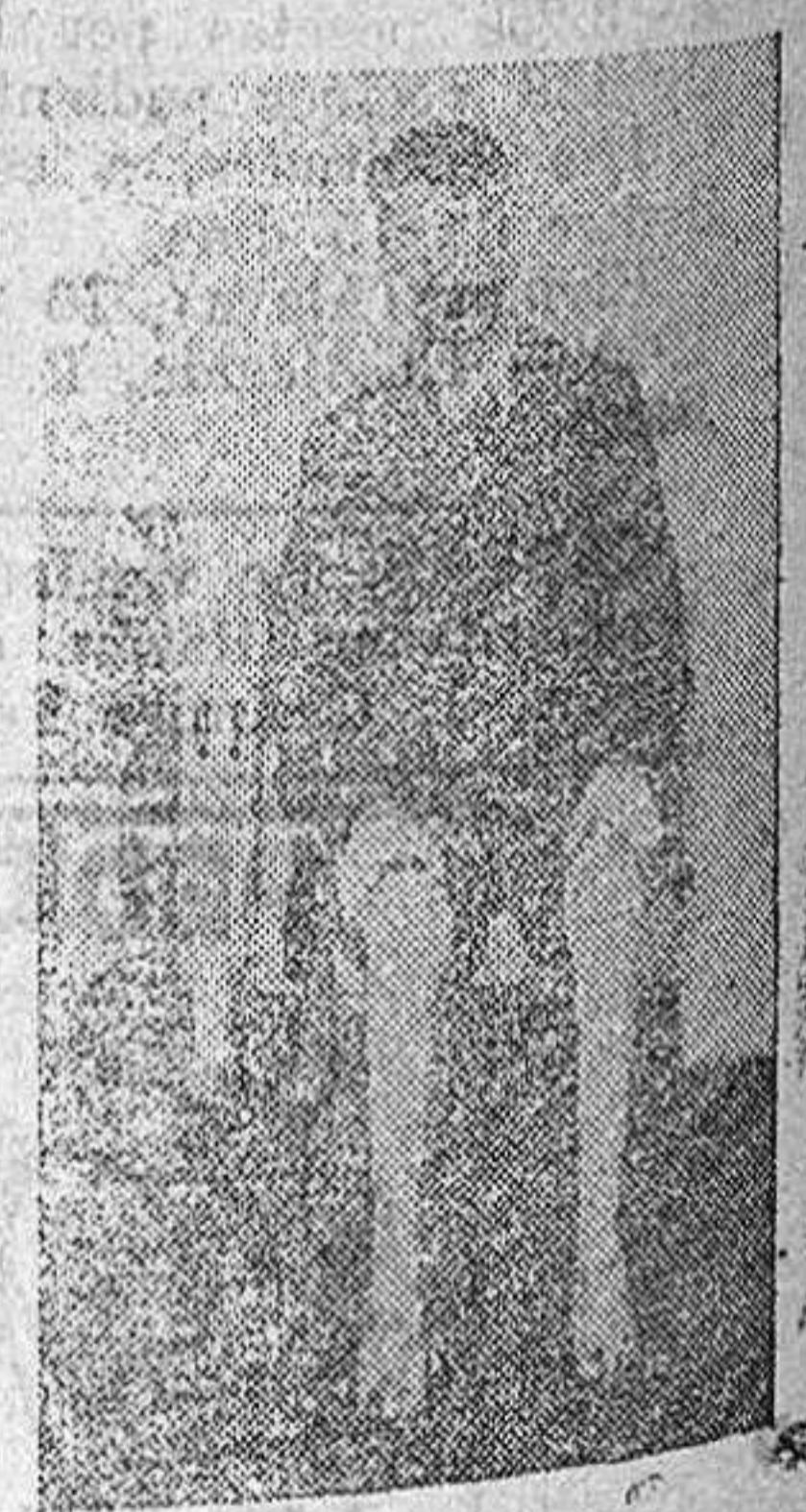
DANIEL BAÑUELOS DE BRIONES (LOGROÑO). A LOS DOS MESES DEL TRATAMIENTO