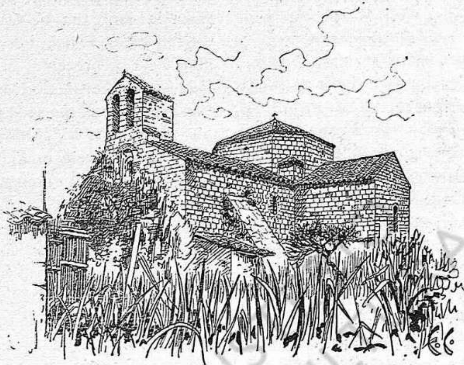
SANT PERE DE CERCADA: L'iglesia (de fotografia del Sr. Castellet)

A l'esquerra de la fatxada, i arran del capi-