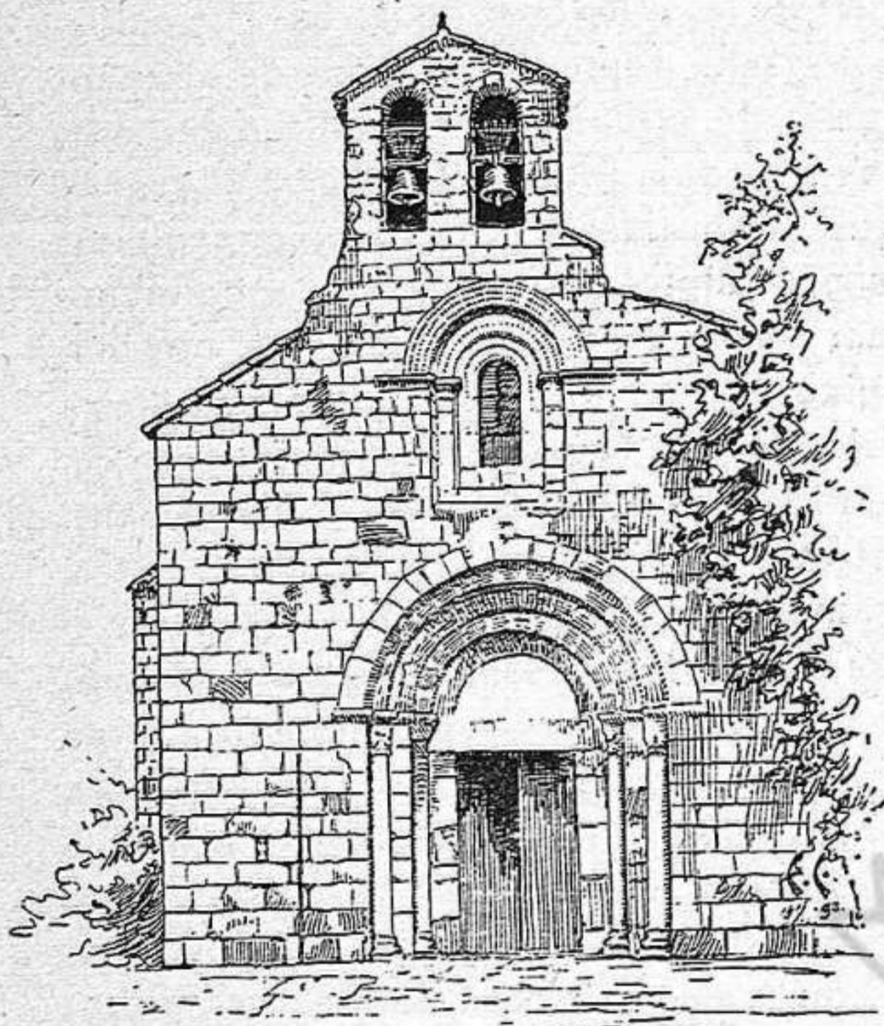
SANT PERE DE CERCADA: Frontis de l'iglesia

Aquesta, aixecada en el centre del recinte, és rodona i de regular elevació, Carretades de