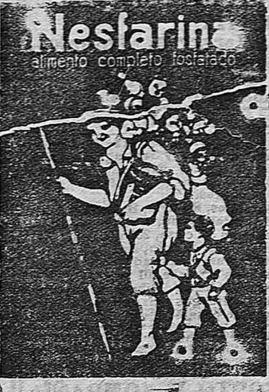
Nestarin alimento completo fosforado EL MEJOR ALIMENTO FOSFORADO PARA NIÑOS PIDASE EN TODAS PARTES