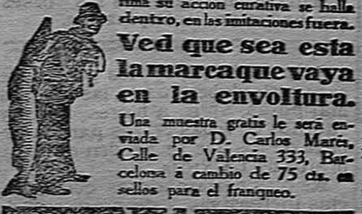
Esta que se diferencia de la Emulsión SCOTT legítima de todos sus imitadores...

Desgracia. En el paseo de Recoletos, el automóvil arrolló á una mujer que intentó cruzar el paso, recibiendo un tremendo topetazo que la arrojó á tierra.