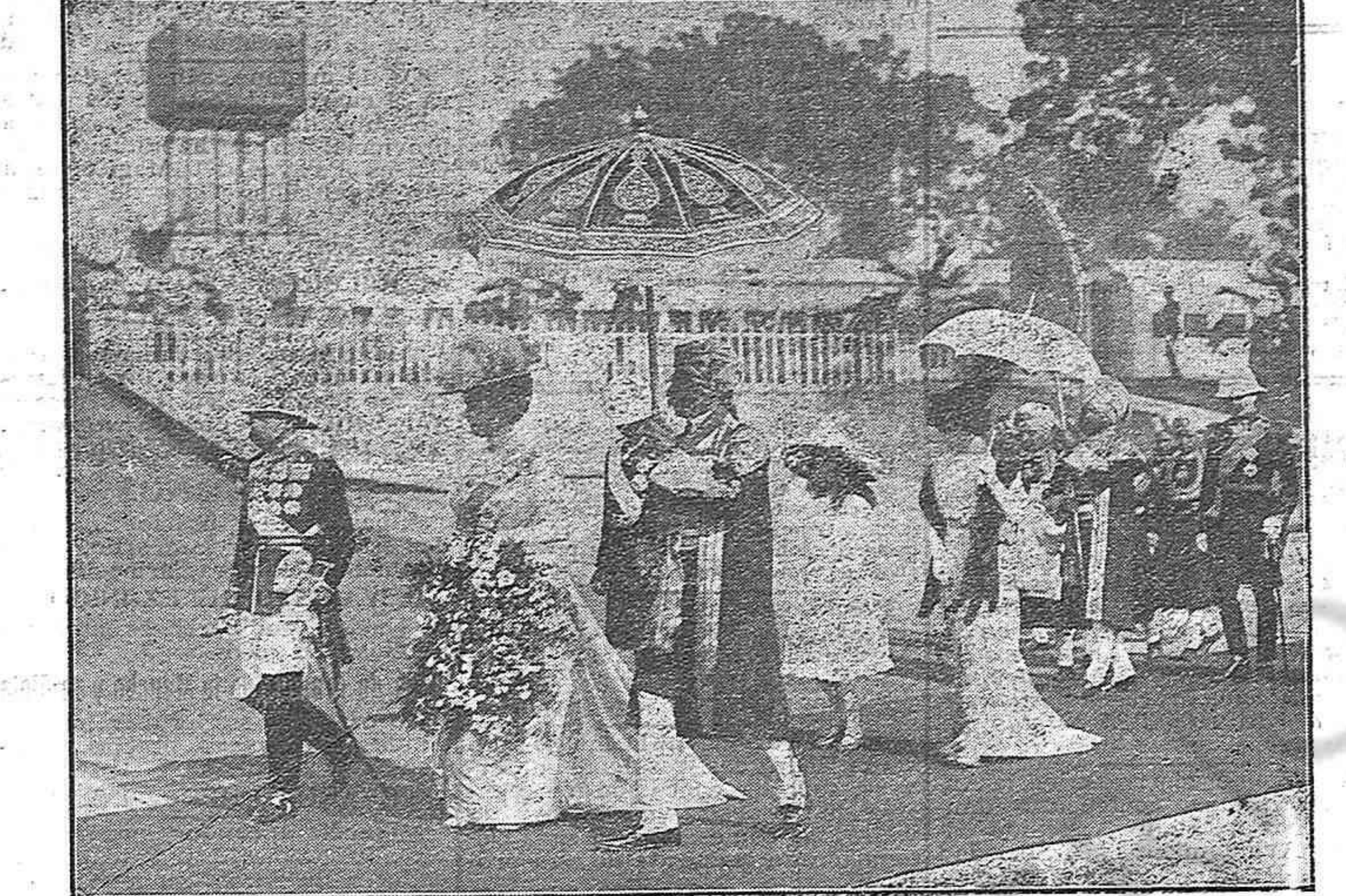
EL REY DE INGLATERRA EN LA INDIA Pts. B. gñá y Corn t. Los viajeros dirigiéndose de la estación á sus carruajes.