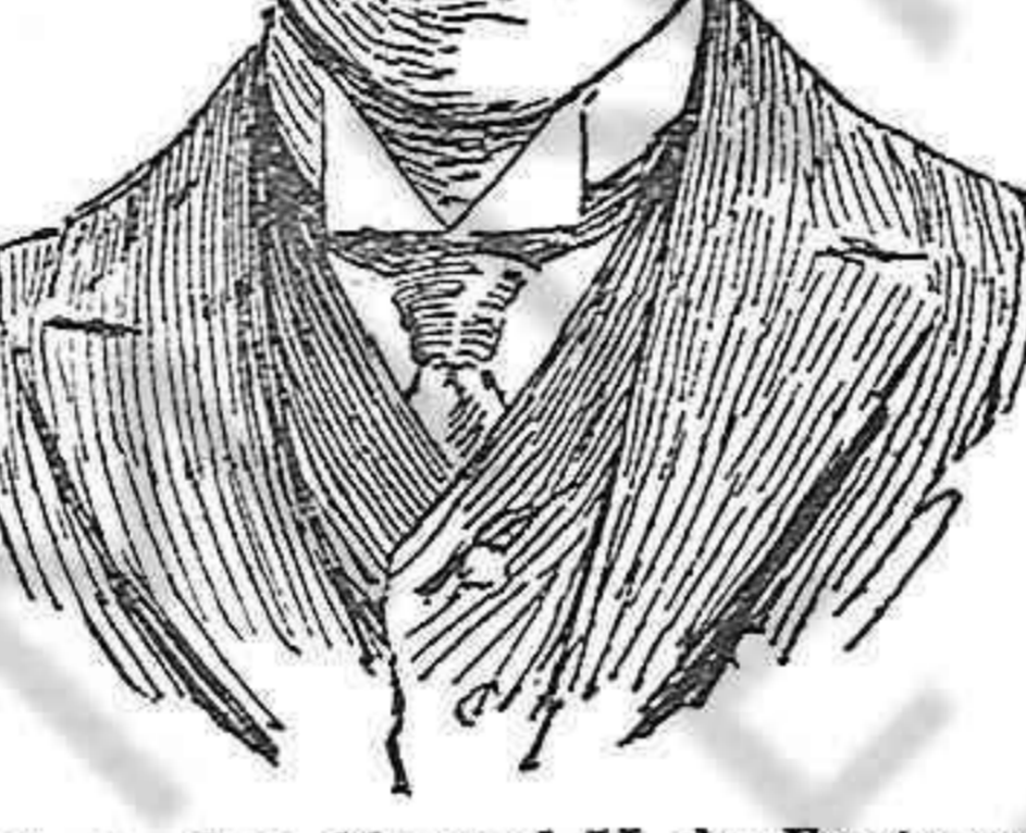
El rey don Manuel II, de Portugal