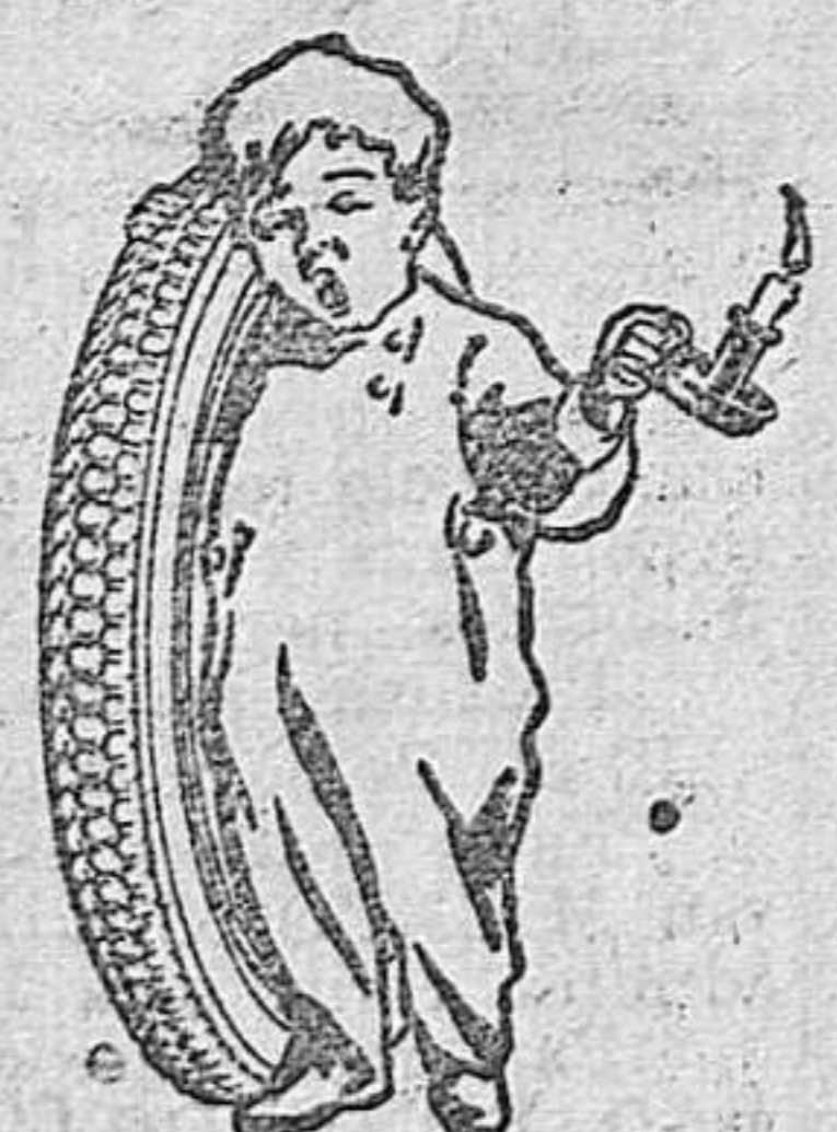
Agente exclusivo para Logroño y su provincia

Estas tres cosas obtendrá comprando los neumáticos o bandajes a CELSO RUBIO SAN BLAS, 22 LOGROÑO