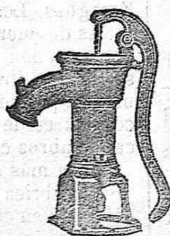
BOMBA PARA RIEGOS

Construye con solidez, economía y adelanto.