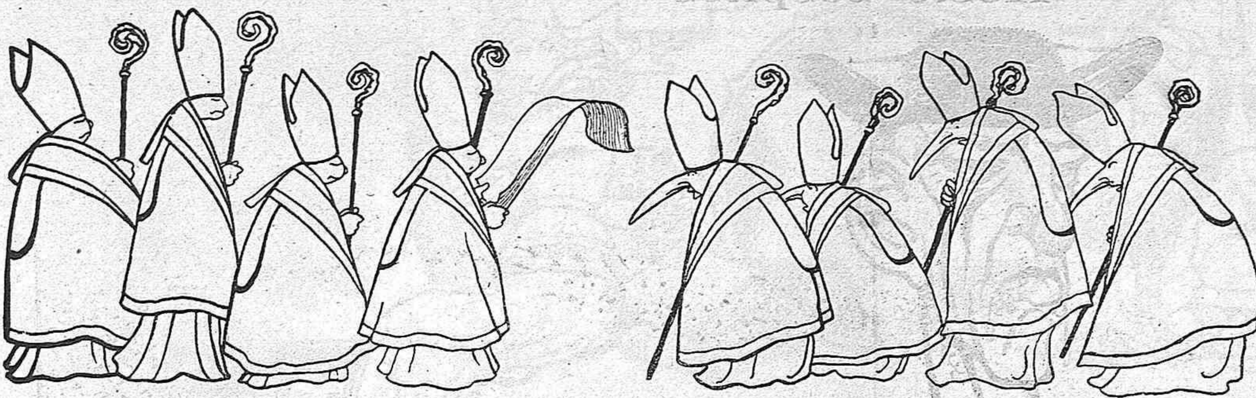
AL ARRIBAR.—Ab moltes agalles.