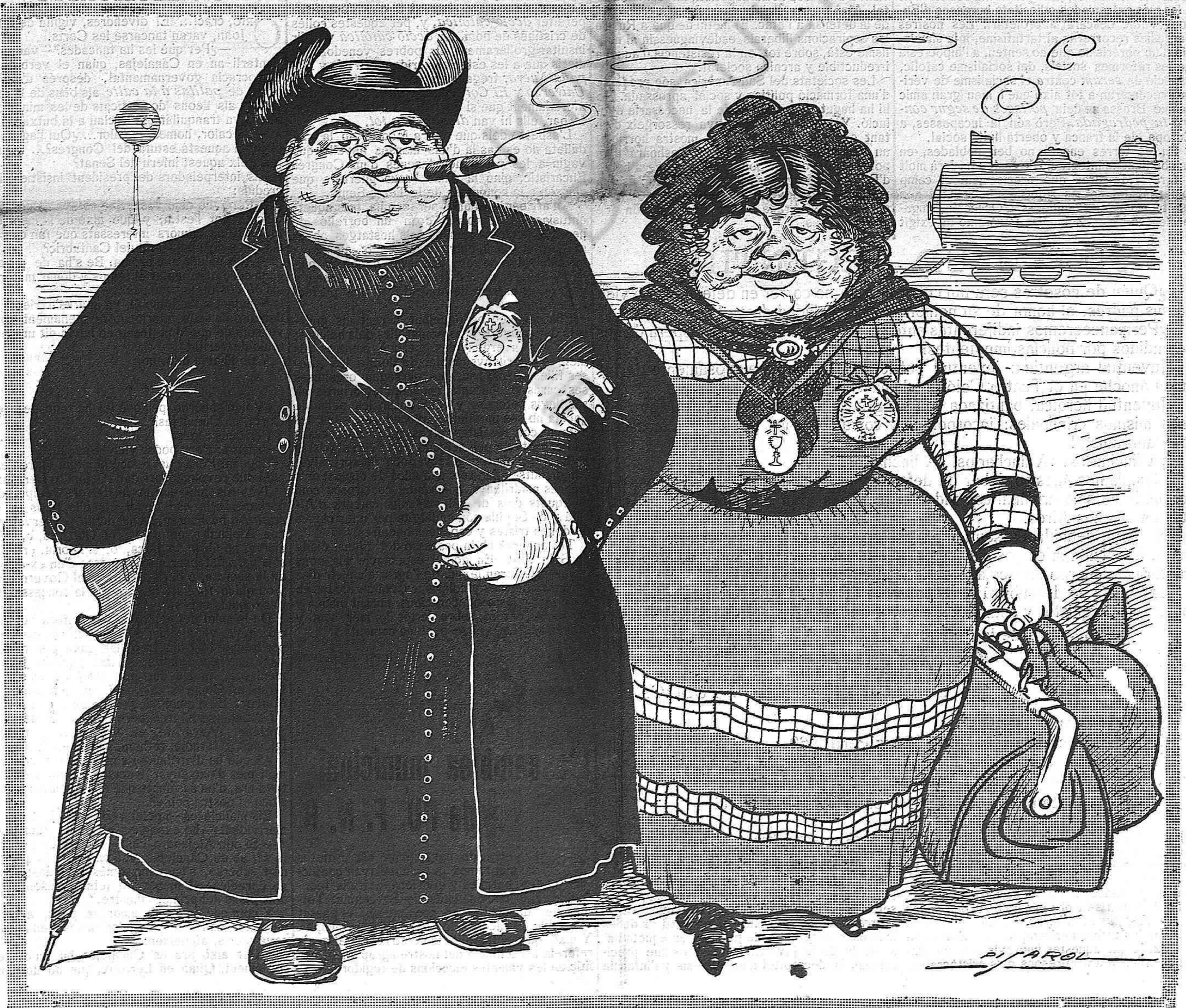
TORNANT DEL CONGRÉS EUCARISTIC

PREUS DE SUSCRIPCIÓ: Fóra de Barcelona cada trimestre: ESPANYA, pessetas 1'50.-EXTRANGER, 2'50