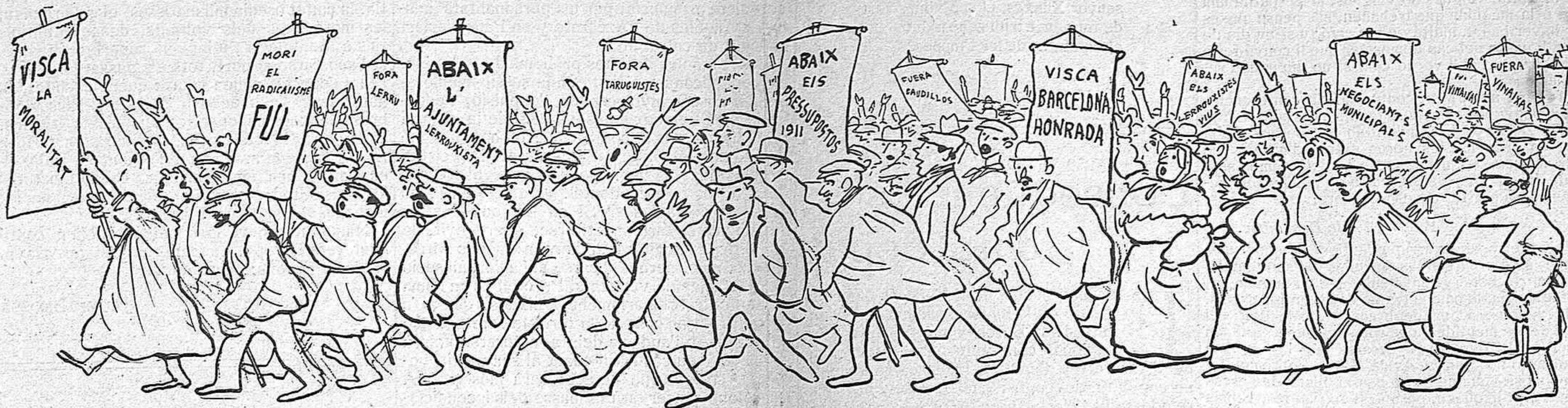
Ab un'altra victòria com aquesta, lo qu'es l'Ajuntament ja pot plegar.