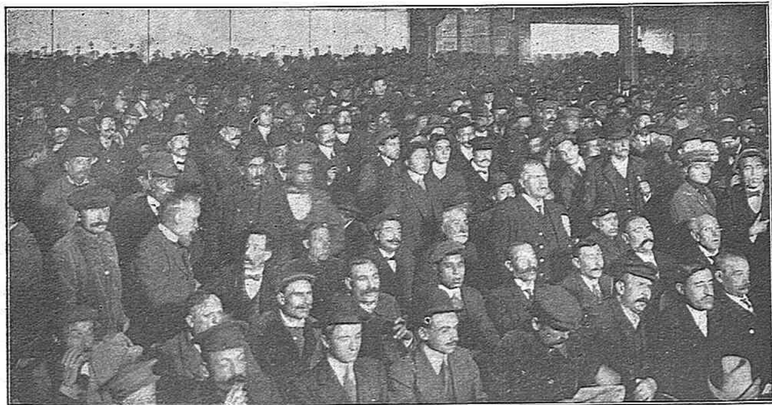
Grandiós meeting celebrat el dimars pels Gremis de Barcelona contra l'escandalós augment introduït en les tarifes de Consums pels concejals lerrouixistes.

«—Recordeu que a Lisboa, durant els últims aconteixements, en un convent de jesuïtes s'hi varen descobrir bombes... ¿Voleu una prova més clara de la nostra moralitat dintre del Municipi?»