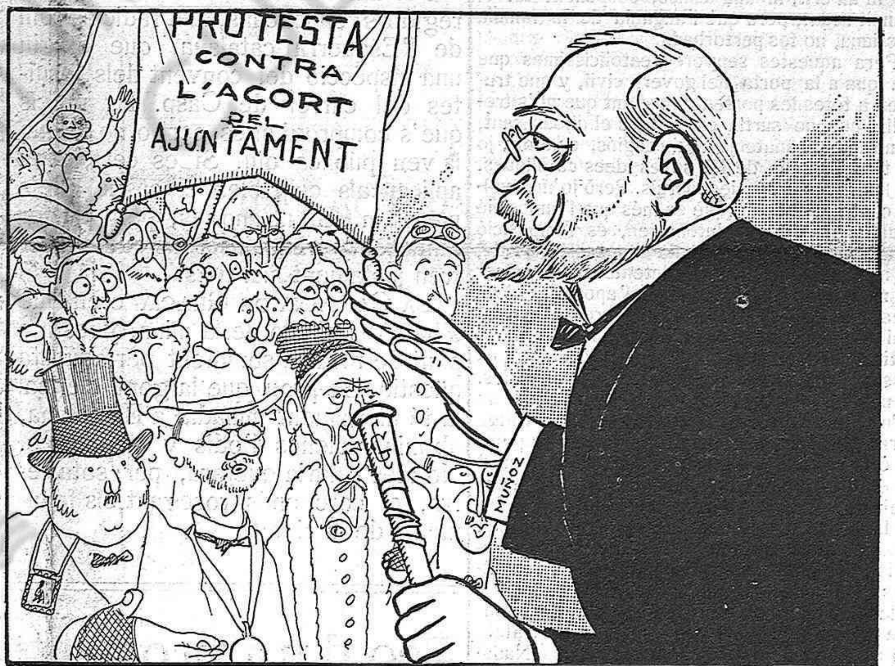
—¿Que què'ls dic com a Governador?... Que la seva protesta'm sembla perfectament ociosa. ¿Vostès no volen rodar? No roden... y en pau.