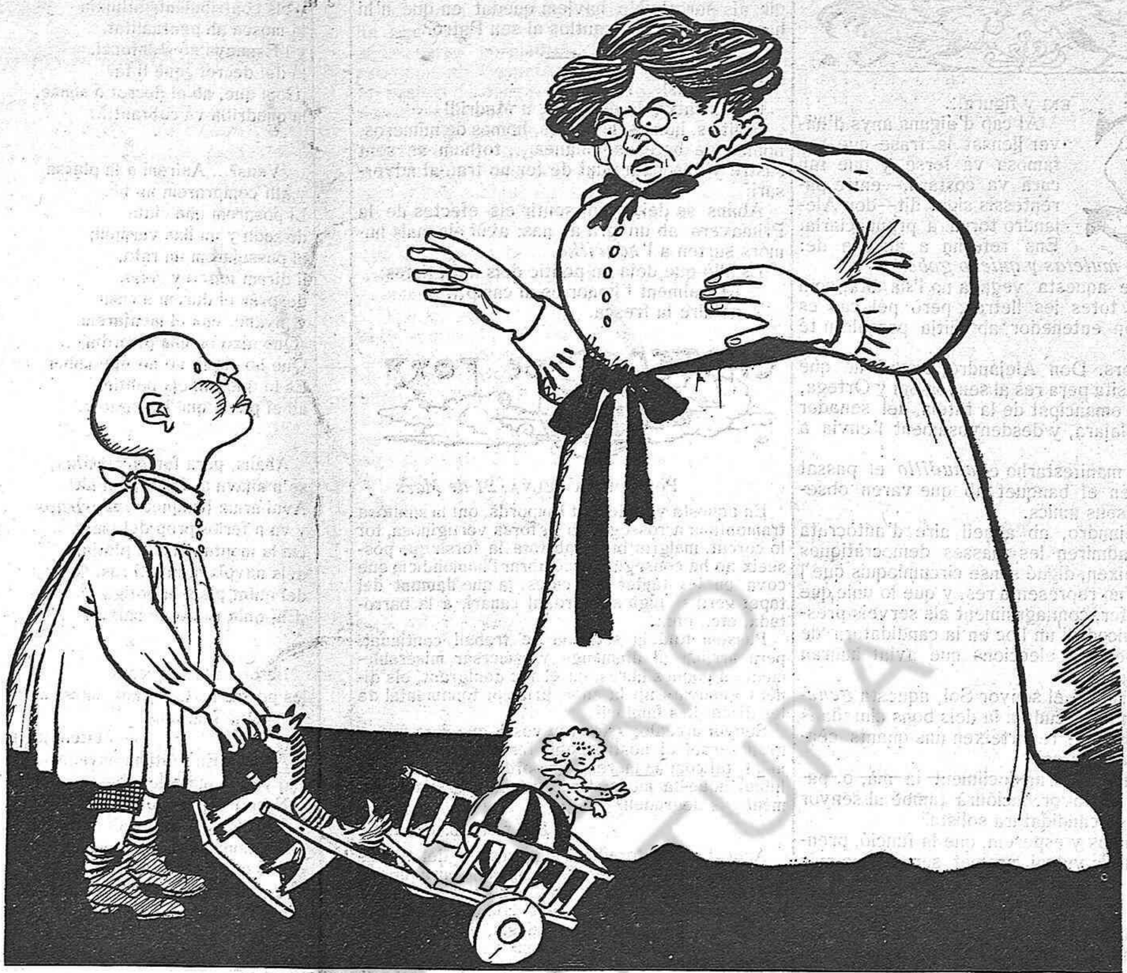
—¡Y ara, Caimitu!... ¿En divendres sant jugar ab el carro? —¿Però que no sab que aquest any el trànzit rodat està permès?...