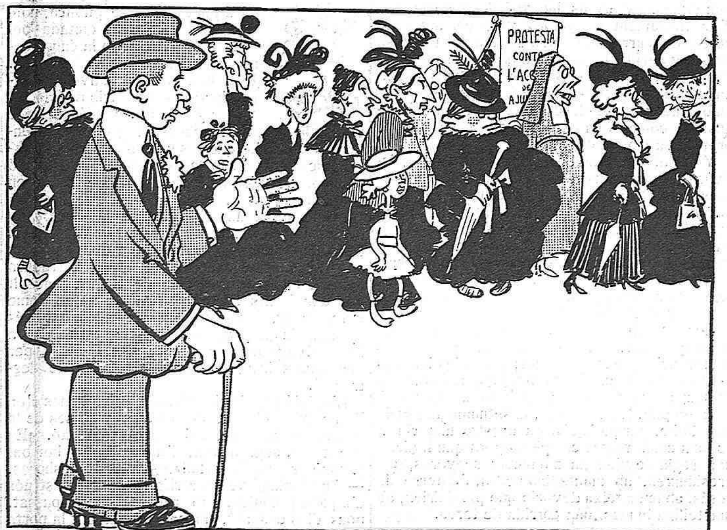
—Aquestes senyores son enemigues del tranzit-rodar, perquè saben que elles no poden anar ni ab rodes.