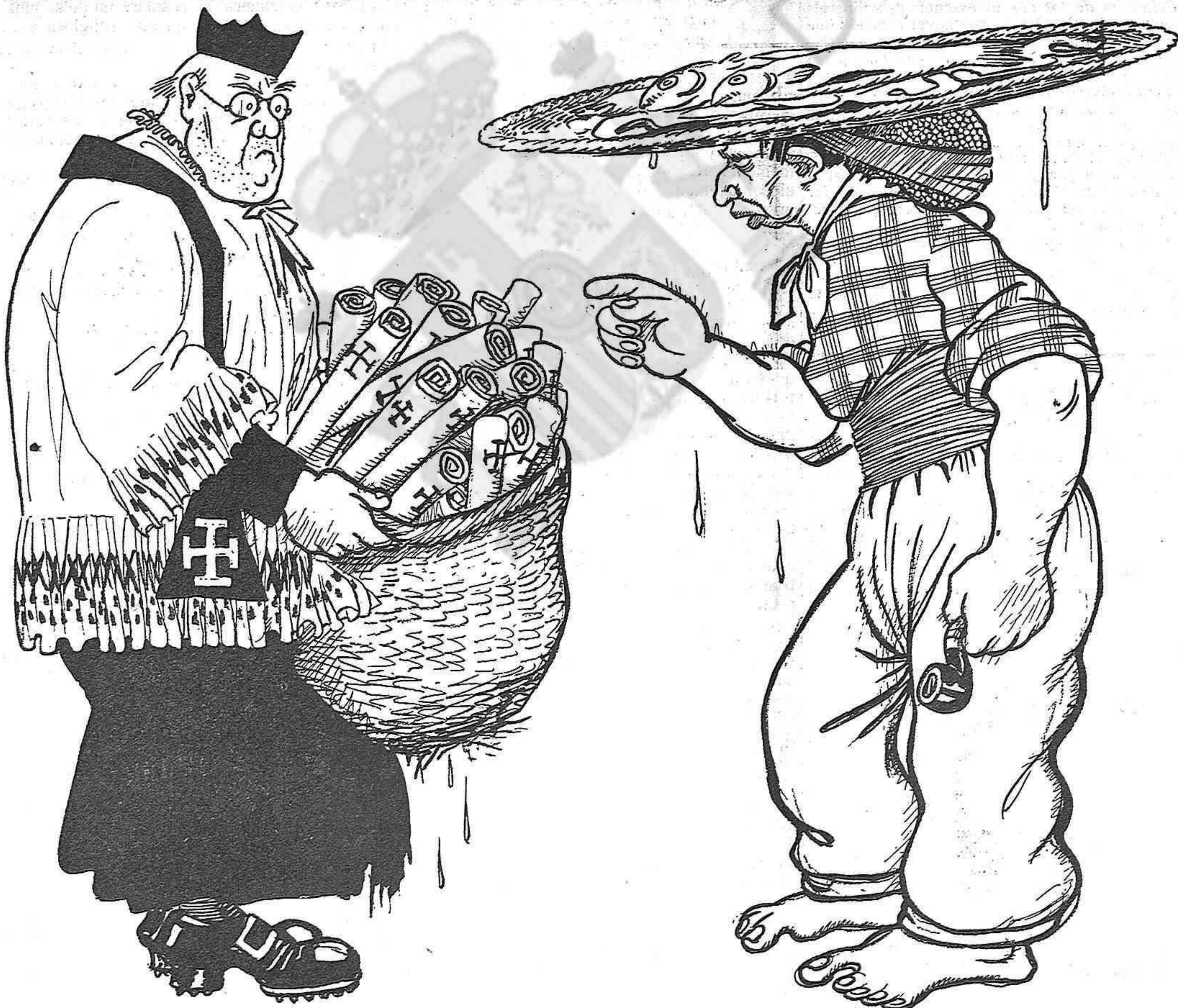
—¡S'ha acabat el vendre butlles!...