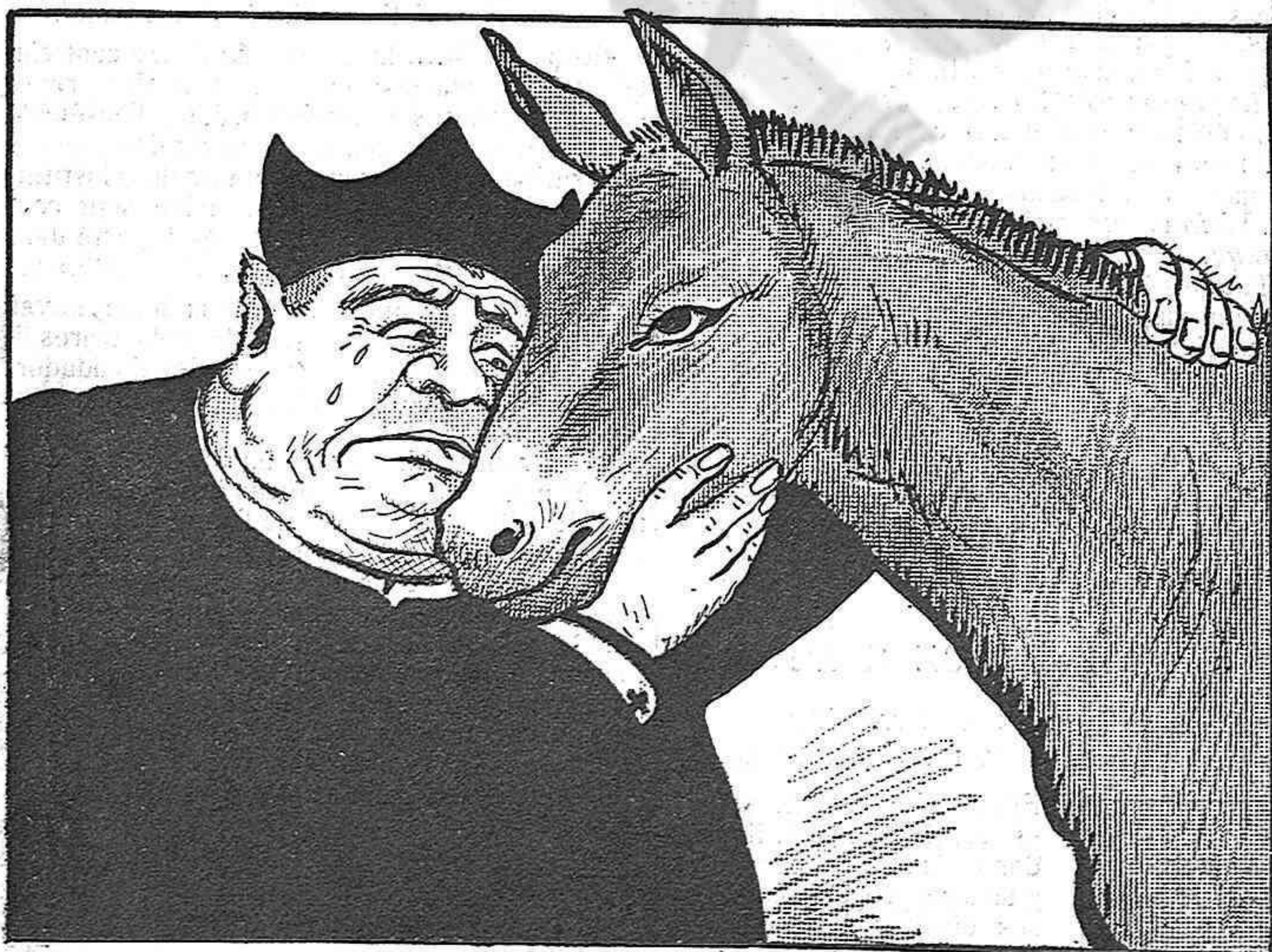
—¡Pobret! No't volen deixar reposar, els heretges!