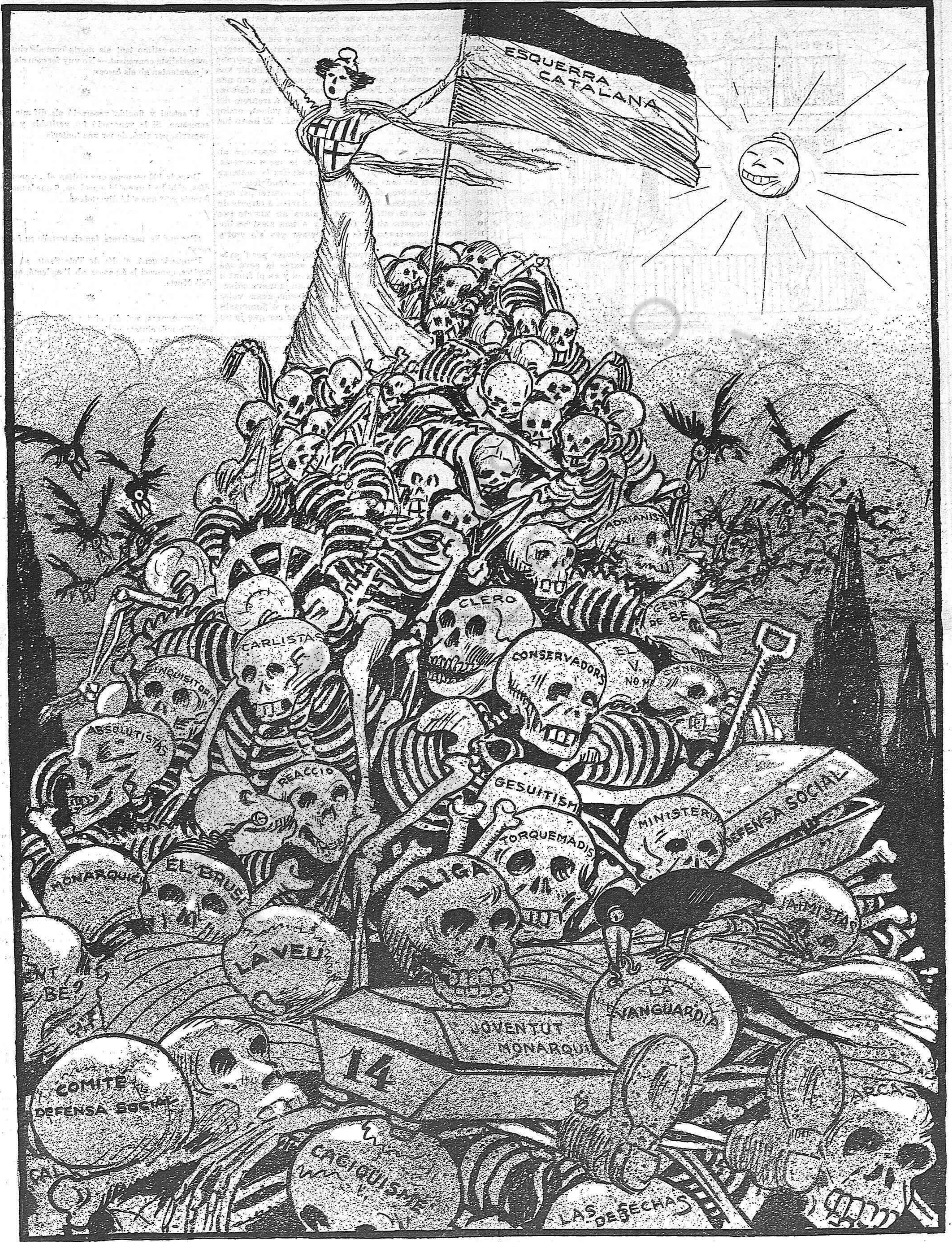
--¡Ja hem pres el Gurugú electoral!...