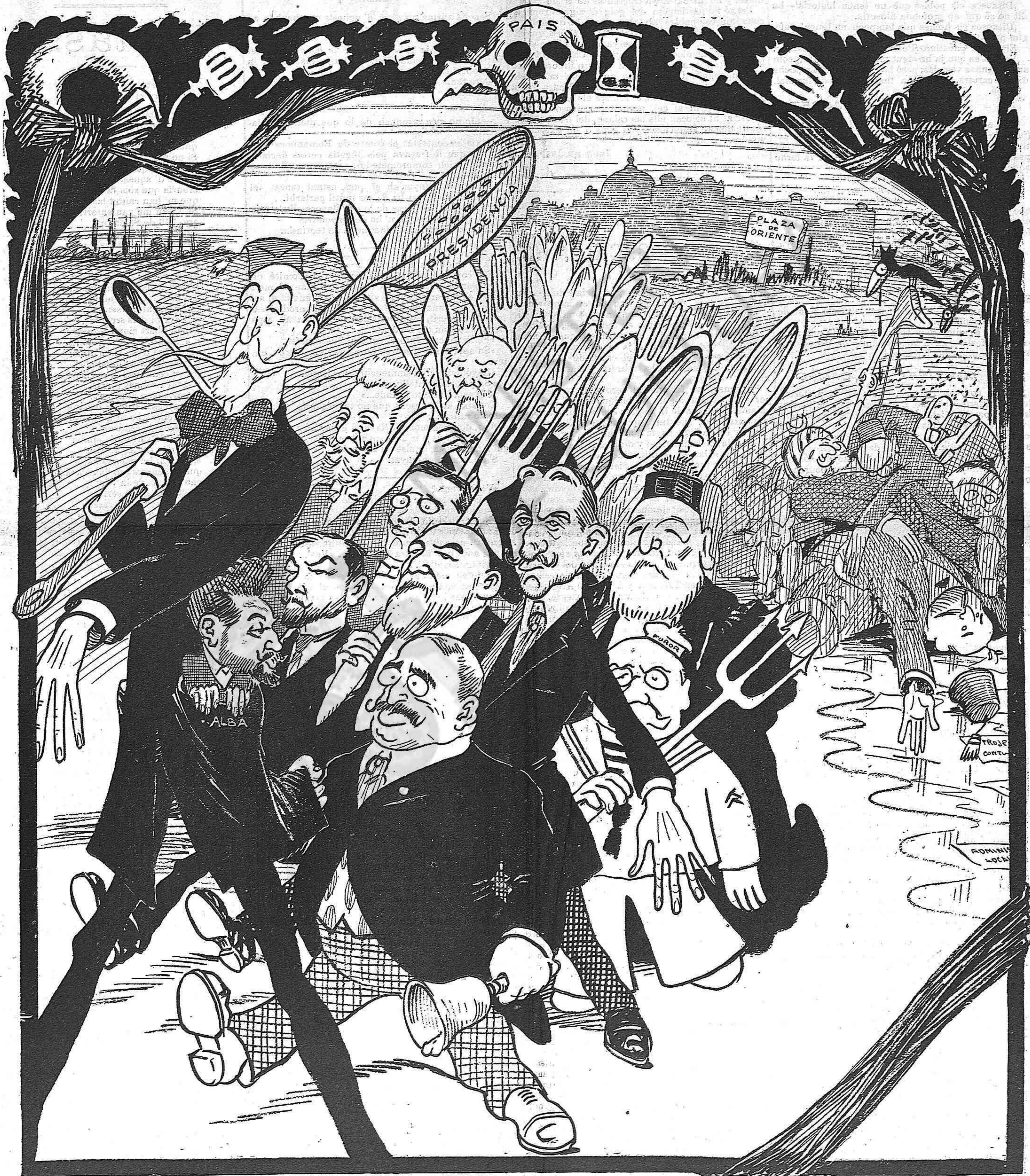
¡Moret se 'n va á la guerra, birondon birondon birondena!...