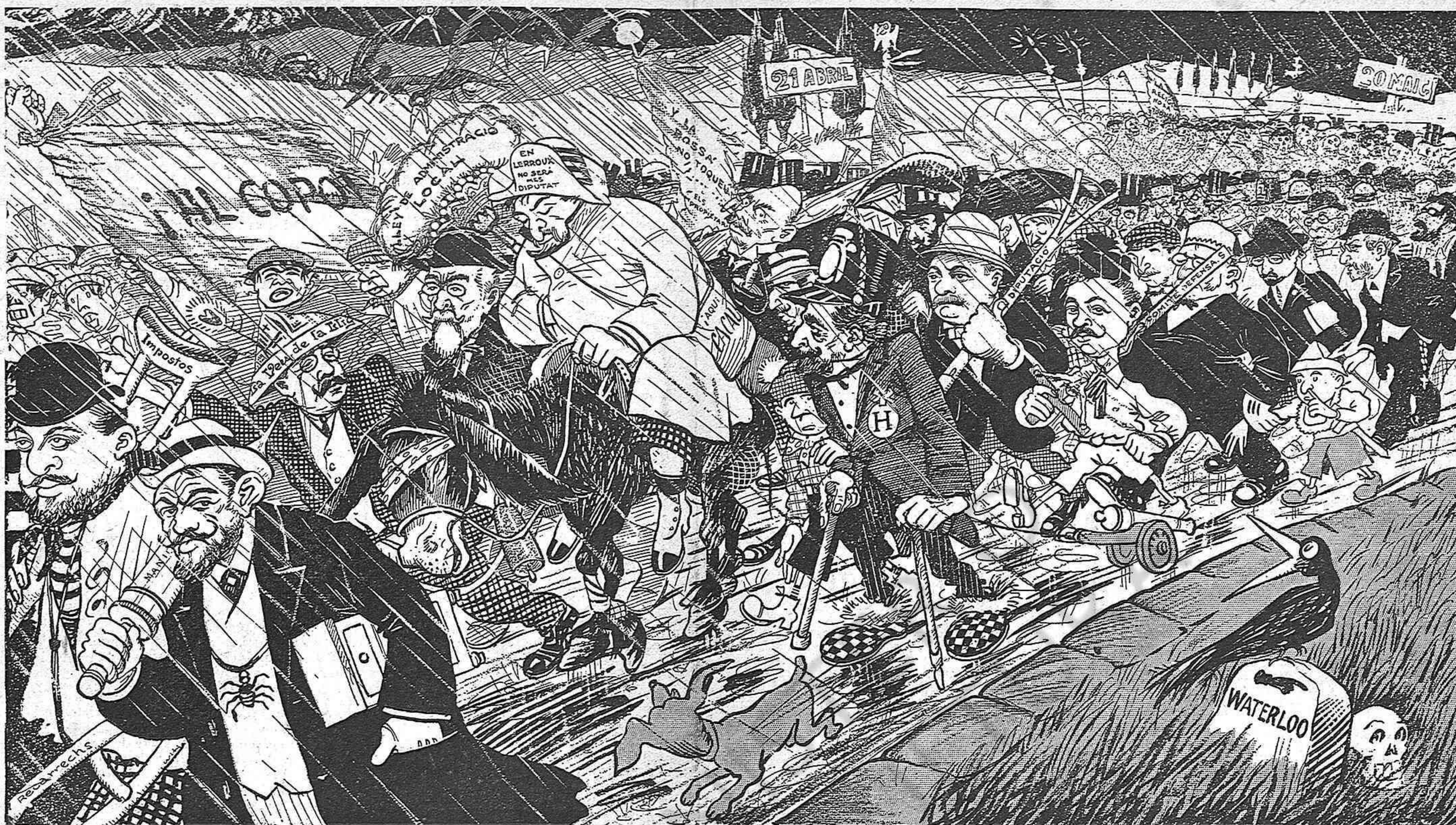
Caminant cap á la derrota.

(En vista del éxit y accedint als desitjos de moltes personas que no pogueren obtenir l' últim número del nostre periódich, reproduhim aquesta lámina, una de las qu' en ell figuravan y que tan poderosament cridá l' atenció del públich y de la premsa.)