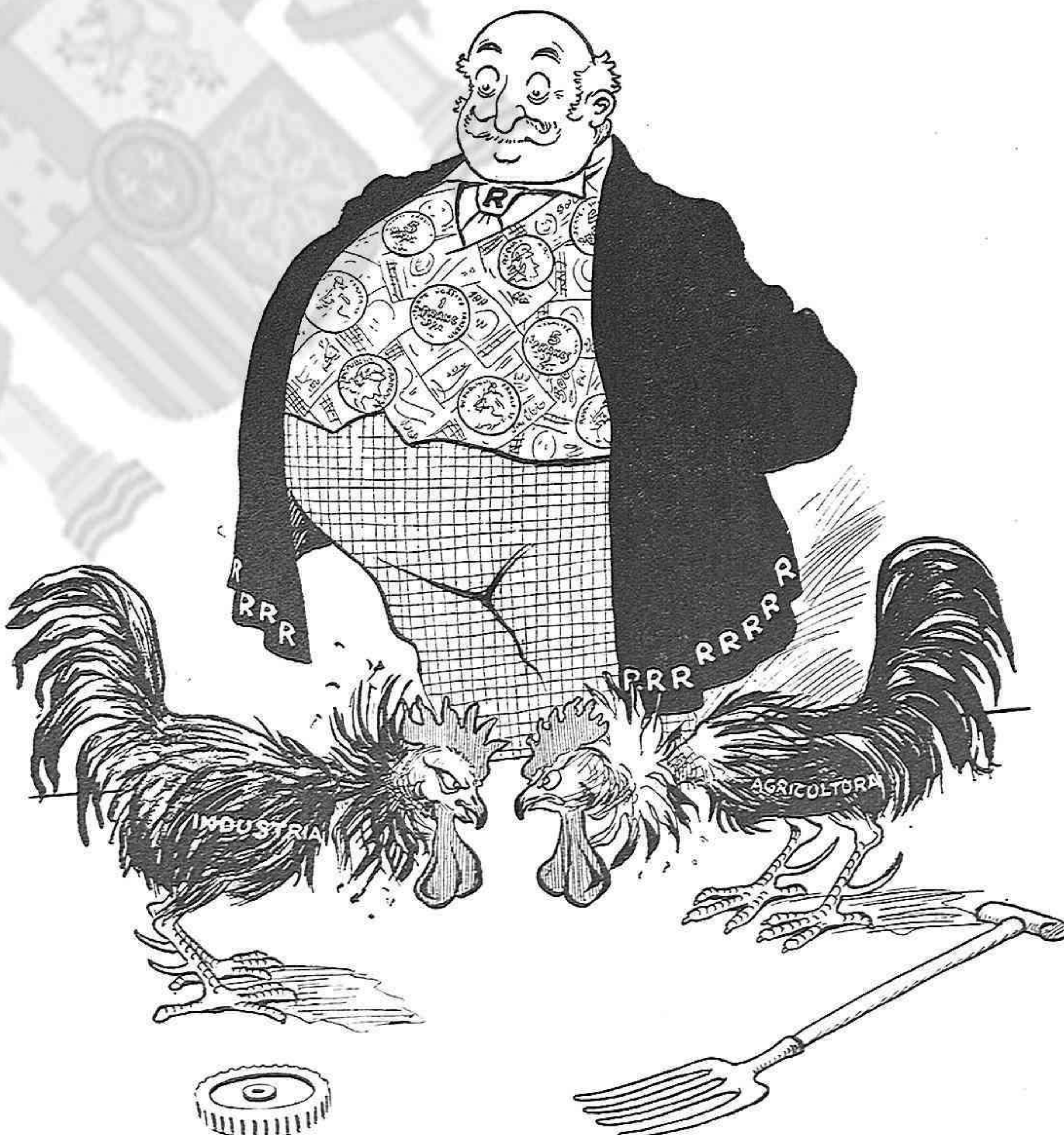
¡Anda, piquevos las crestas! Las cosas se fan així... (Y mentres ells se barallan, jo vaig fent... el meu camí.)