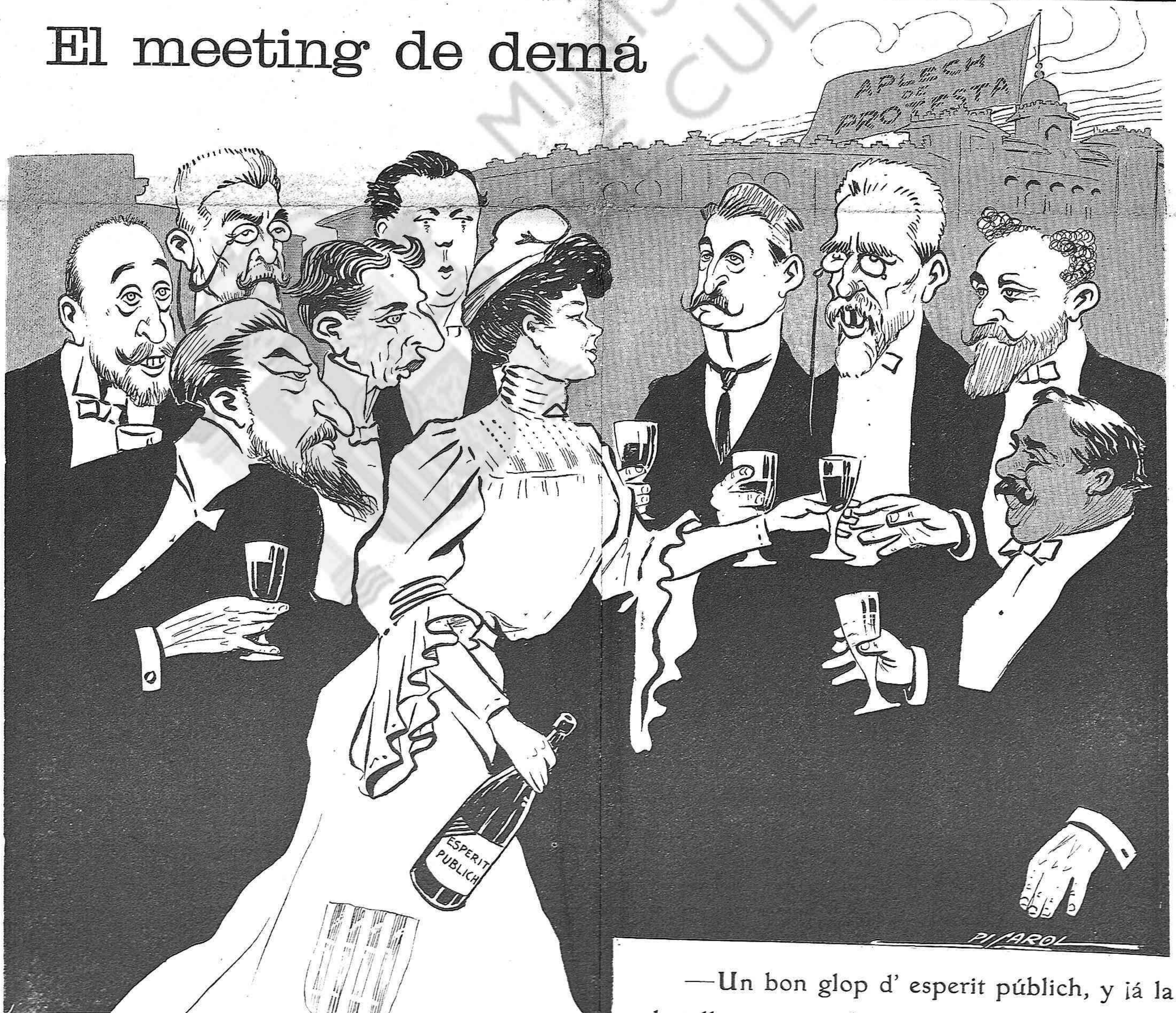
—Un bon glop d'esperit públich, y iá la batalla novament!