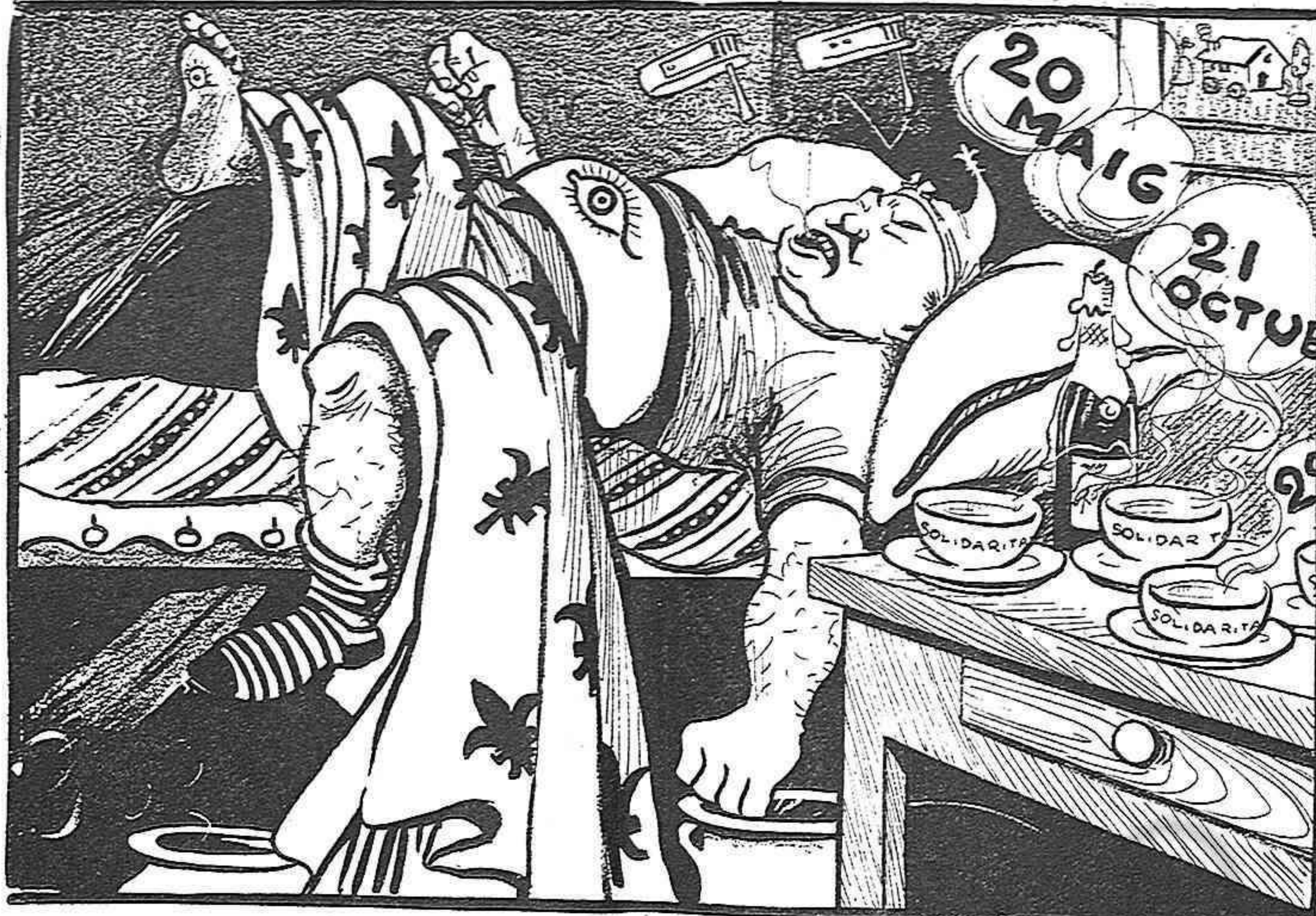
¡Solidaritat!... ¡Solidaritat!... ¡Solidaritat!... Veus'aquí lo qu' ELL cada nit somia.