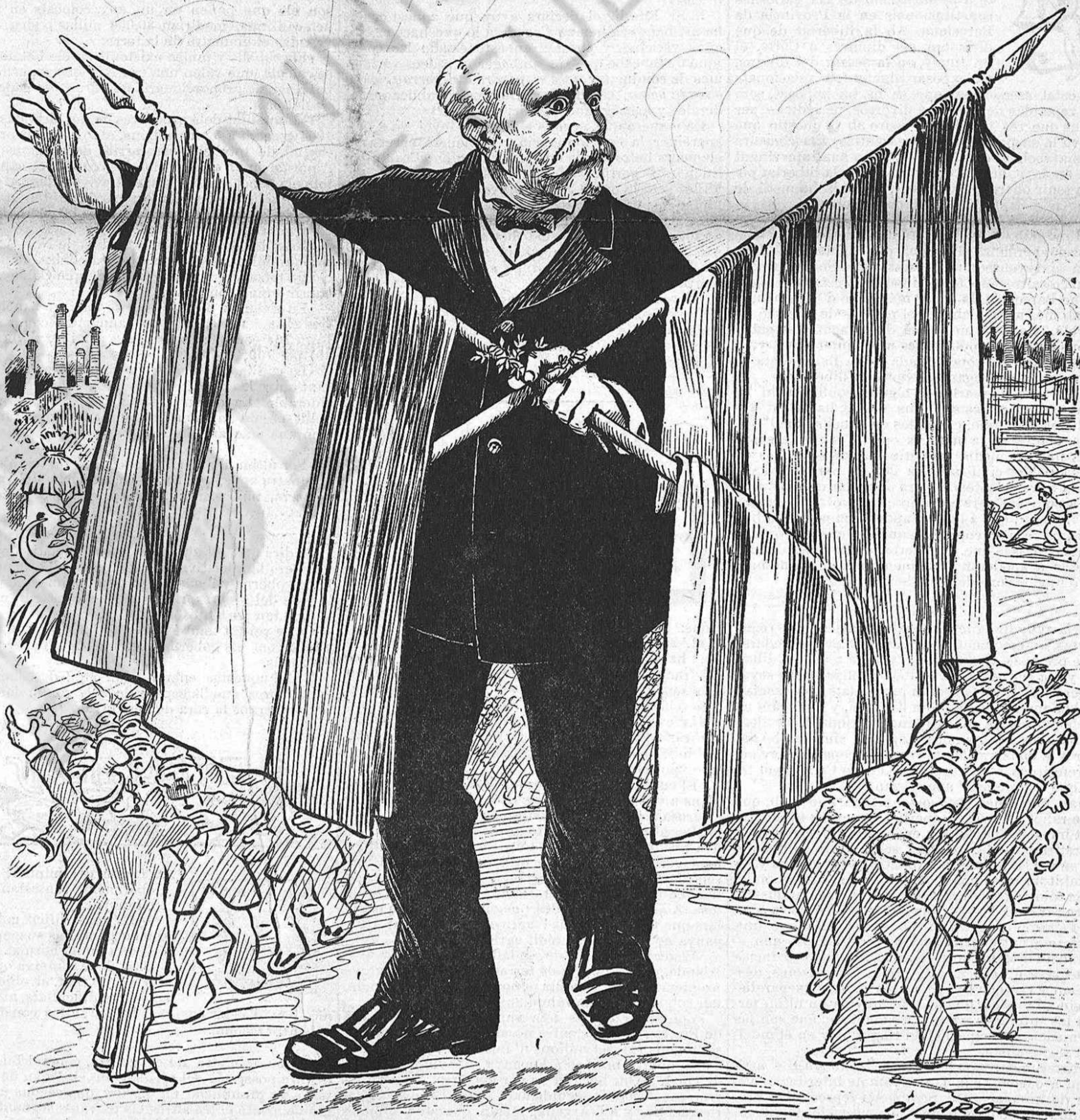
—Héusela aquí. ¡Visca Catalunya y visca Espanya!... ¡Visca Espanya y visca Catalunya!

Al govern li convé, avants que tot, tenir regularizada la situació económica del país. Pero ¿de qui es la culpa, si 'ls pressupostos s' han presentat tart y malament? ¿Sobre qui recauria la responsabilitat de que no pogués cumplirse l' precepte constitucional?