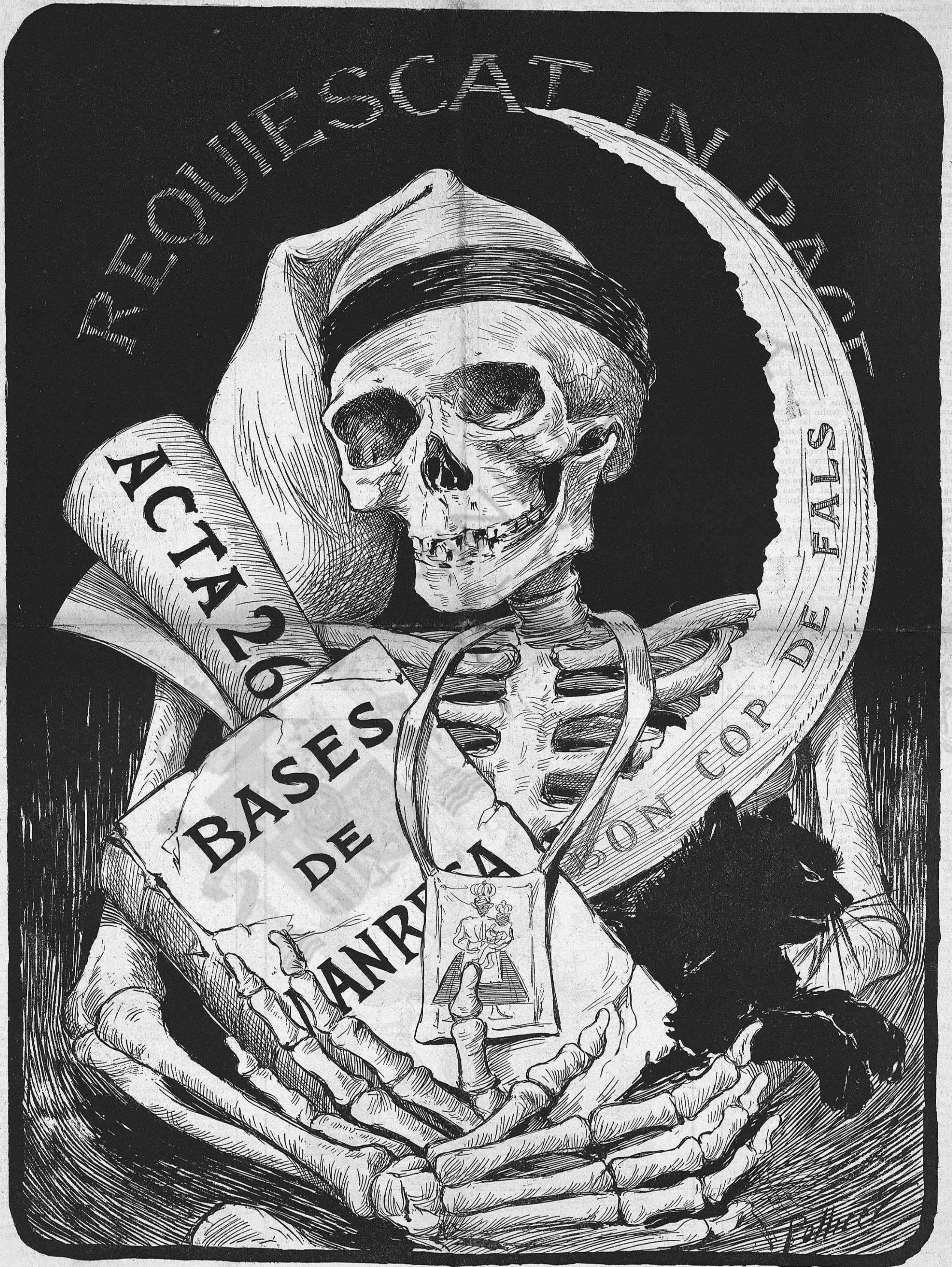
El gran mort del any.