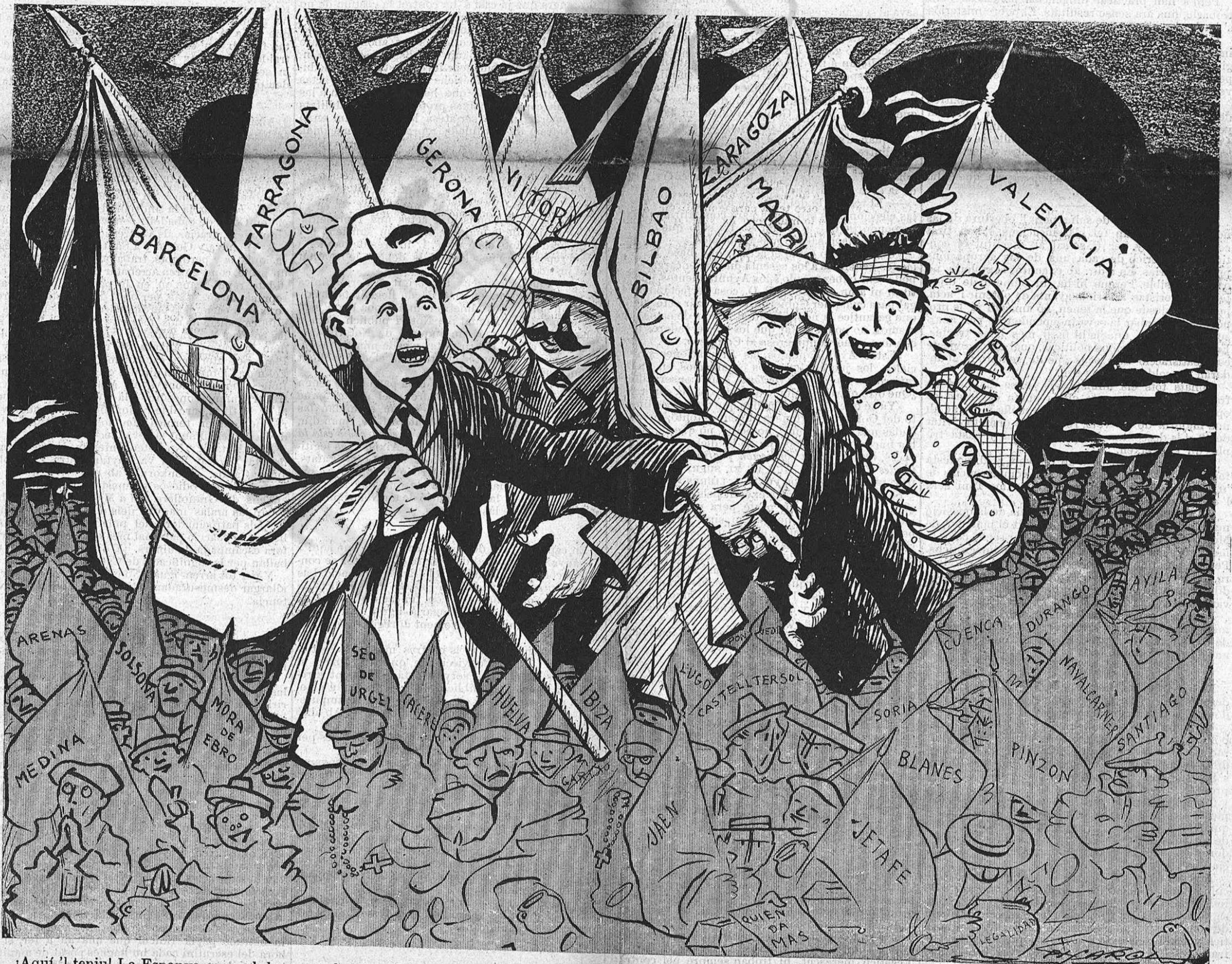
¡Aquí 'l teniu! La Espanya que val, la que treballa y pensa, ha votat per la República; la Espanya negra, la que no val, ni pensa ni treballa, ha votat per la Monarquia.