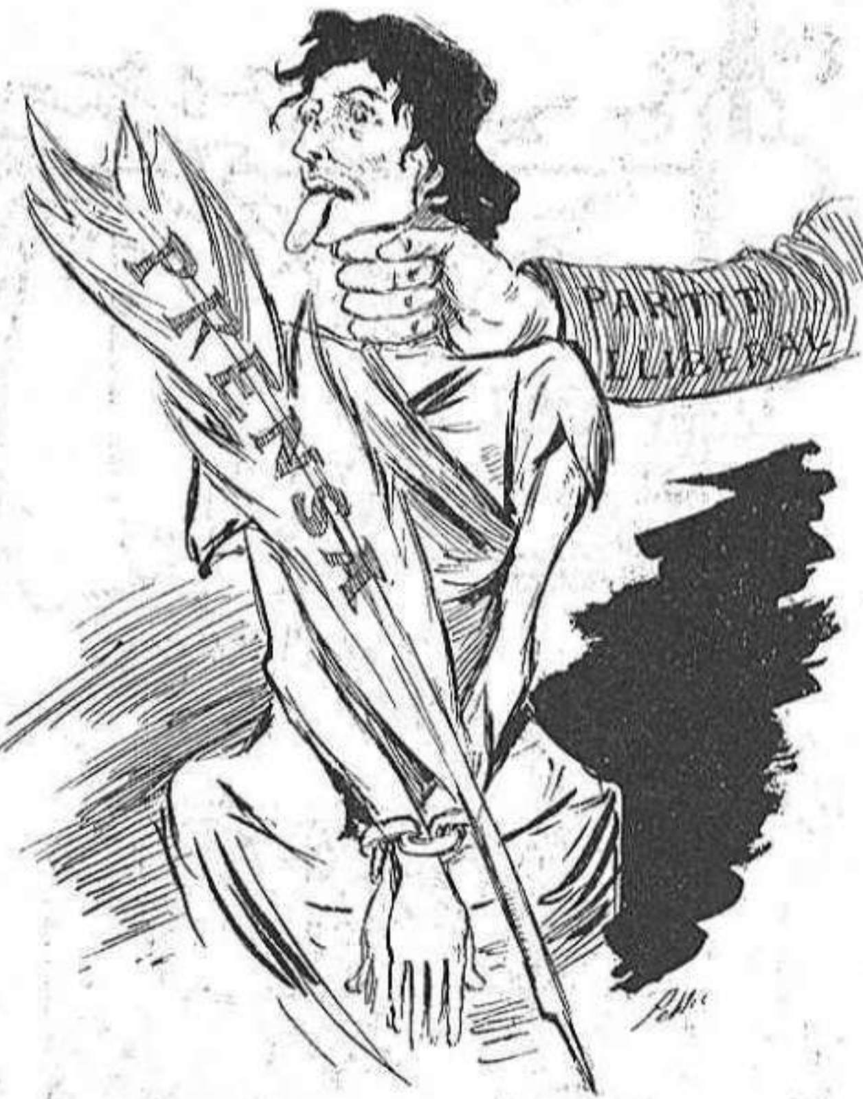
Manin els conservadors, governin els liberals, per' atropellá a la premsa tots son iguals.