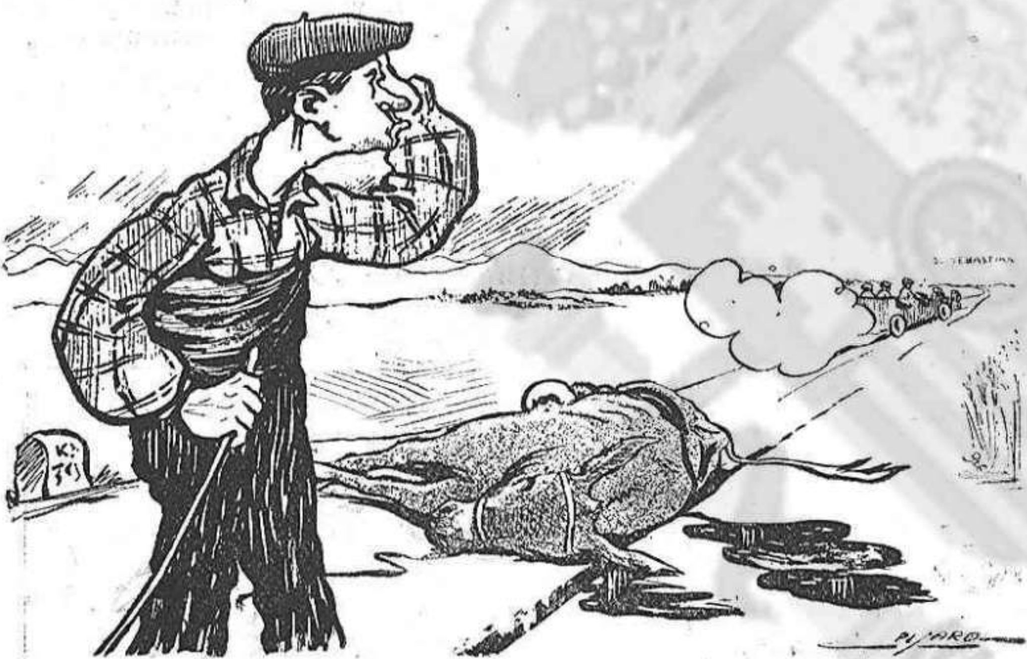
El burro sempre reb.