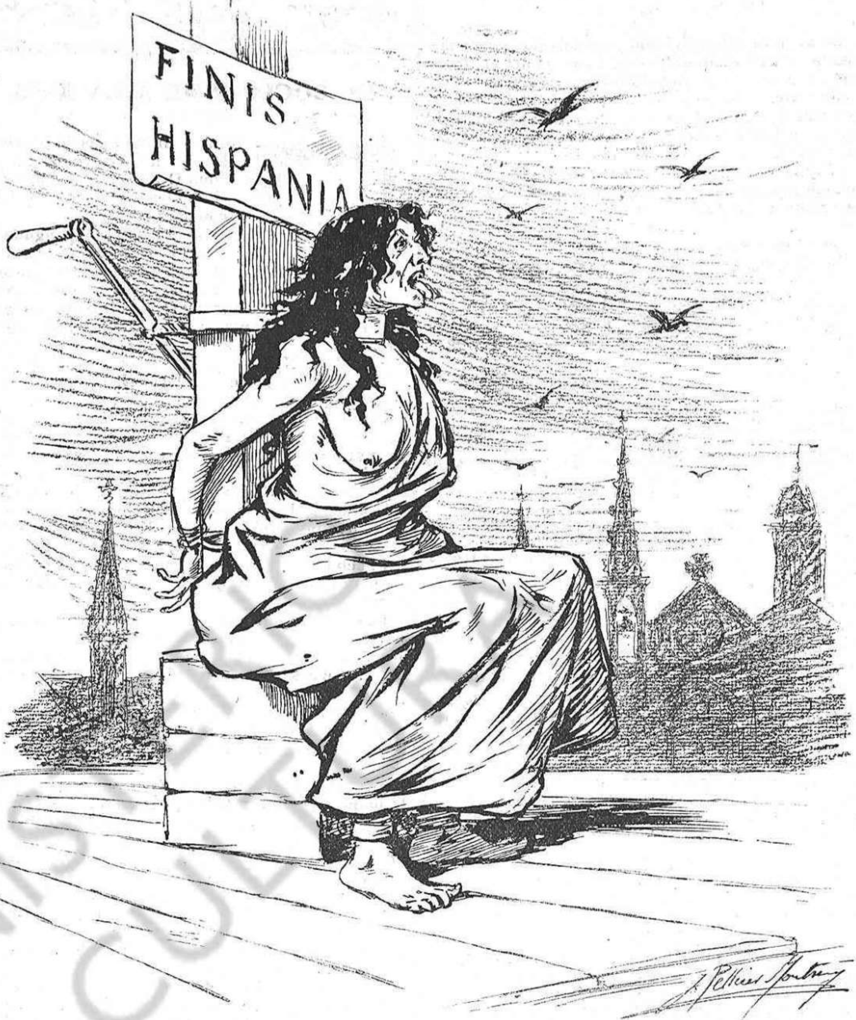
Poch falta per acabá: una apretada, y ja está.

son, acás, els més dignes representants de l' Espanya pintoresca?