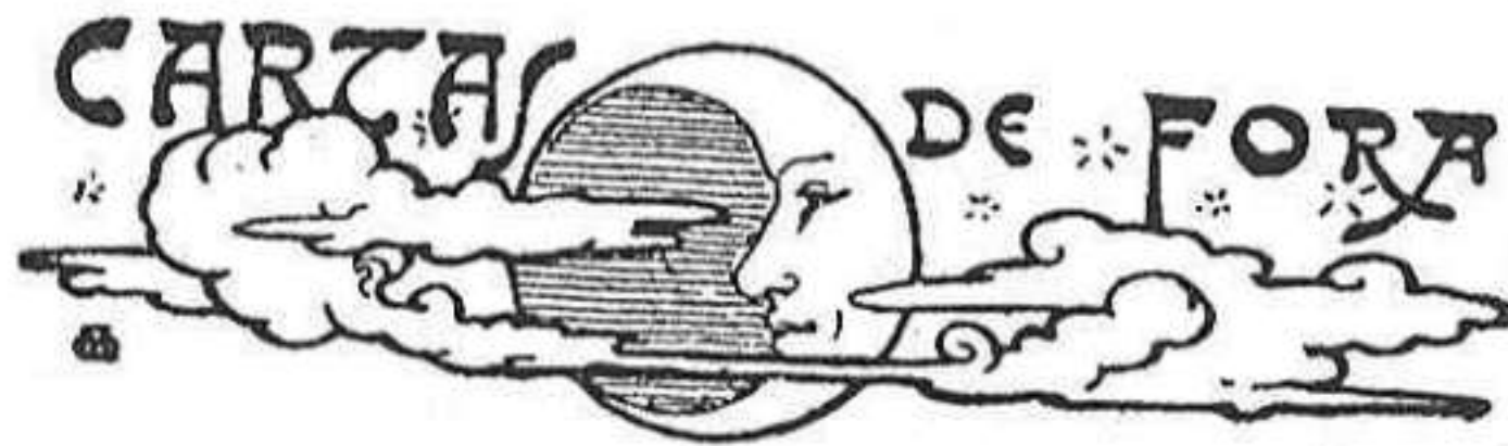
PRADES, 4 de maig

Y quins tips de riure ha de ferse Budha, desde 'l seu cel japonés, al veure la patriótica conducta dels sacerdots de Cristo!