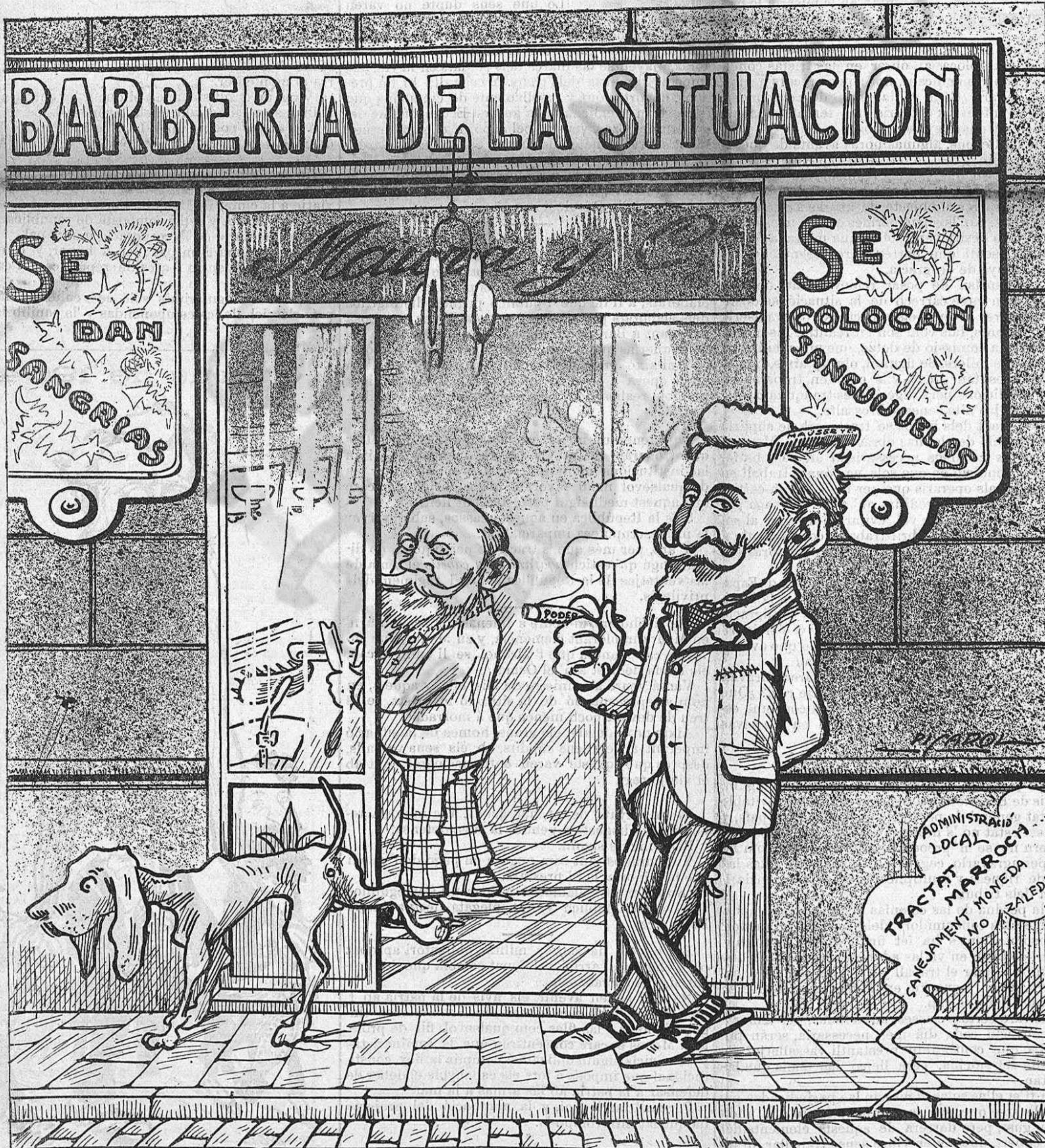
—No us espanteu, barcelonins, encare que 'ls barbers se declarin en huelga: ja us afeytaré jol...