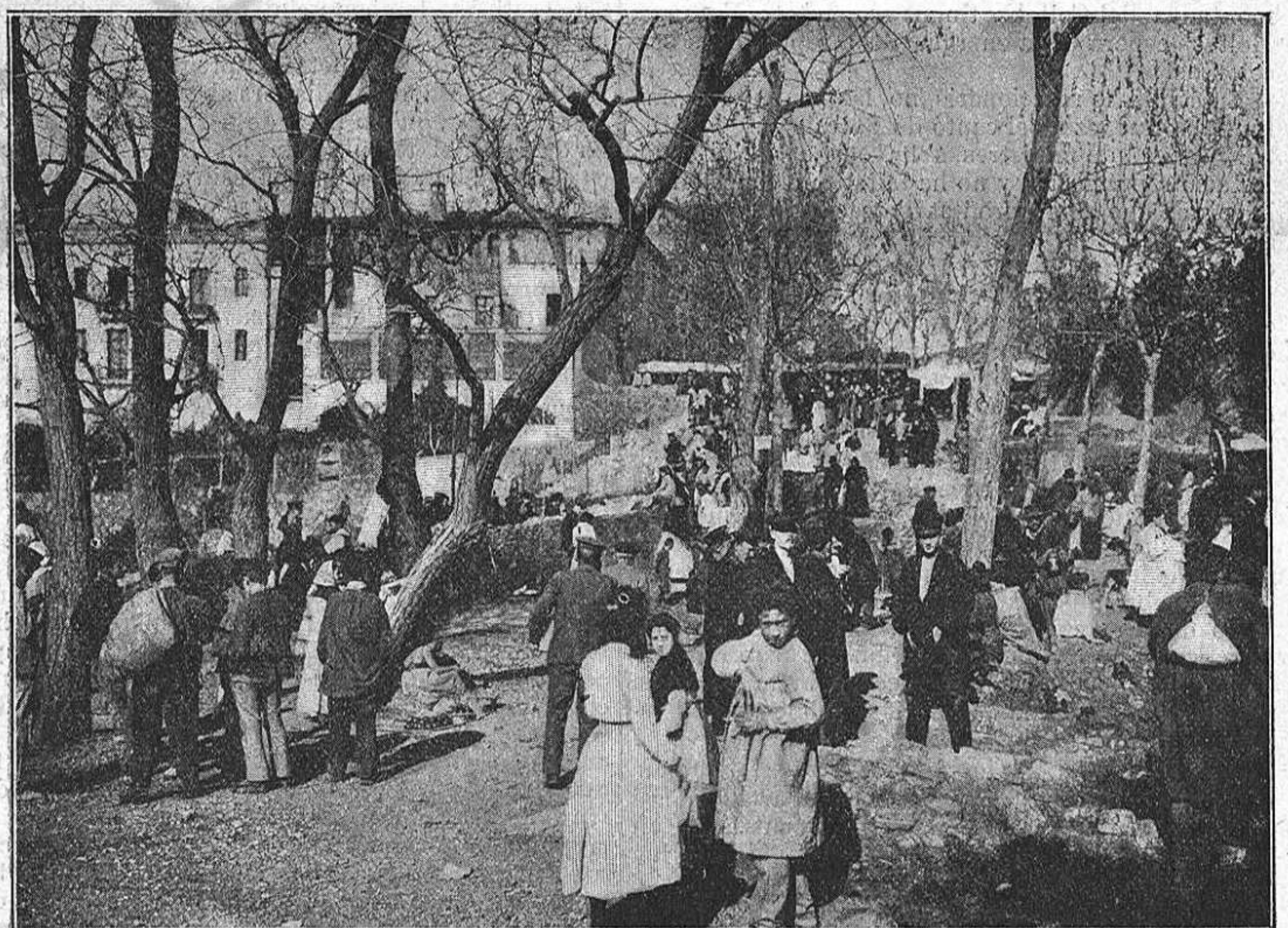
A mitj demati.