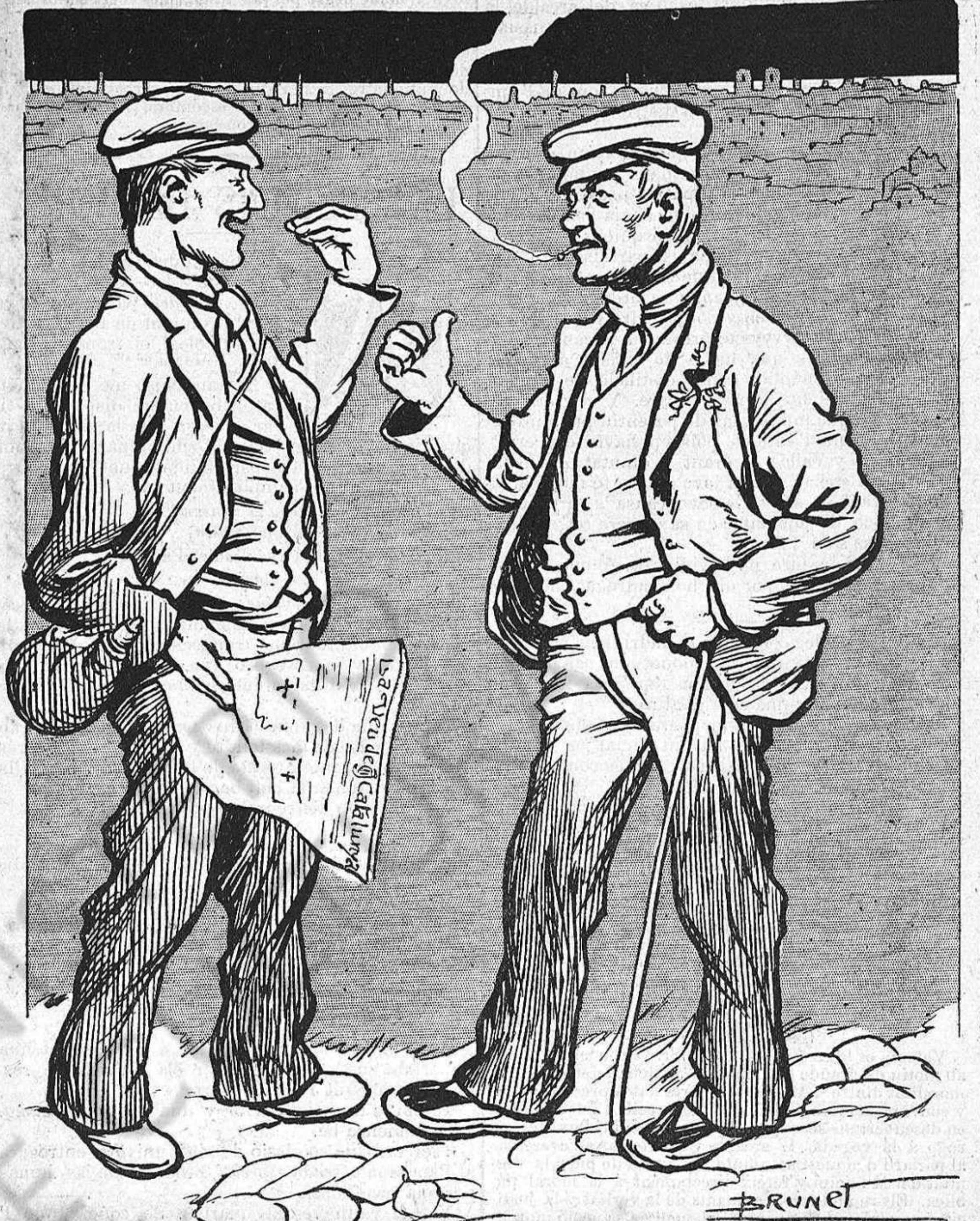
—Mira tú, la Perdiu no 'n diu res del aplech republicá d' avuy. —¡Qué vols que 'n digui! ¿Que no veus que 'ns l' hem brenada?

Una bonica caricatura del Apeles Mestres que ha vist la llum en La Publicidad. Dos sabis están conversant: un d'ells te entre mans una memoria científica, y diu: —Vaig á presentar á l' Academia de Medicina de Berlín aquest cas may vist en els anals de la Patologia: el de un brenar que s' indigesta als que no han pres part en ell.