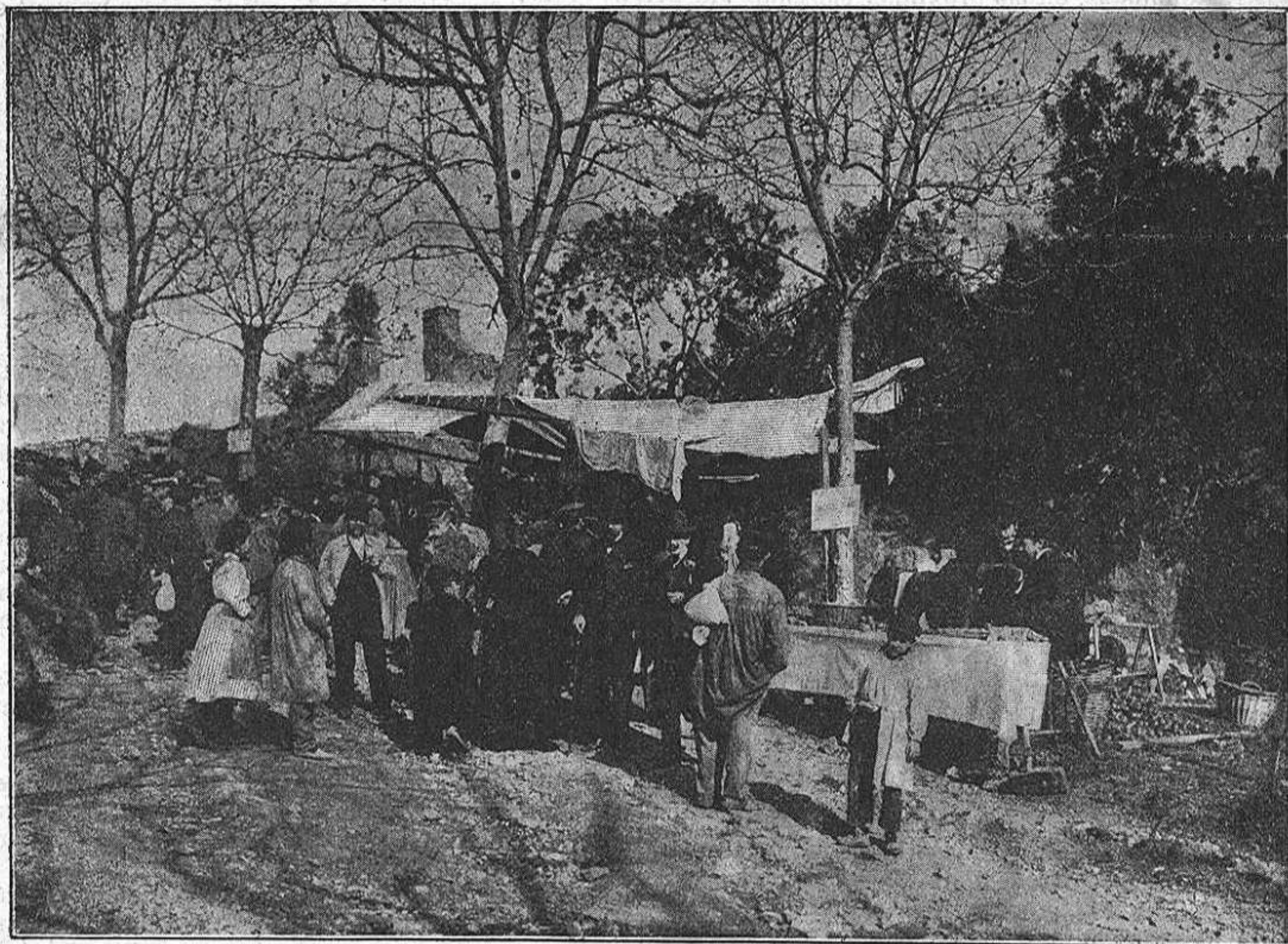
Instalació de las cantinas.

Brenar celebrat al Coll pels republicans de Barcelona 'l dia 15 del corrent