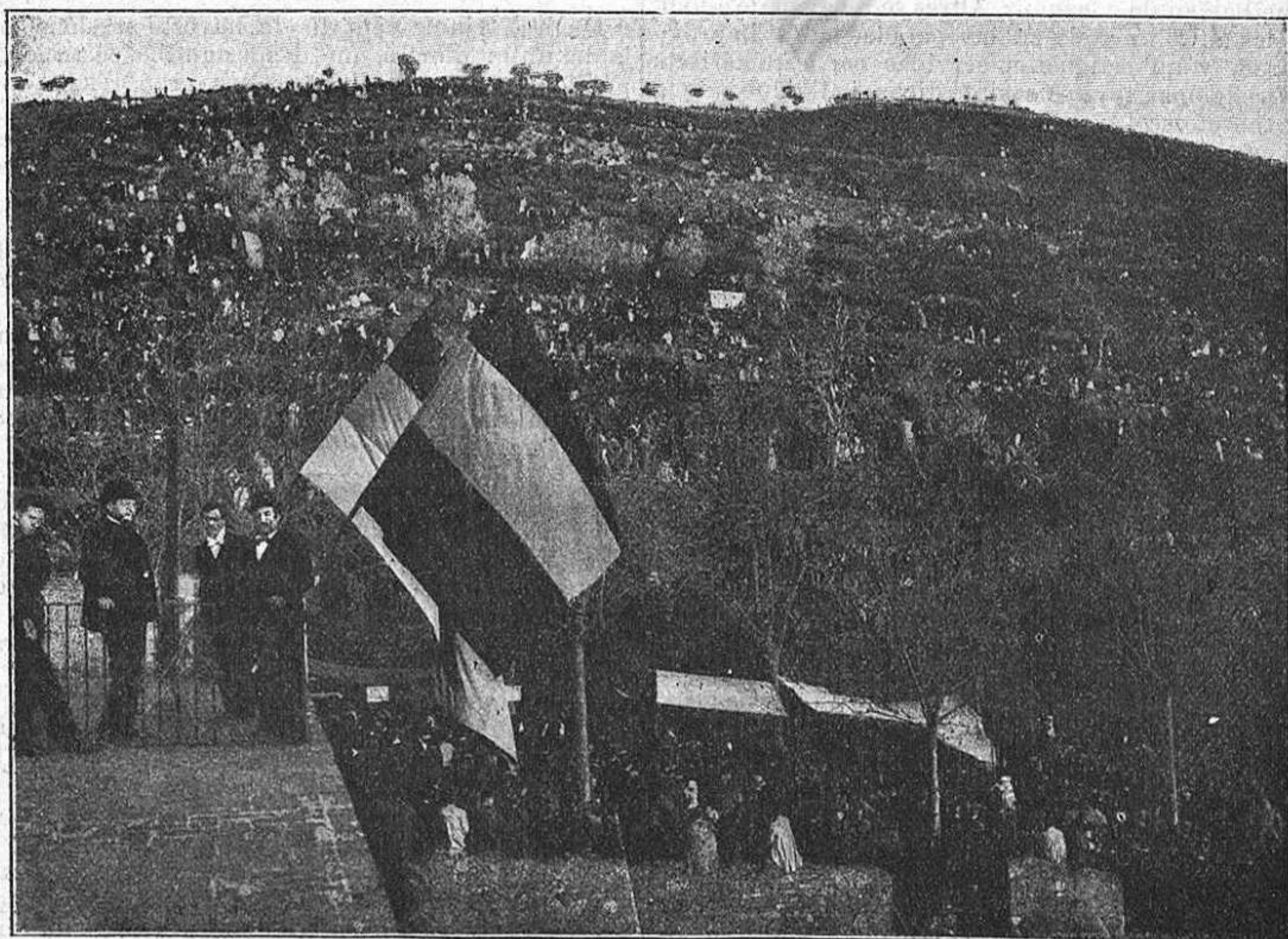
Desde la terraza del restaurant.