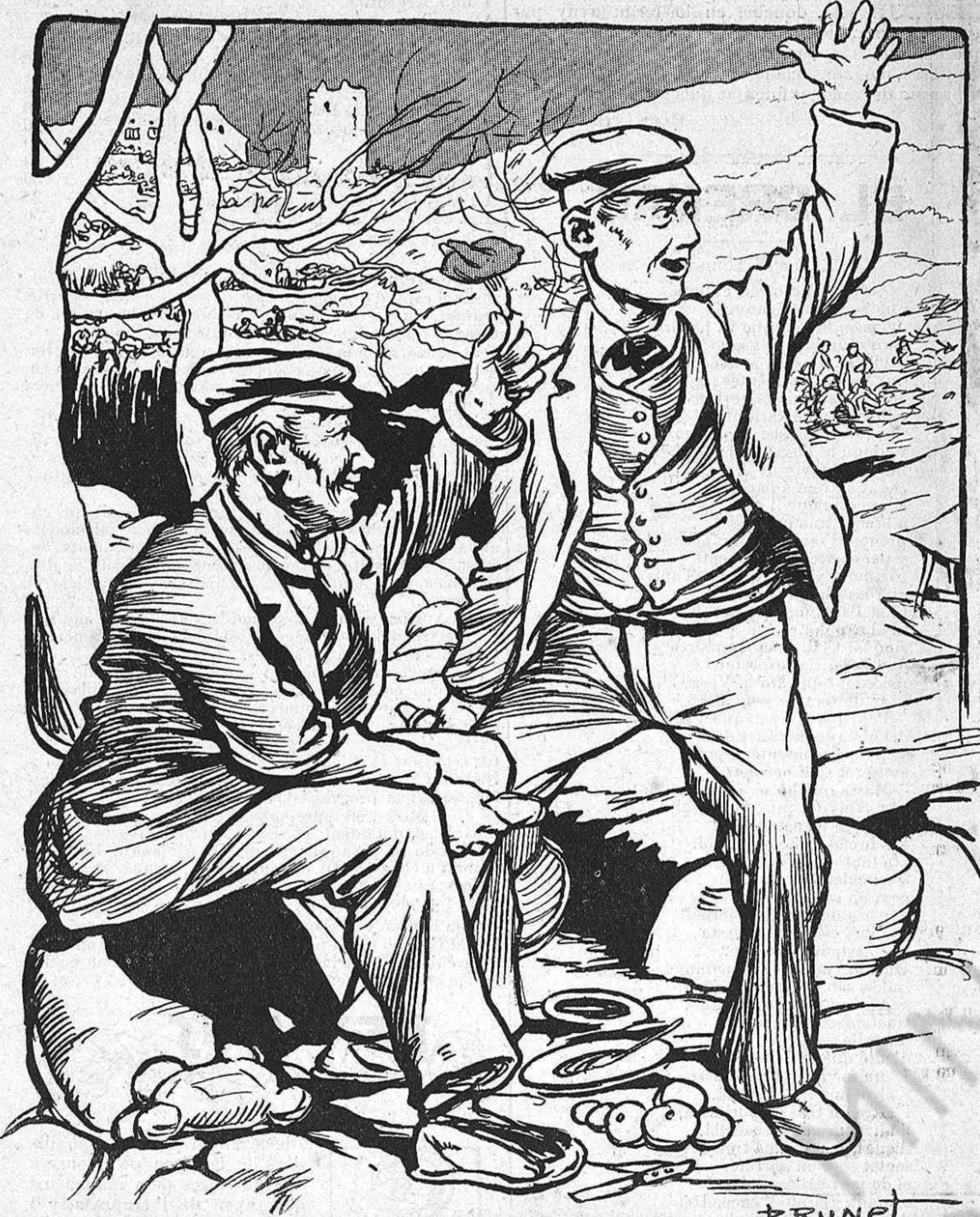
—¡Va de perdiu, á la salut de la República!