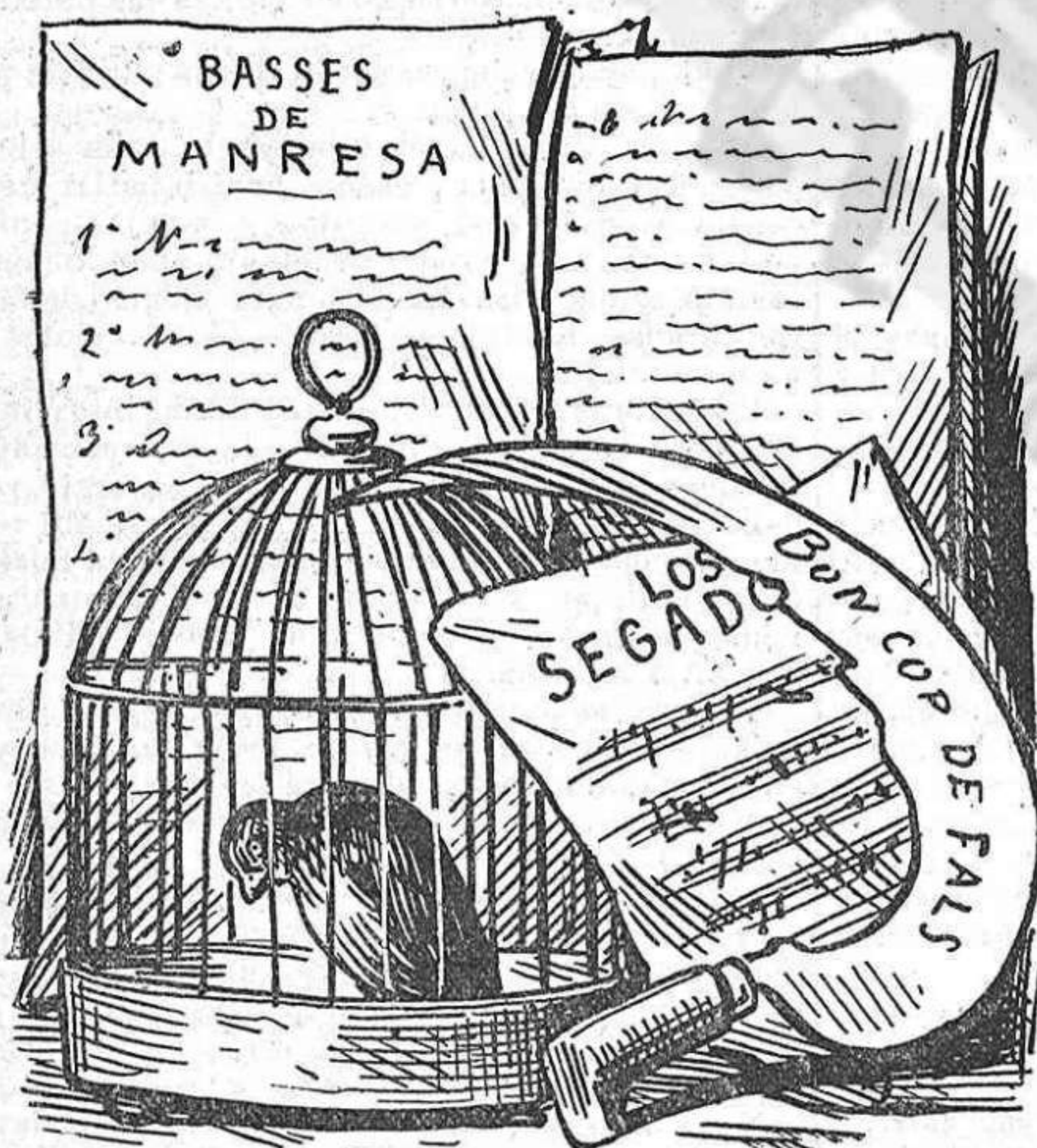
La corbeille de la núvia.