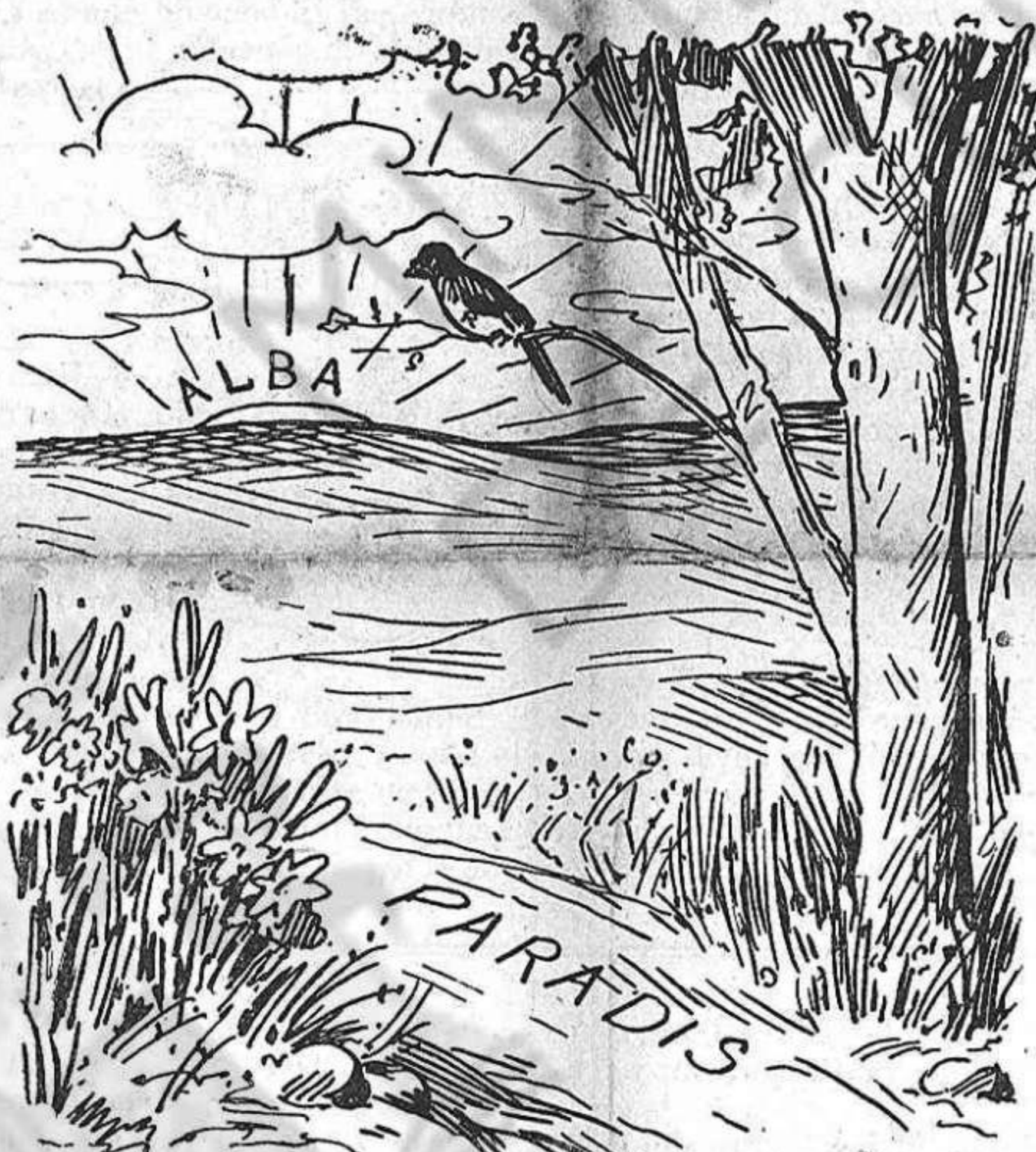
PERSPECTIVAS.—L' alba somriu... canta 'l russinyol... Un paradís, un verdader paradís.