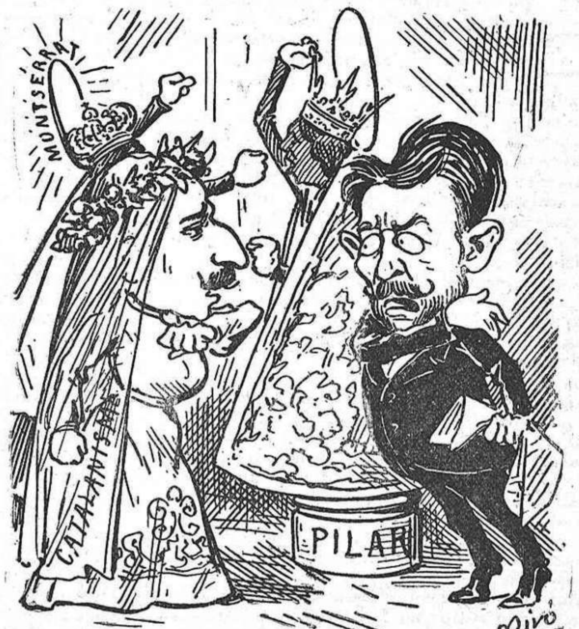
vindrà 'l daltabaix. Per sobres qui ha de ser la patrona de la família: éla Virgen del Pilar ó la Moreneta de Montserrat?