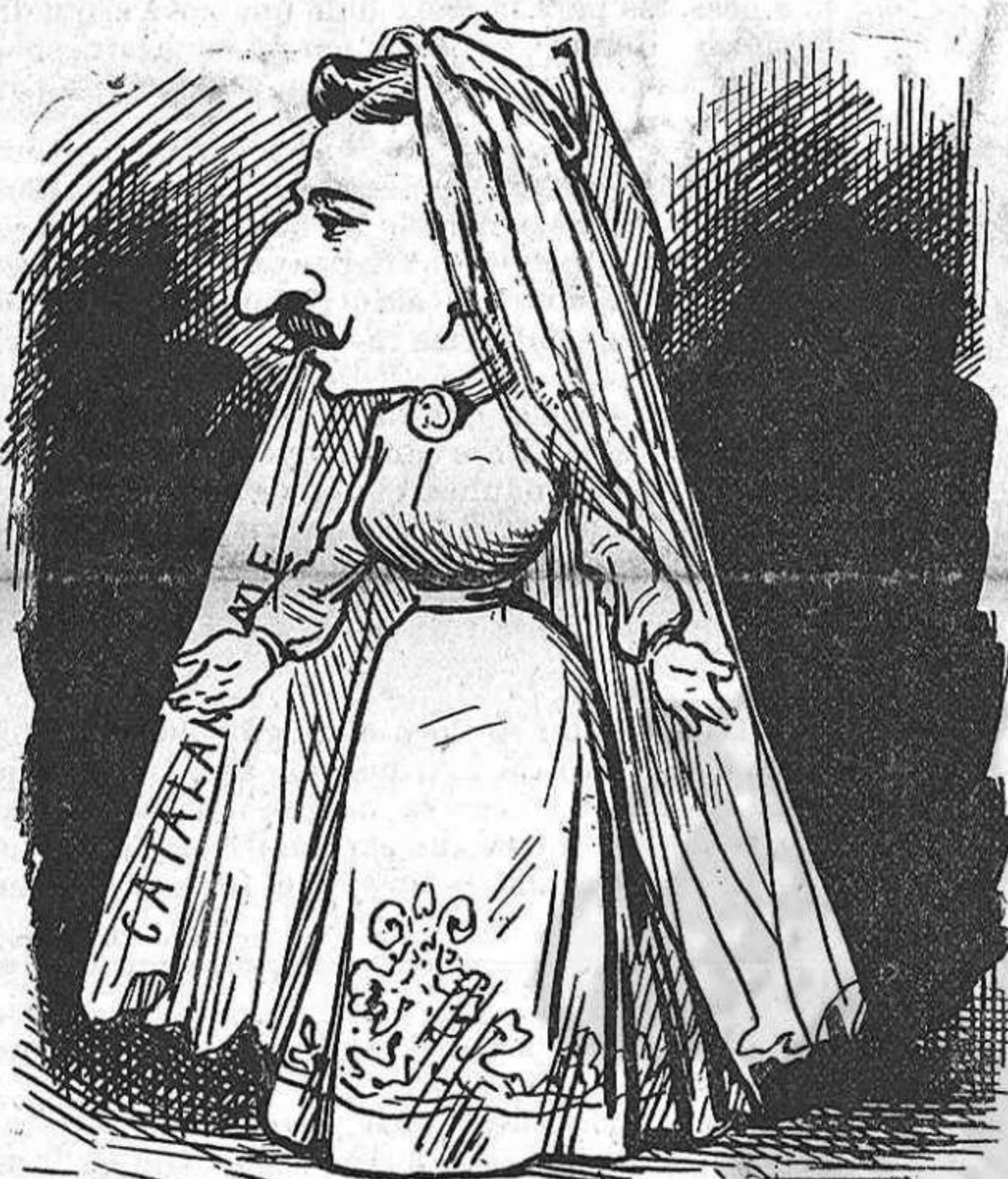
La núvia esperant entrar al Paradís... ó vice-versa.