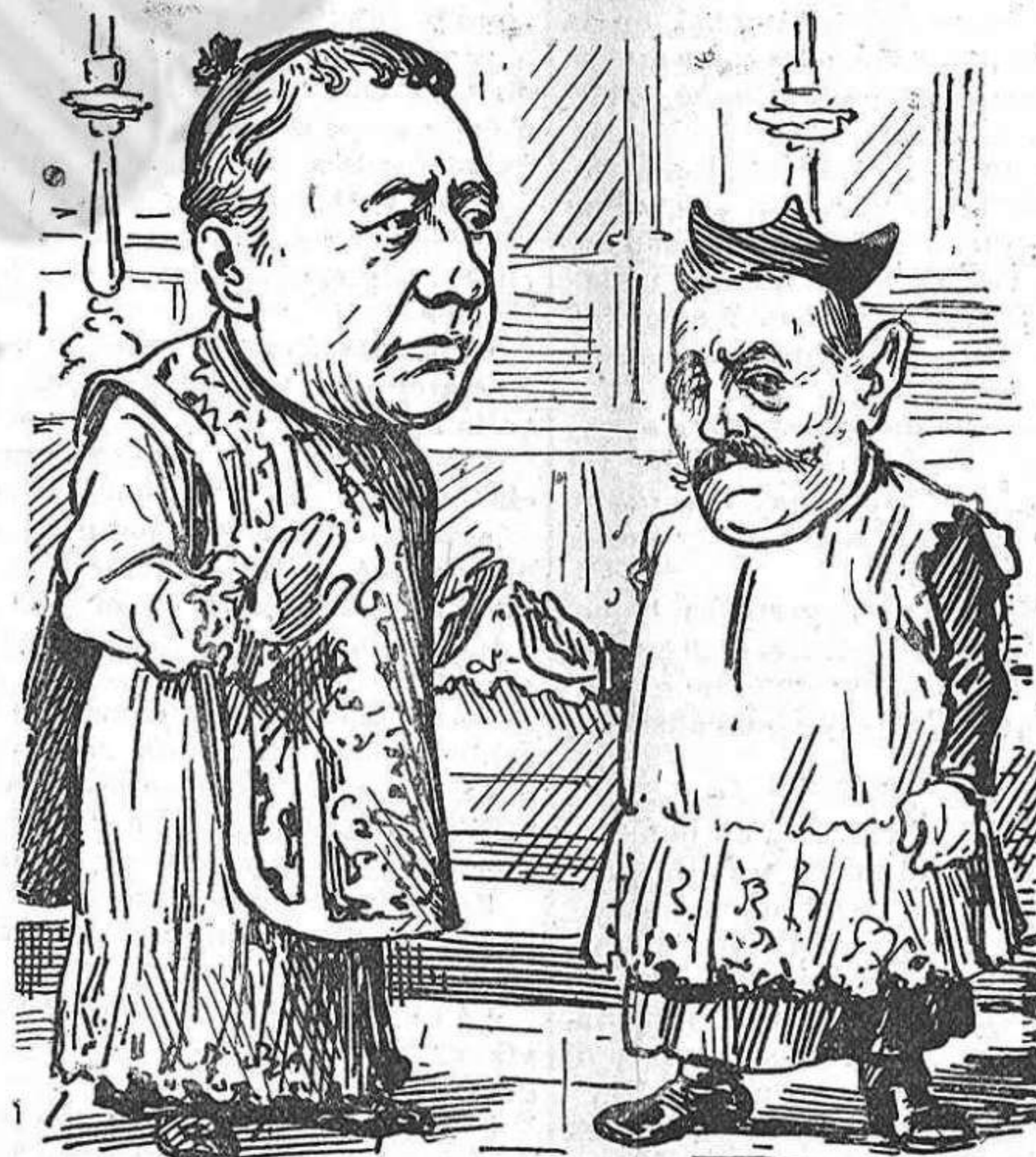
Pero quan ja estarà tot a punt de solfa, y el clero segador vestit per la cerimonia.