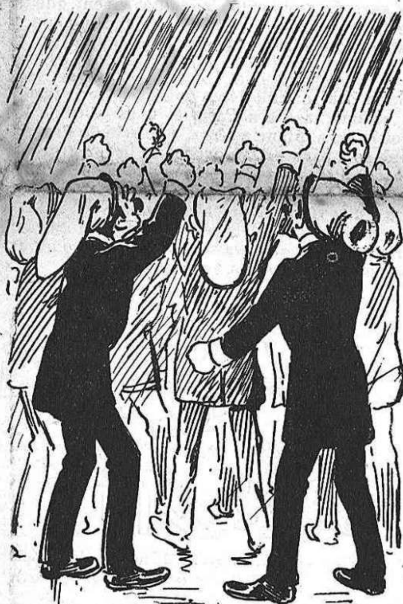
Las comisiones organizadoras ¡no n' han tirat pocas de malediccions cap amunt!