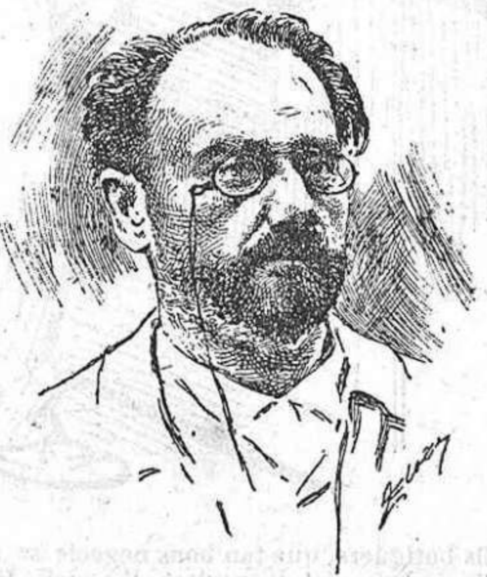
Retrato de Zola al comensarse la qüestió Dreyfus.

Veritat y Justicia quins dos títuls més suggestius, més plens de afalgadoras esperansas, proclamats per en Zola! Veritat es el fruit de las impresions del autor en una de las campanyas més tremendas que hagué de renyir, durant la seva vida, en pro de la ignocencia atropellada. Tothom recorda la defensa que feu del desventurat Dreyfus, en el memorable article J' accuse... L' admiració que provocá ab aquell rago de valor cívich es de aquells que perduran eternament. Tot li era advers: l'opinió de