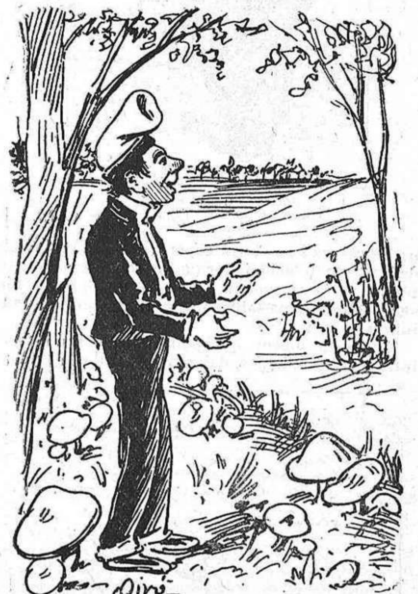
Y, lo que ara diuen els pagesos: —Fet y fet, las grans fiestas las farém nosaltres cullint el bé de Deu de bolets que ab aquestas plu- jas ha sortit.