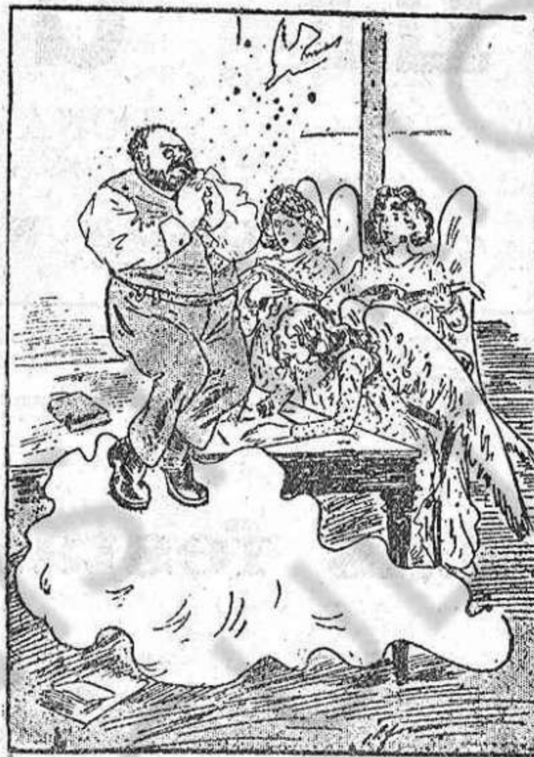
Le Rêve, de Zola. (Dibuix de Forain.)

L' autor de aquesta serie de maravellas, al mateix temps que las escribia, havia de lluytar per imposarlas. Ferm en els principis de la escola materialista, sostenia las més encarnissades polémicas ab sos enemics y émuls y fins ab els envejoses, que 'l tatlxavan de groller, escandalós y pornogràfic. De cap autor s' ha dit may lo que de 'n Zola; poch se 'n trobaran en cambi que, com ell, s' hajan sapigut ventar las moscas. El públich acabá per donarli la rahó, agotant rapidament las edicions que se xifraven per milers y milers d' exemplars. Y las famosas novelas rebassant las fronteras de la Fransa donavan la volta al mon traduhidas a todas las llengüas conegudas. May un autor ha alcanzat una celebrat tan universal.