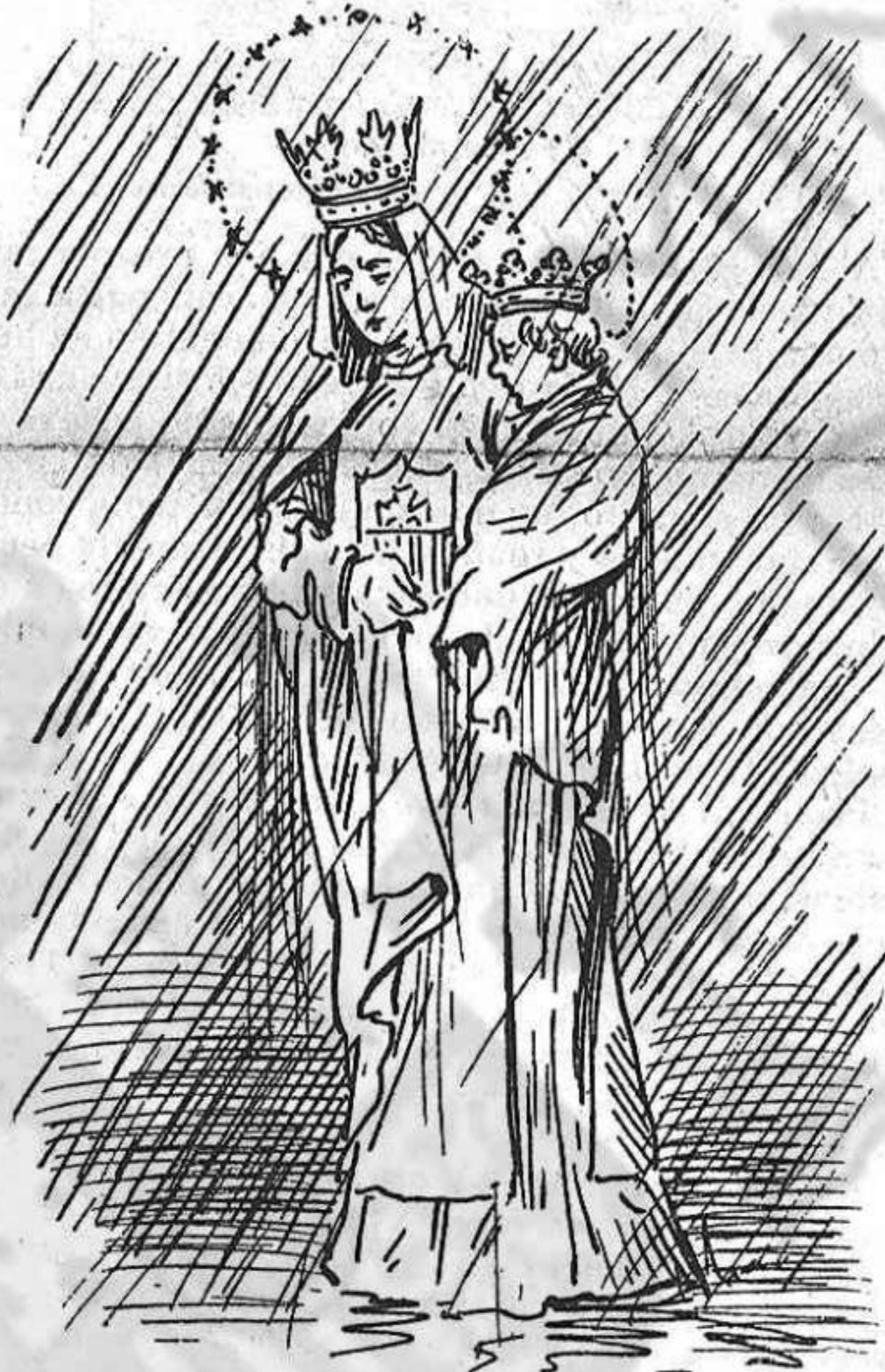
La protagonista, mullada de cap a peus, diu que ella no 'n té la culpa.