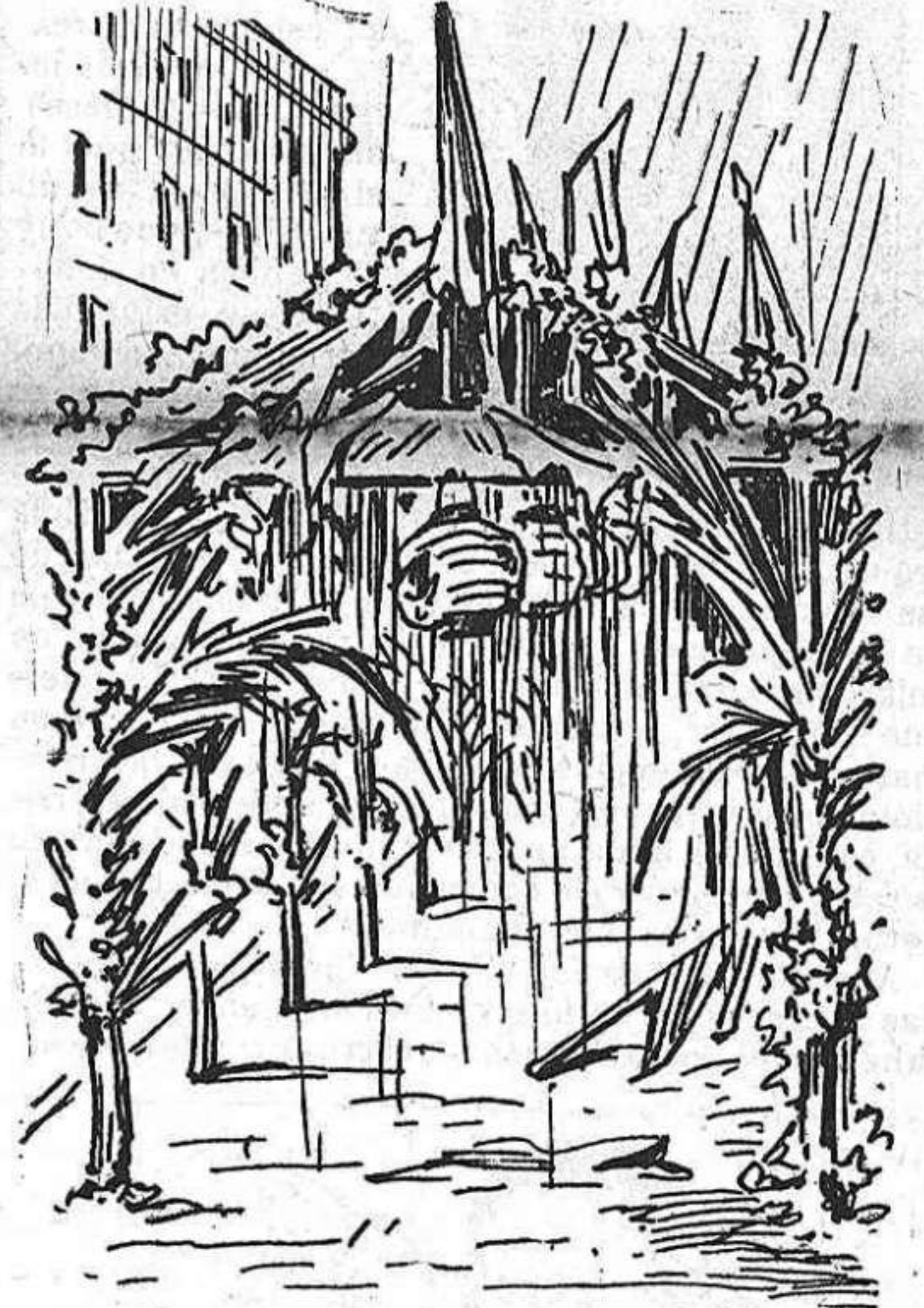
Els carrers, ja 'ls haureu vist: ¡quin espectacle mes trist!