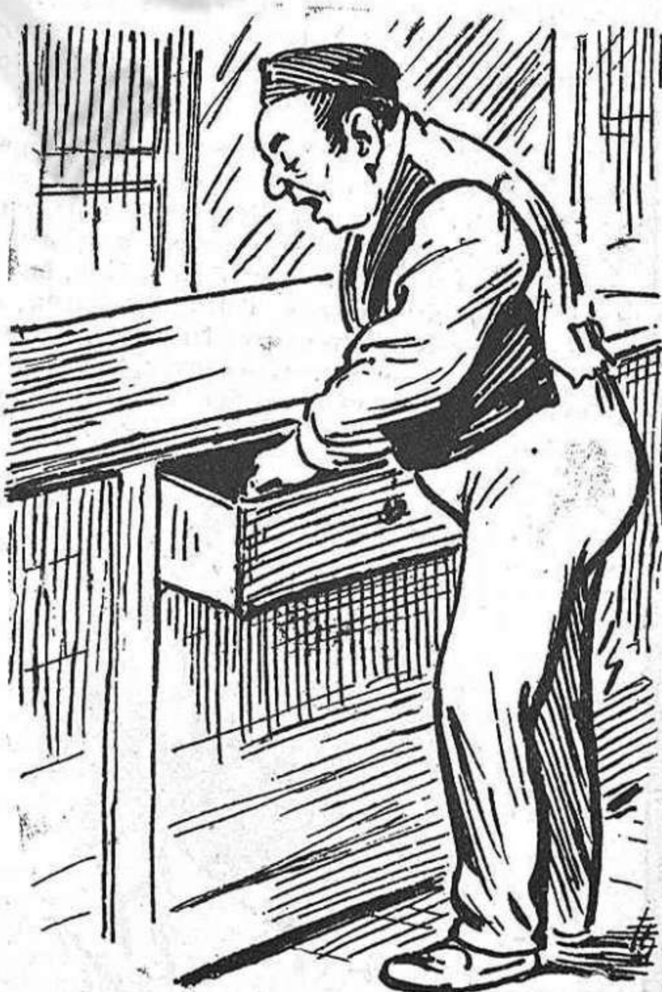
Els botiguers, que tan bons negocis se pensavan realisar, han vist la veritat d'aquell ditxo: Carrers mullats, calaixos aixuts.