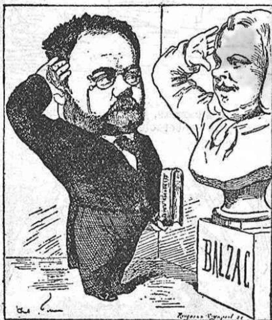
Zola saludant a Balzac. (Caricatura de A. Gill.)

Aquestas tendencias lliures i progressivas posadas al servey de un humanitarisme generós constitueixen el credo del genial escriptor, y tan encar-