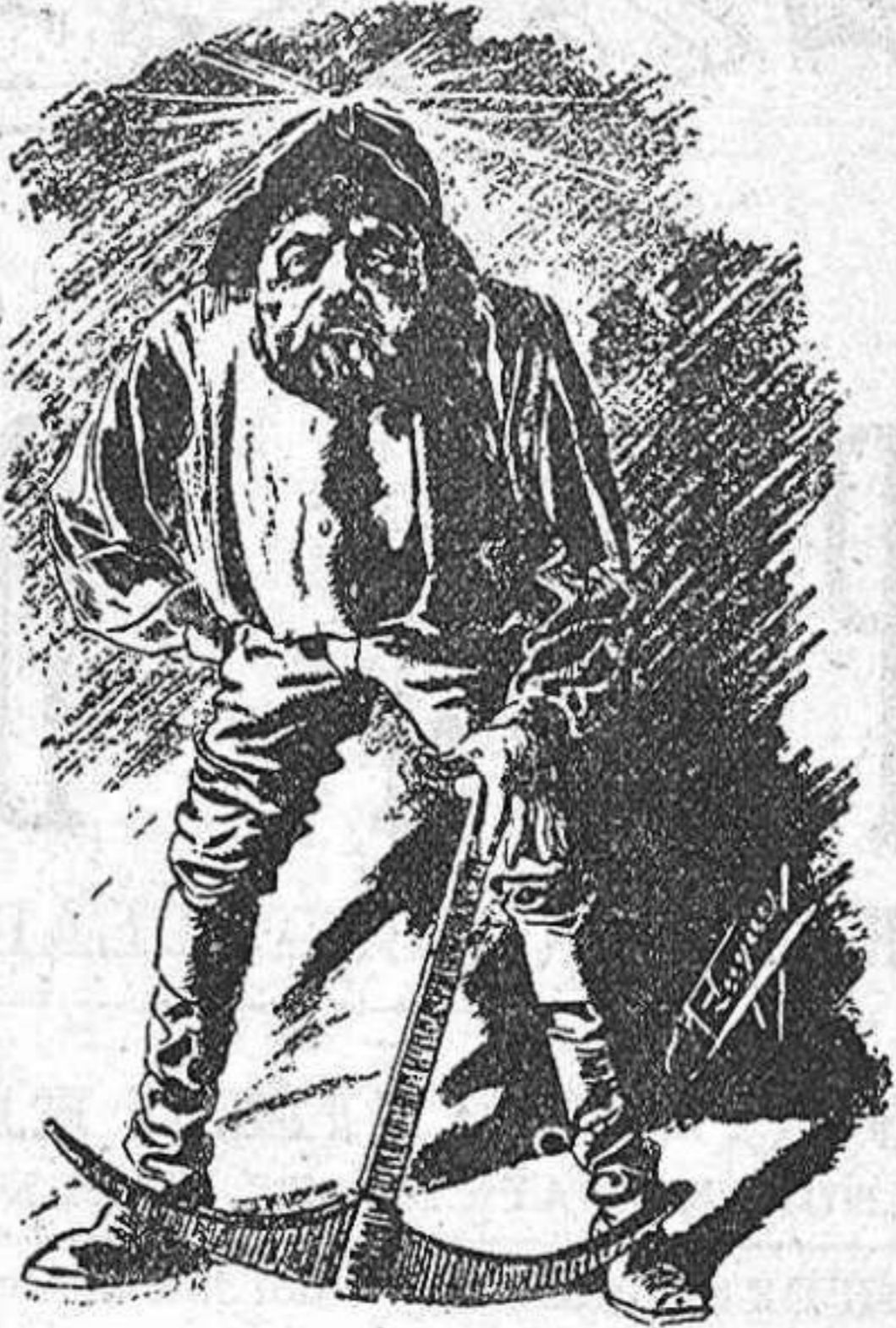
L' autor de 'Germinal'. (Caricatura de M. Luque.)

Ell es qui rompent ab las falornias de la imaginació tan propensa al desvari, proclamá 'l método experimental aplicable a la novela. Per escriure cosas de la vida es precis observar la vida atentament, saberia sentir y analizarla fins a lo més íntim pera després reproduhirla vigorosament, ab fidelitat, en una síntesis perfecta. Aquest método no excluïeix