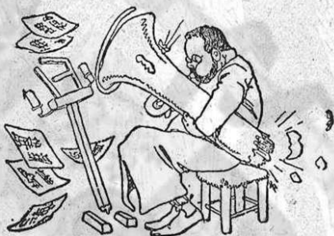
Variacions sobre 'La Terre'. - Música de Emili Zola. (Caricatura de Caran d'Aché.)

Un detall curiós dels seus estudis. En l'examen de retórica, ell qu' estava destinat a assombrar al mon ab els seus escrits, rebé carabassa.