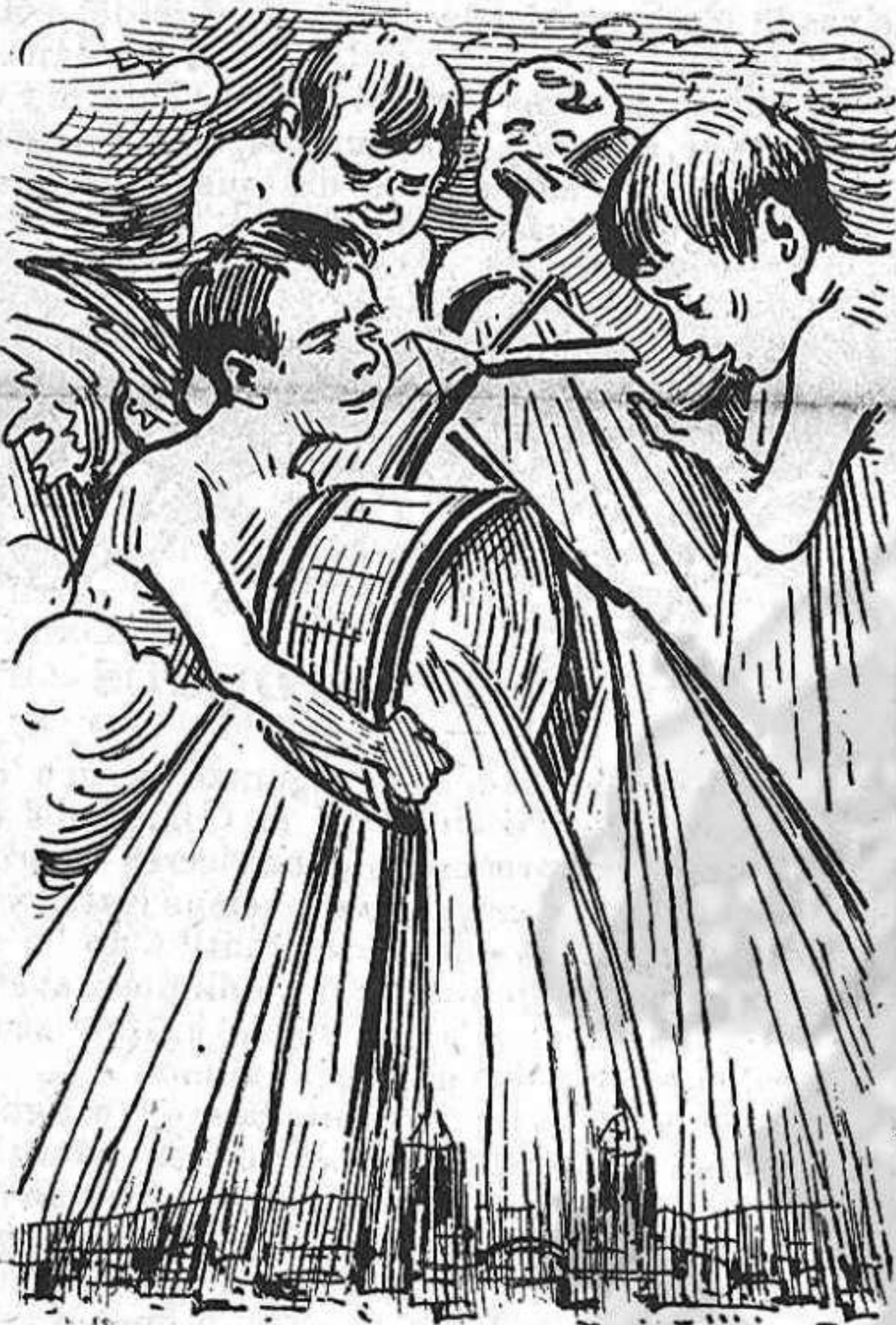
Els que mes han contribuït al seu èxit han sigut els núvols.