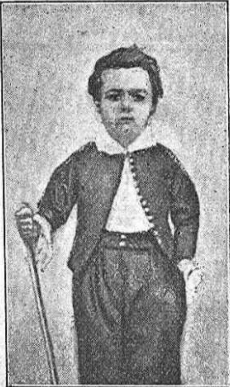
Zola a l'edat de 8 anys. (De fotografia.)

Aixís han procedit tot els sers superiors aspirants a mereixer el nom de redemptors del esperit humà. Aixís era també aquest escriptor admirable que 'l mon acaba de perdre: Emili Zola.