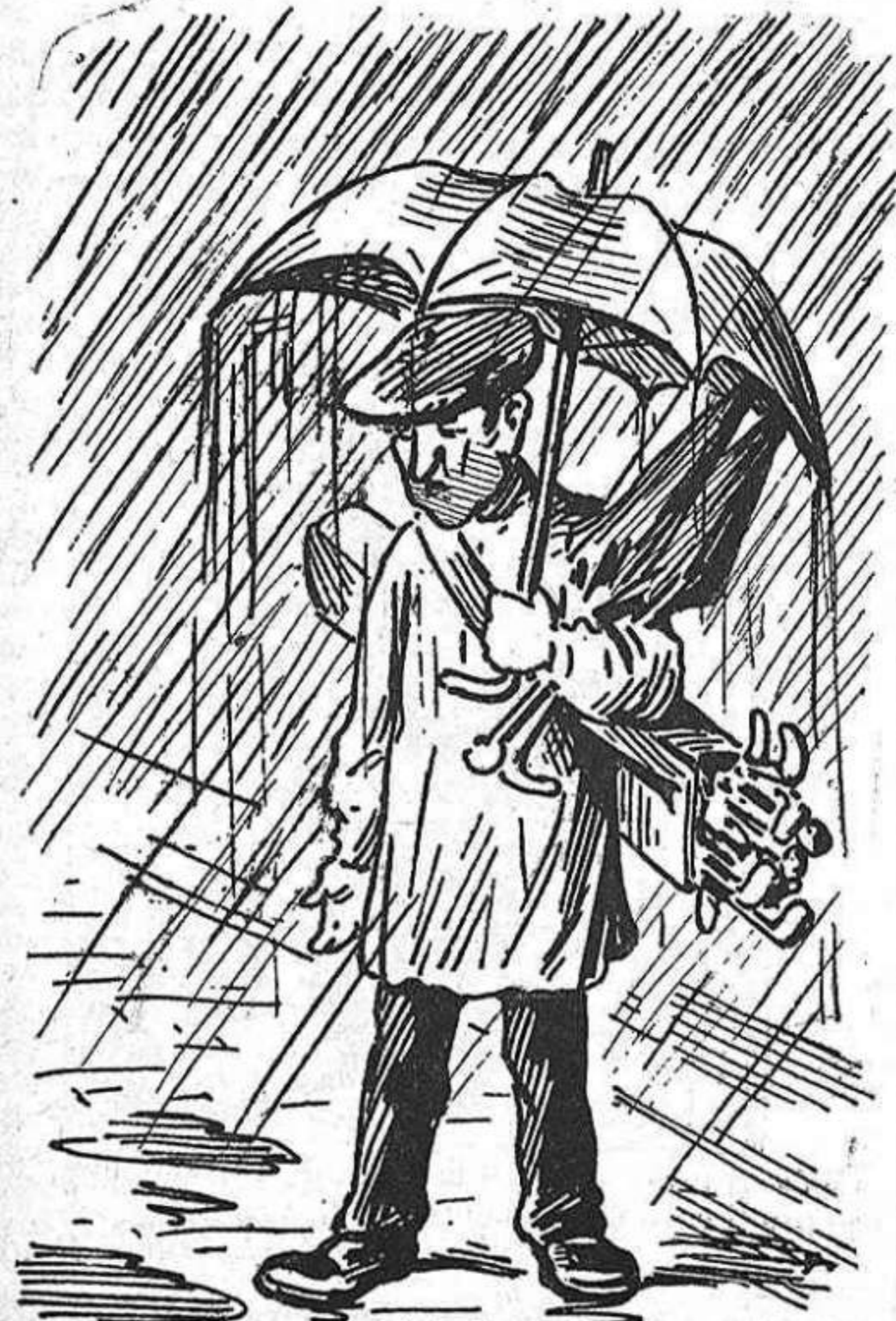
¡Ni 'ls venedors de paraguas han fet res! Com que tots els forasters se 'l portavan...