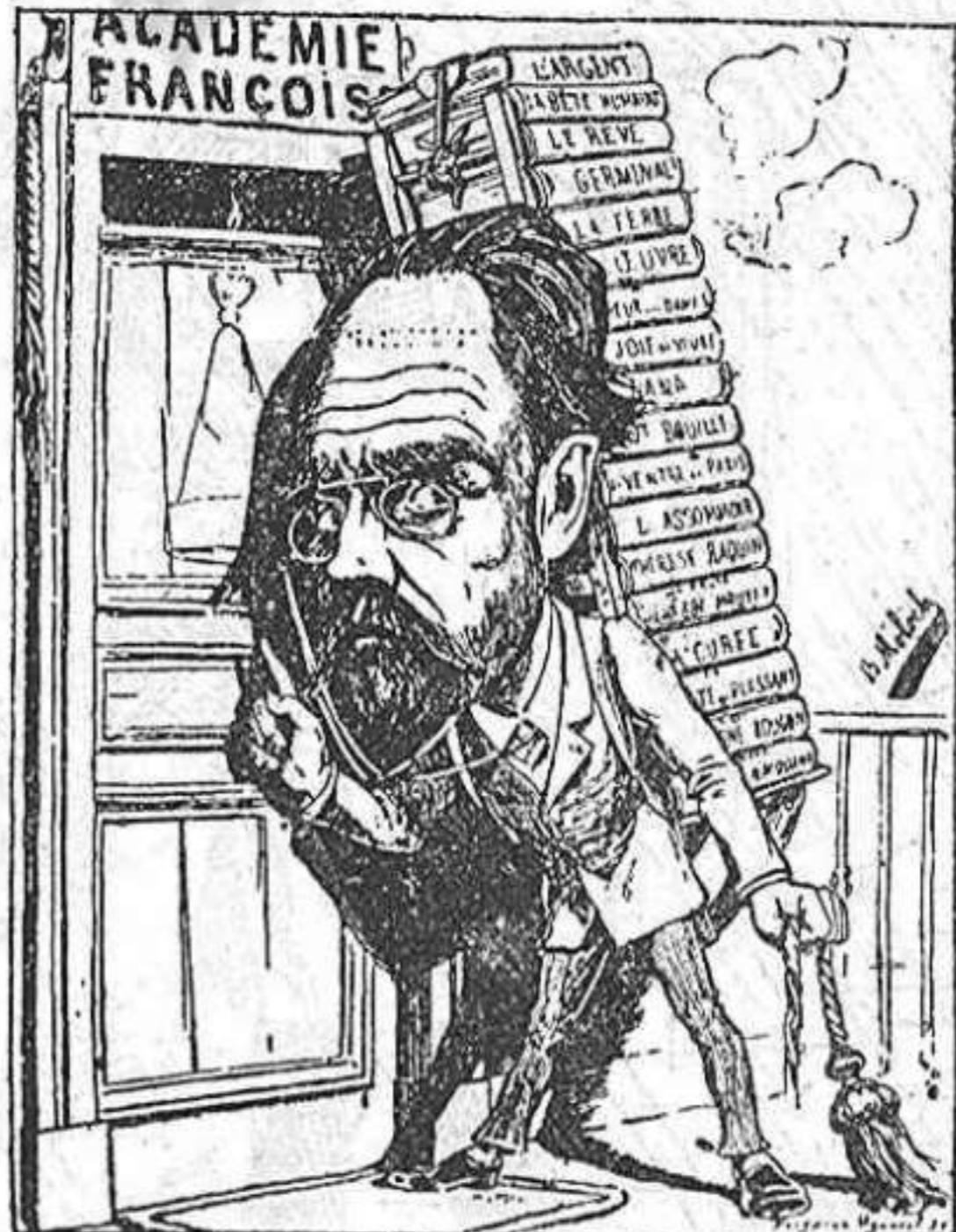
Zola trucant en vá a la porta de l'Academia, fins a rompre 'l cordó de la campaneta. (Caricatura de 'La Silhouette'.)

Trasladantse a París desitjós de obrirse camí quins días més tristos no hagué de passar en un principi! Ell mateix conta que la major part de un hivern no tingué altre aliment que pa sucat ab oli. El pa se 'l guanyava com podia y 'l oli li enviava