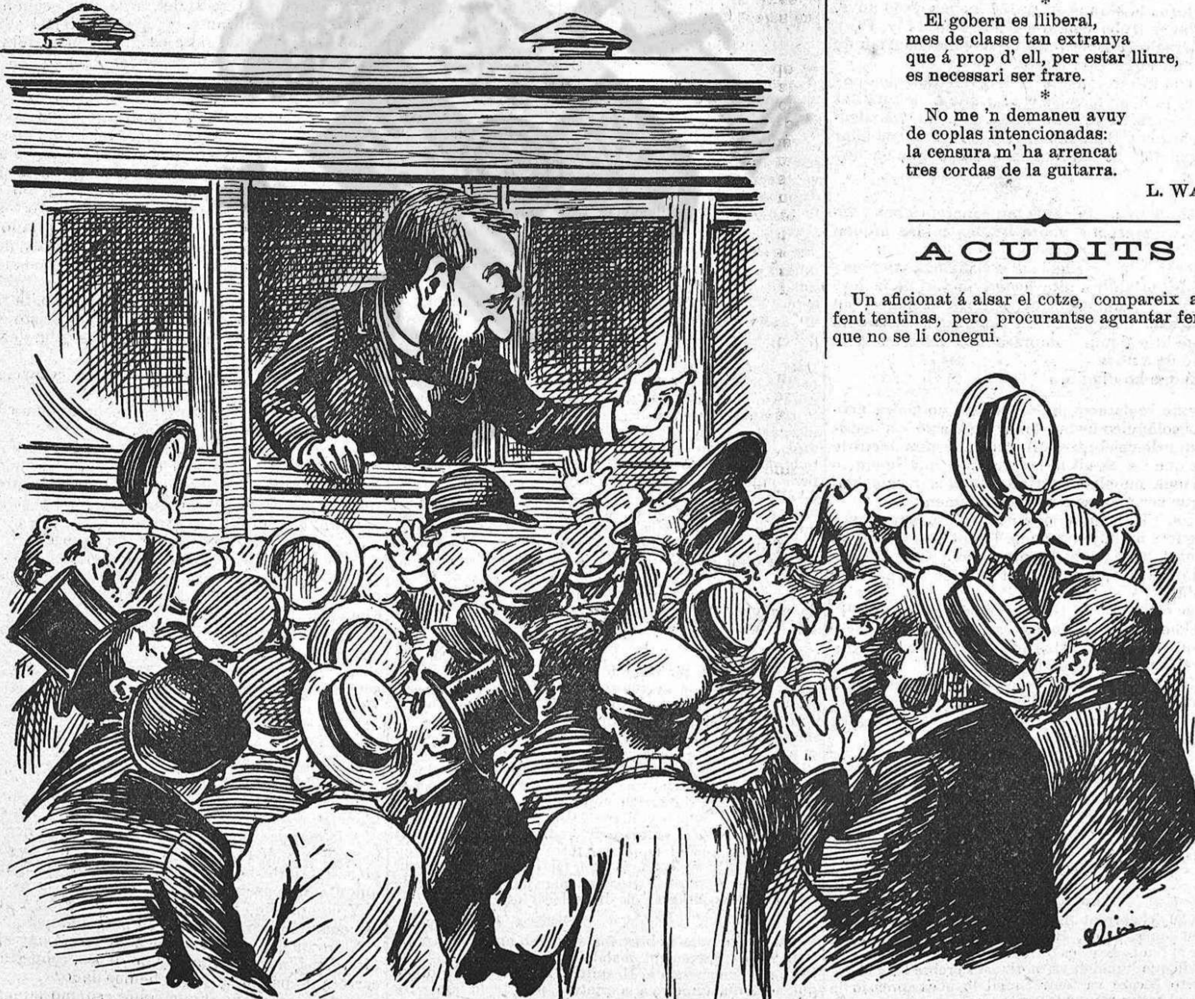
—Quan se restableixi l' imperi del dret, tornaré a Barcelona, y ho diré tot, ¡tot lo que ara m' hi hagut de callar!