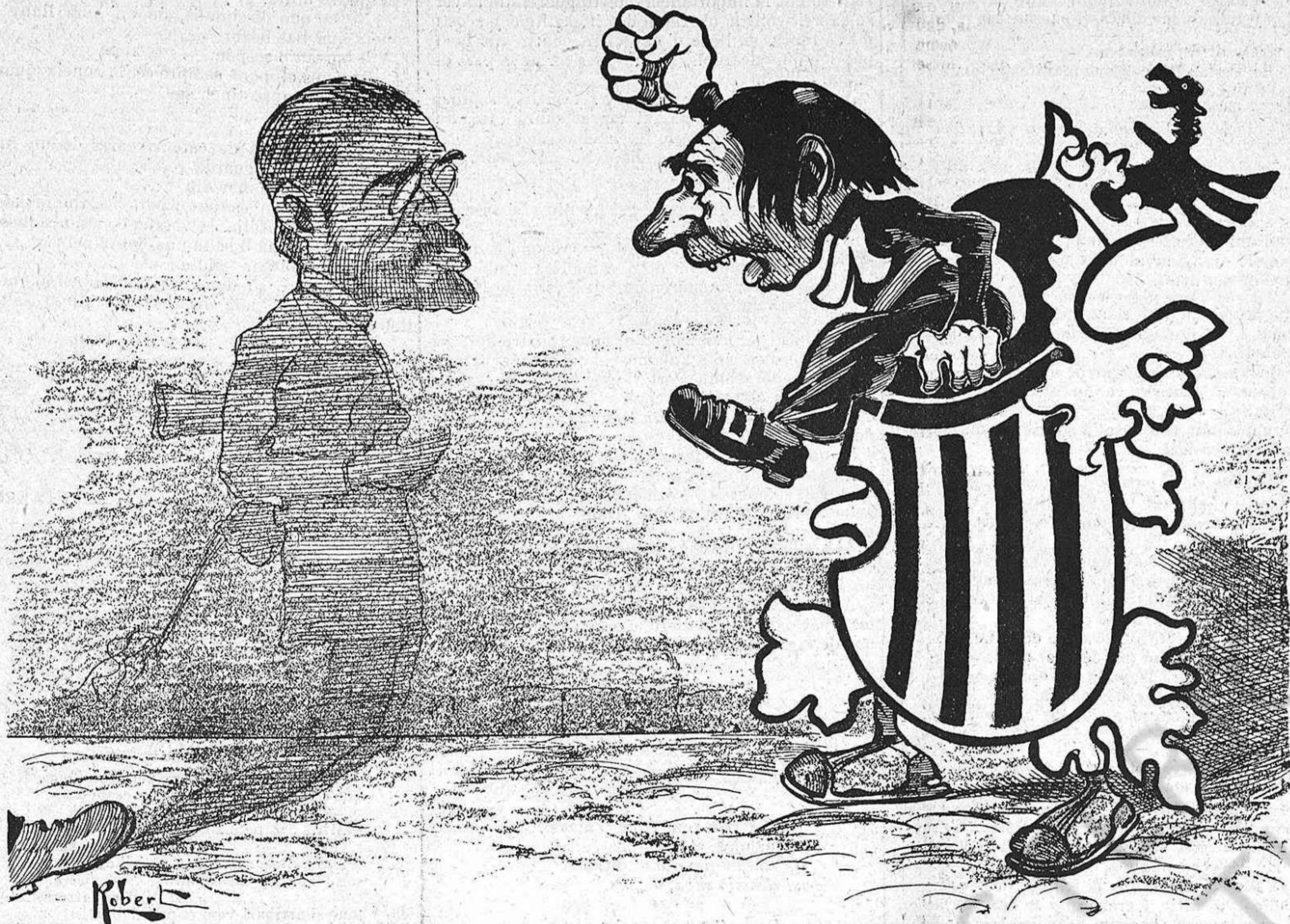
Miréu si 'ls exaspera en Canalejas, que no mes l'aparició de la seva sombra ha fet sortir l'apuntador de la conxa.

ab l'esperansa de llansarlo fora del camp monárquich.