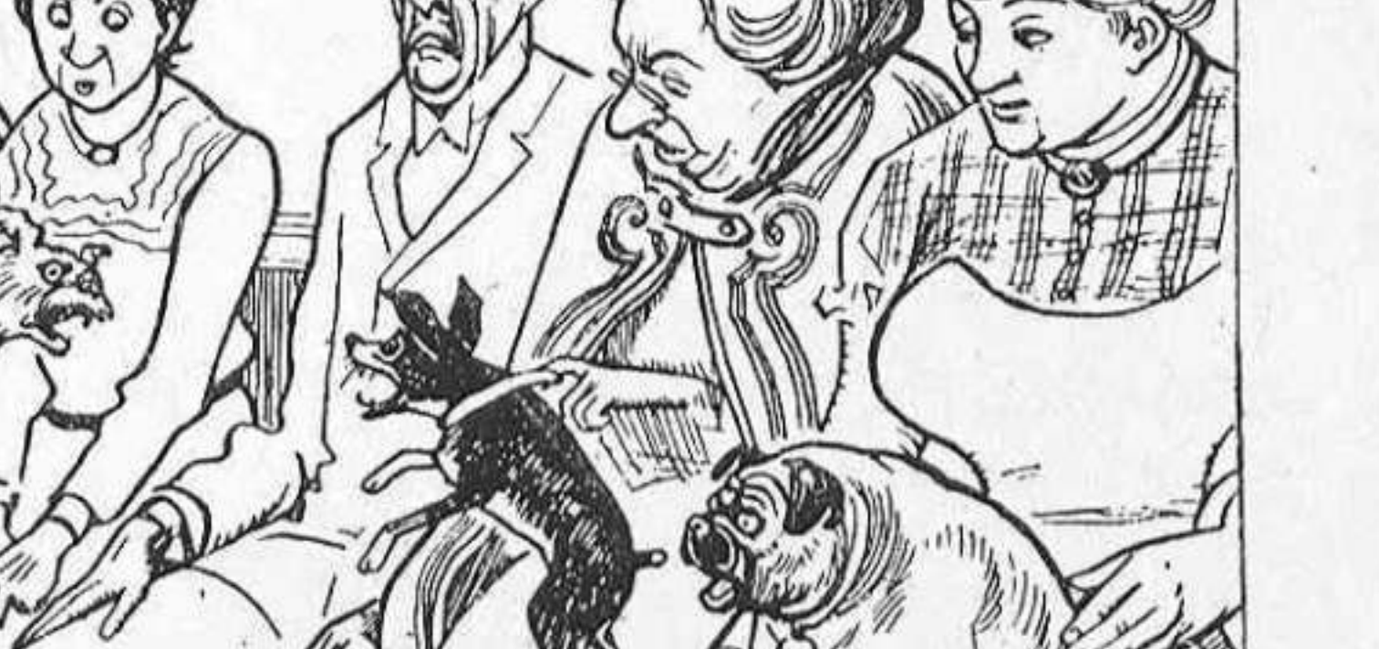
LA PENITENCIA.—Durant un mes seguit, tiraréu cada día una pesseta á la caixa de las ánimas. (De L' Assiette au beurre.)