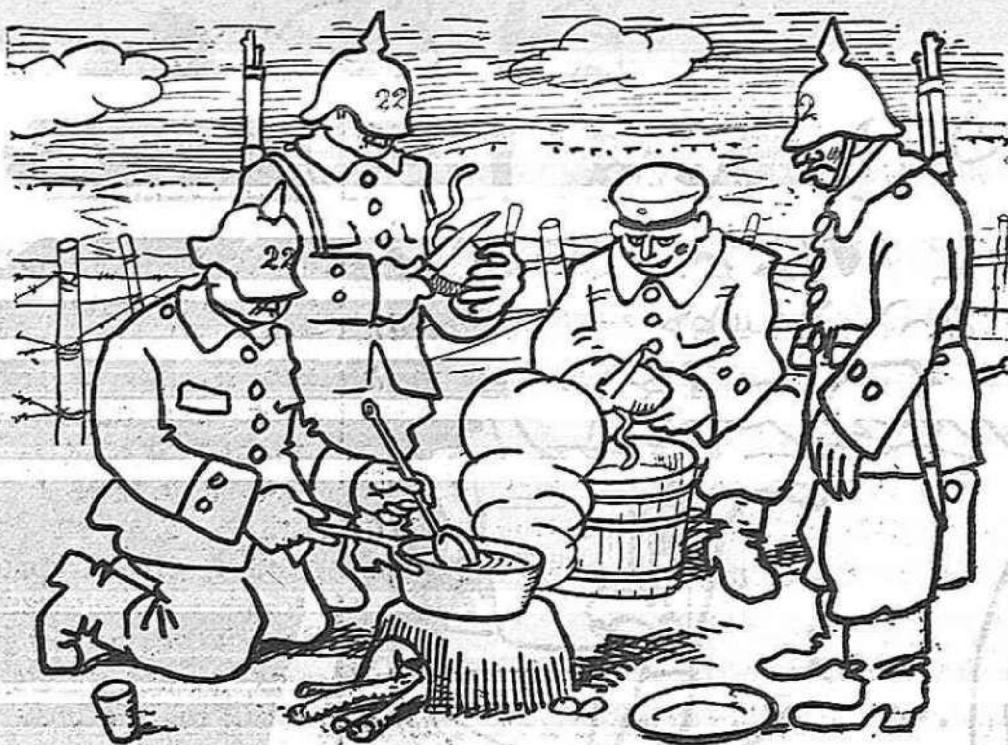
—Què us agrada més d'aquest poble que hem invadit? —A mi les dones. —A mi les joies. —A mi les dones amb joies.