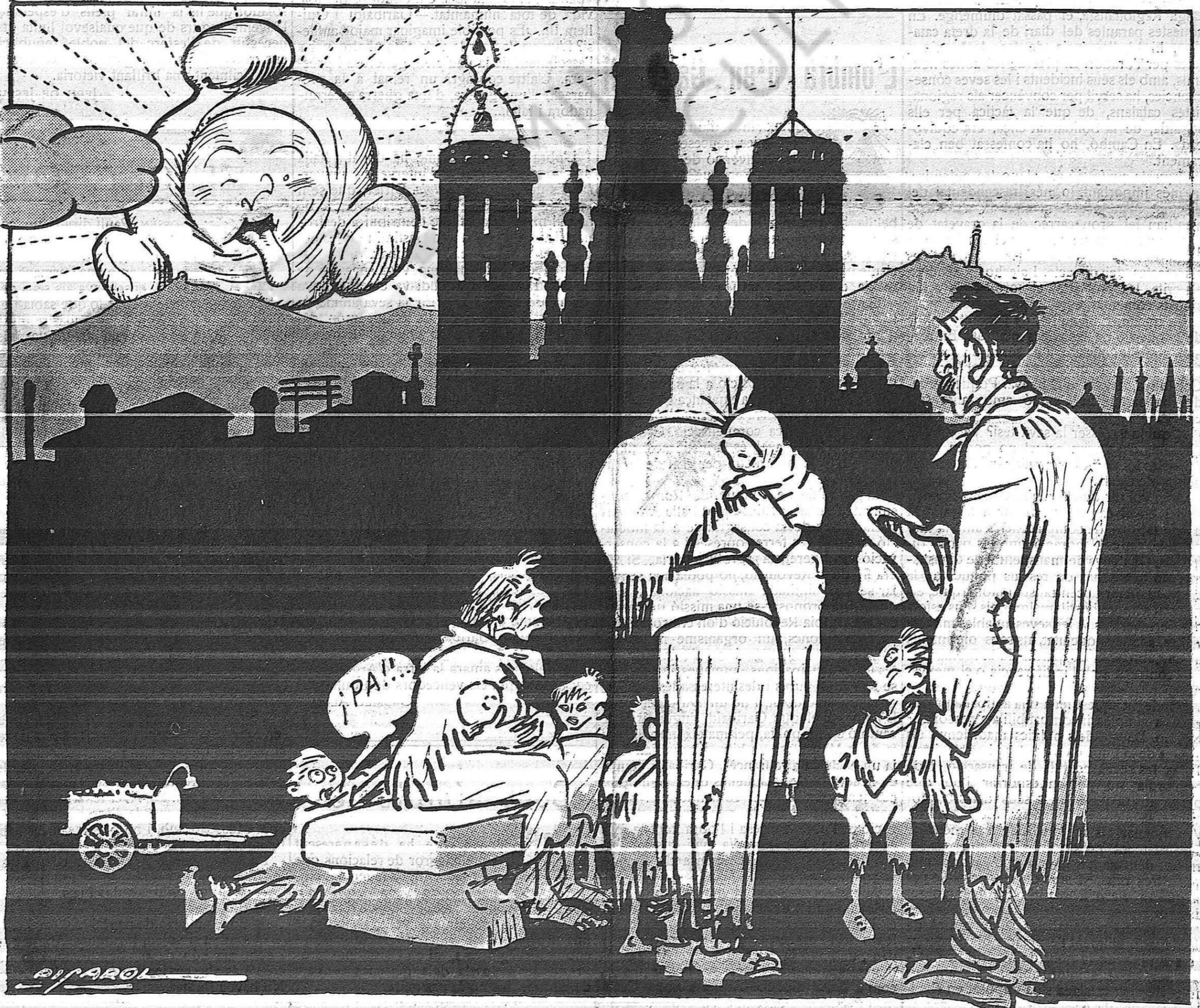
—Ja tenen raó els poetes... Que n'és de trista la posta del sol!...