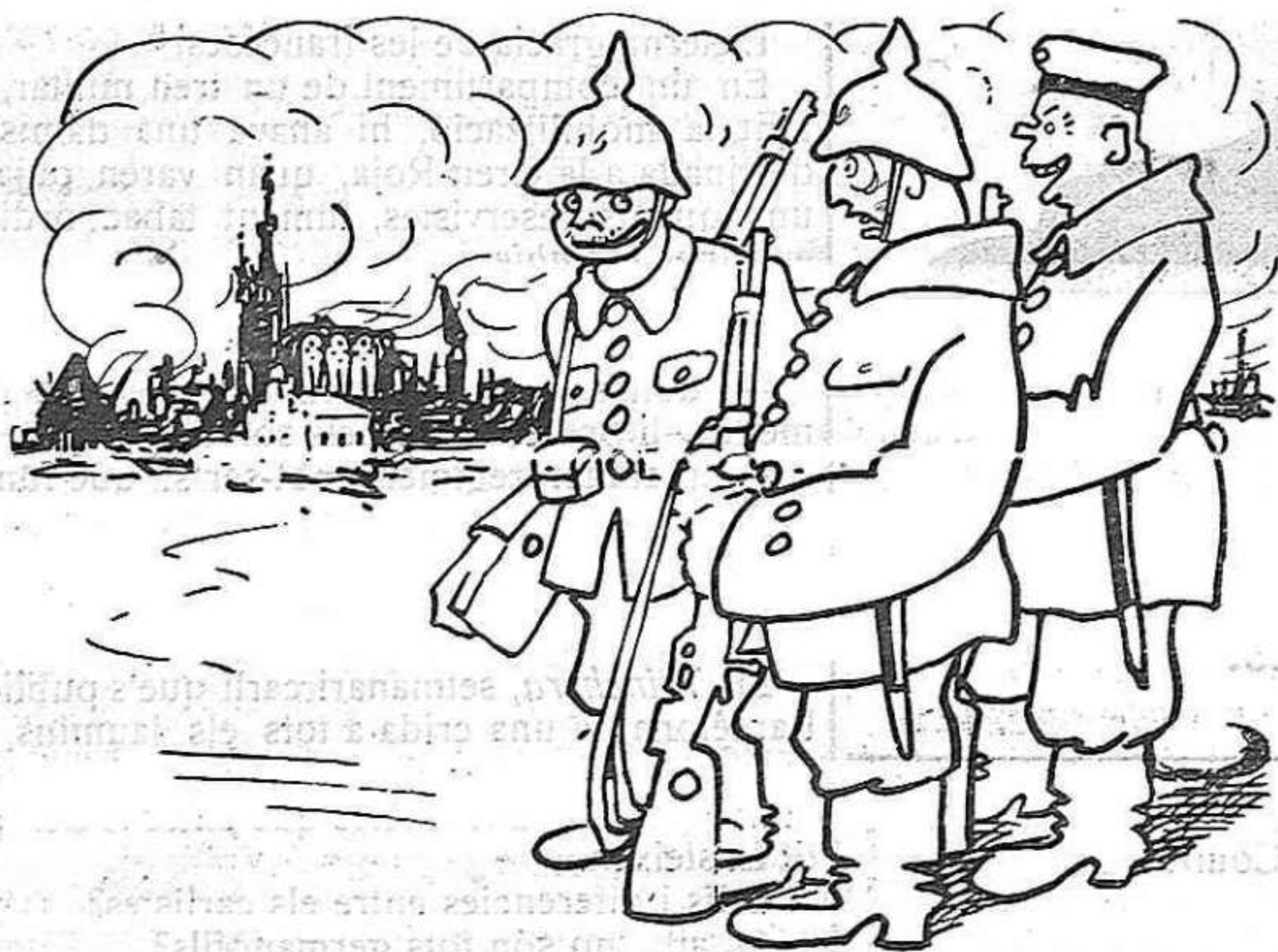
—Sabs que crema molt bé, aquest poble... —Massa bé, home! Després no s'hi troba res!...