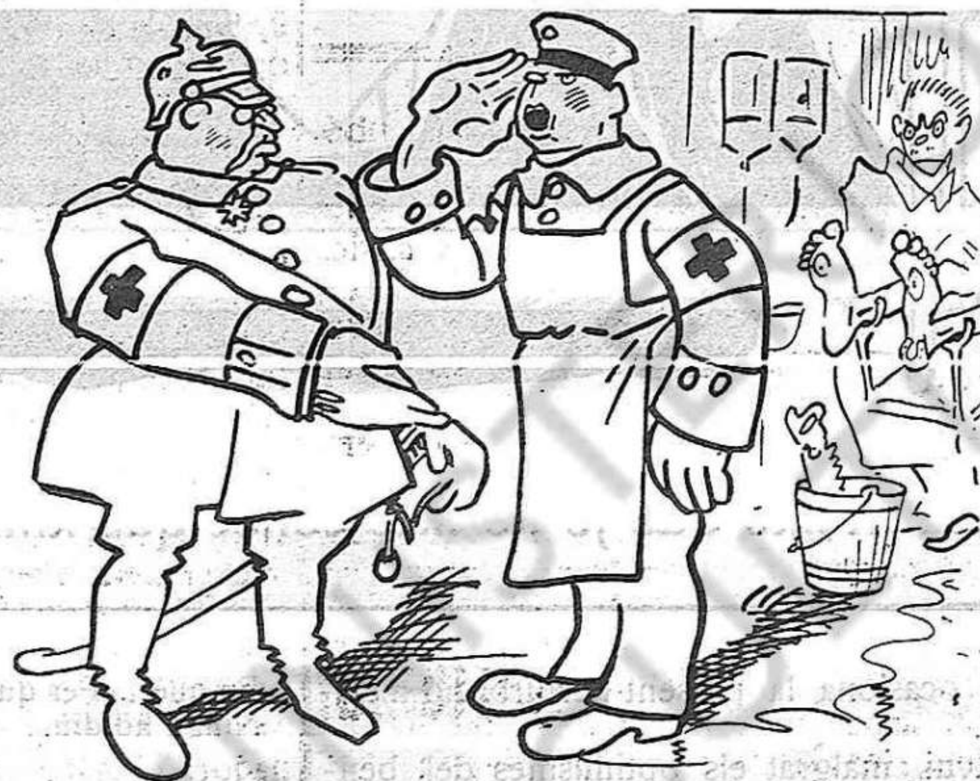
—Senyor Komandant: No quèden venes per als nostres ferits —No?... Desenveneu als anglesos.